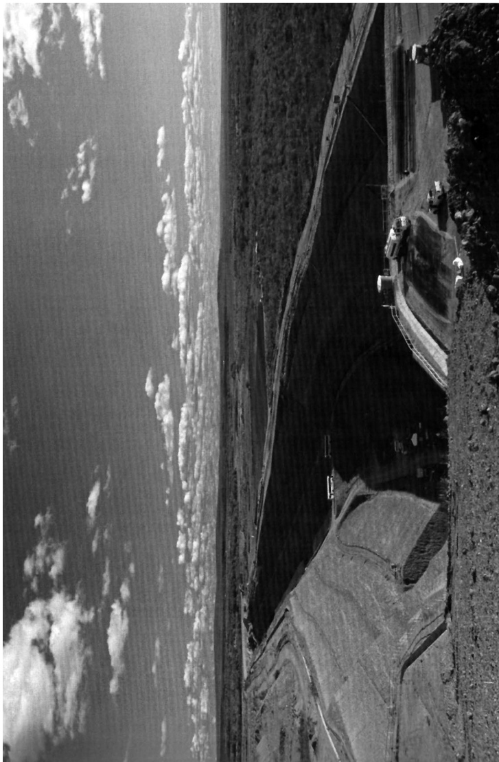
Imagen 2: Canal del eje Este en construcción, cerca del Reservatorio de Itaparica, en el río São Francisco.