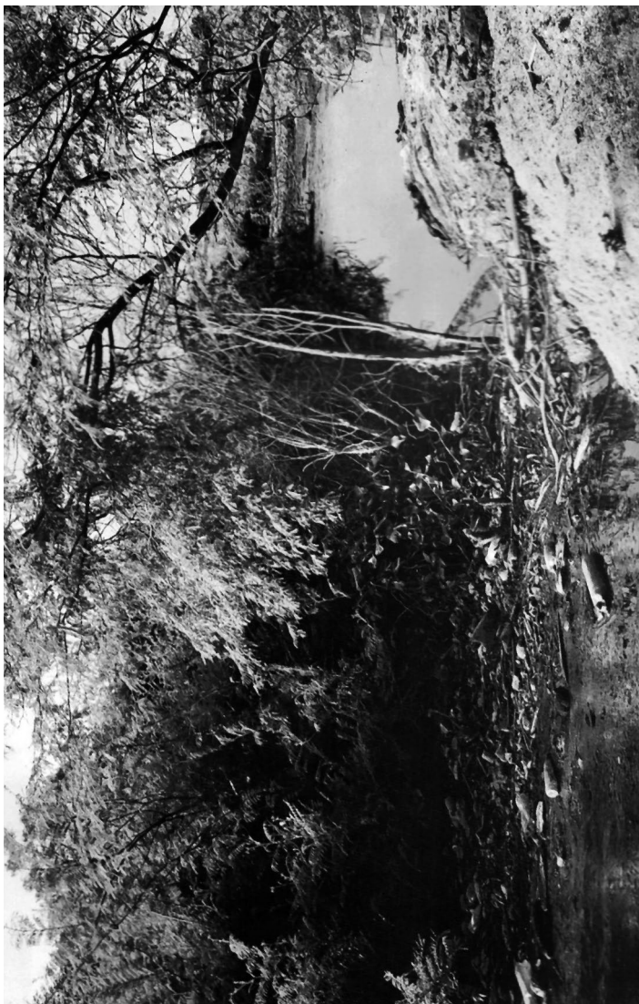
Imagen 5: Basura tirada al río São Francisco-Petrolina (Pernambuco). Fotografía de João Zinclar. En Zinclar, Sant'Anna (2005).