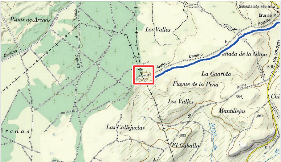
Fig. 4. Antiguo camino de Portillo, zona de Los Valles, y posible localización de la “caba vieja”.