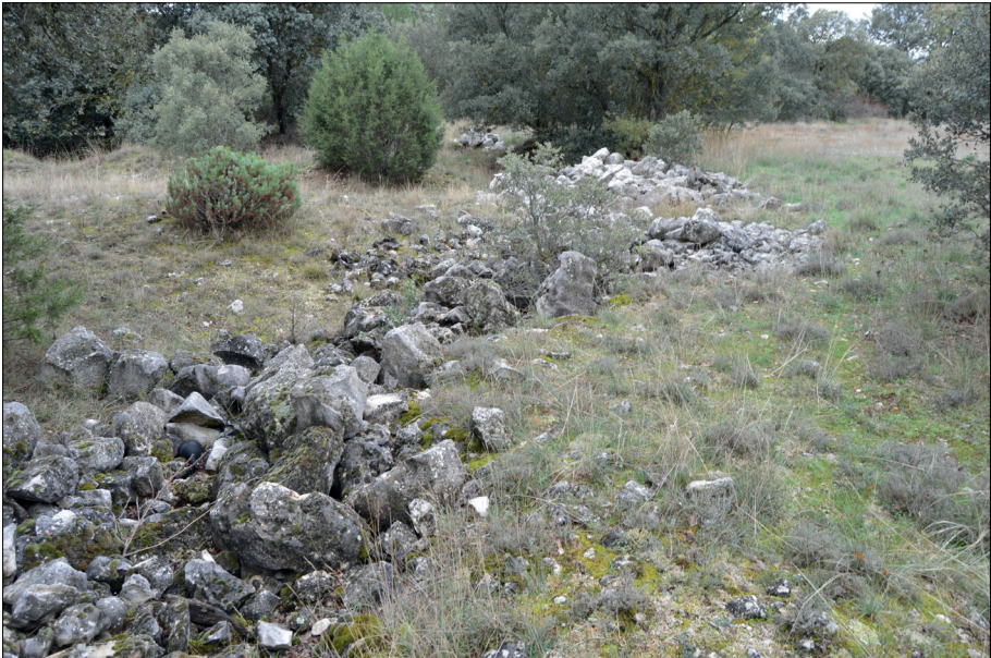
Fig. 6. Hitos en forma de apilamientos de piedras y materiales.