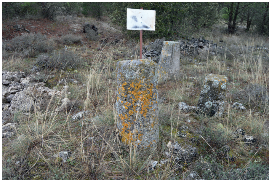
Fig. 7. Hito de posible origen medieval en la zona llamada “la caba vieja”.

situarse también en un apeo realizado a instancias del infante Juan, futuro Juan II de Aragón, y que en esos momentos era señor de Portillo y Cuéllar.