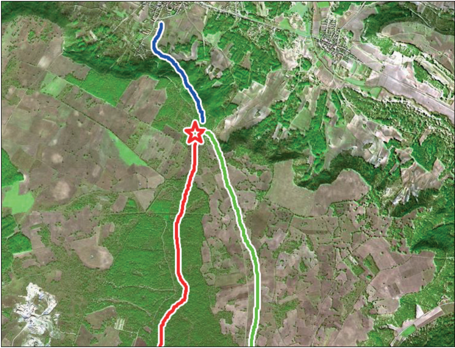
Fig. 3. En verde, el camino de Traspinedo a Montemayor. En rojo, el antiguo camino de Hoyohondo. La estrella señala el punto donde se cruzan ambos, y donde comienza el sendero de descenso a Traspinedo, en azul.