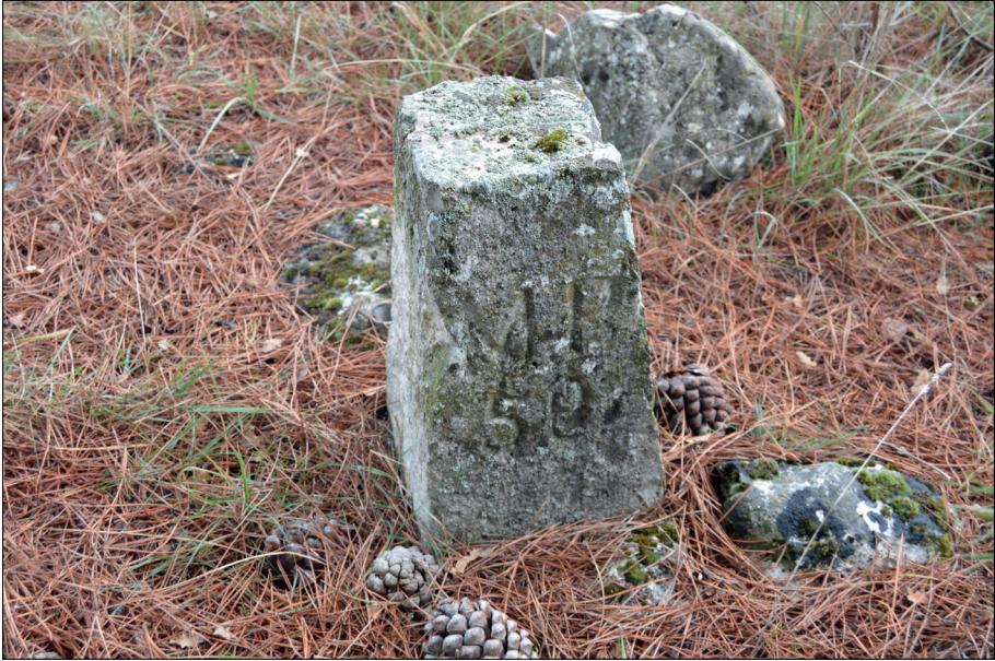
Fig. 5. Tipo de mojón más habitual en la zona, con la leyenda M P (monte público).