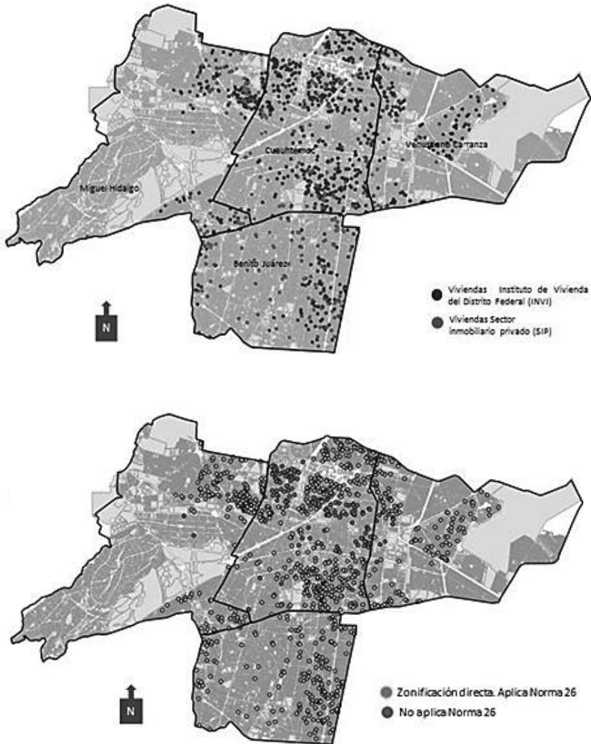
Figura 2. Construcción de vivienda de interés social y zonificación donde aplica la NGO 26

Fuente: elaboración propia con base en el Registro Único de Vivienda (RUV), en información proporcionada por el Instituto de Vivienda del Distrito Federal (Invi) y en el SIG de la Secretaría de Desarrollo Urbano y Vivienda. Cartografía del Observatorio Urbano de la Ciudad de México, UAM-Azcapotzalco.