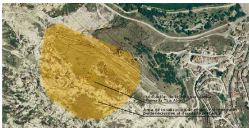
Área que ocupa el yacimiento y localización de «La Abadía».

(actualmente visible) y para poder realizar el paseo de ronda de esta improvisada torre de fusilería debieron practicar oquedades en los contrafuertes. A día de hoy son visibles numerosas marcas de disparos tanto de fusilería como de artillería en las paredes de la iglesia.