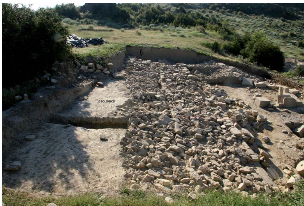
GEM2 y drenaje anexo.

La relación que GEM1 establece con GEM2 a nivel de interfaces es confusa, puesto que la actividad positiva y negativa llevada a cabo en el punto de confluencia dificulta una lectura precisa. Son ciertas, como ya se ha señalado, las particularidades de GEM1 con respecto al resto del espacio urbanizado, sin embargo, aconsejados por otros aspectos como la funcionalidad de ambos grupos estratigráficos, los sistemas constructivos empleados y las relaciones que establecen con el resto de elementos y depósitos con los que ambos se encuentran relacionados, es posible plantear que estos dos grandes elementos se erigieran próximos en el tiempo pero obedeciendo a momentos de obra sucesivos, como paso previo y necesario para la configuración de un espacio de uso a media ladera. Su construcción implicó un esfuerzo de preparación notable puesto que supuso alterar el perfil natural del cerro, excavando el sustrato geológico para alcanzar la cota requerida (-2,96 en el extremo suroeste de GEM1, -4,50 en la base de GEM2).