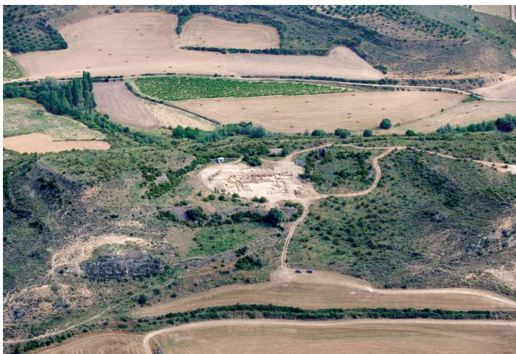
Emplazamiento de la excavación en el conjunto del yacimiento.

La intervención sistemática llevada a cabo en las inmediaciones del espacio forense de la civitas apenas si alcanza el 1% del espacio total estimado para el conjunto de la ciudad romana (en torno a las trece ha), y afecta topográficamente a la parte central del cerro delimitada por dos altozanos a este y oeste.