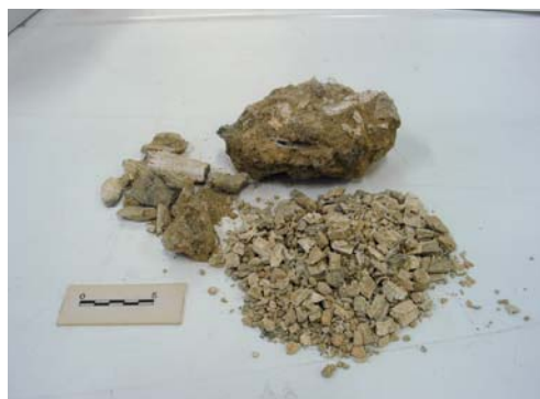
Recinto funerario I. Urna cineraria y contenido óseo conservado en la misma, correspondientes a la tumba 11-nivel IV.

Así, entendemos que el recinto funerario I acogió las sepulturas de doce personas miembros de una misma familia. El hallazgo de un fragmento epigráfico, seguramente perteneciente a la cartela que exhibía el mausoleo hacia la vía sepulcral, hace alusión al nomen Calpurnius . La monumentalidad y la ubicación de dicho edificio indican que esta familia formaría parte de la elite de la ciudad, tal vez emparentados con los Calpurnii documentados en el cercano yacimiento de Camporeal (ERZ n. 41) y con esta Calpurnia de Andelo (CIL II, 2967) cohabitando con miembros de la gens Aurelia ( vid supra ) y Valeria , el nomen más frecuente relacionado hasta el momento con este lugar.