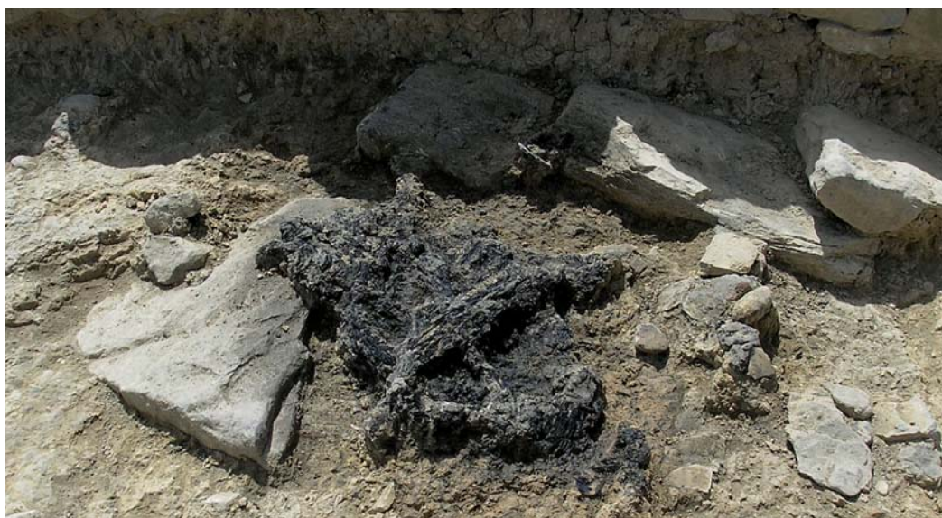
Recinto funerario I. Troncos carbonizados seguramente relacionados con un silicernium (nivel inferior).

recinto se han podido registrar cuatro hiladas en el muro norte del monumento y dos hiladas en el muro sur, sin que se haya detectado entre los mampuestos ningún resto material que pudiera servir de unión o trabazón. Las labores de excavación en la zona aneja no han permitido documentar elementos arquitectónicos que den pautas sobre la altura de estos paramentos, ni si hubo otro sistema de alzado erigido sobre los mismos (por ejemplo de madera, clavos) o que hagan presumir la existencia de una cubierta (teguas, lajas). Tampoco tenemos evidencias de vanos o de otro modo de acceso a su interior. Al exterior las cuatro paredes estuvieron decoradas con pintura mural y, aunque estas no han sido todavía restauradas, algunos de sus fragmentos permiten afirmar que en su parte oeste se utilizó el color rojo, algo habitual en este tipo de edificios, y que la parte norte ofreció al viandante sencillos motivos vegetales de colores variados (verde, amarillo y rojo) seguramente enmarcados entre líneas. No existen indicios de este enlucido dentro del recinto. Entendemos por estas circunstancias que se trata de una estructura similar al recinto funerario II y que como este ha de adscribirse a la tipología de «monumentos indeterminados» o de «recintos acotados».