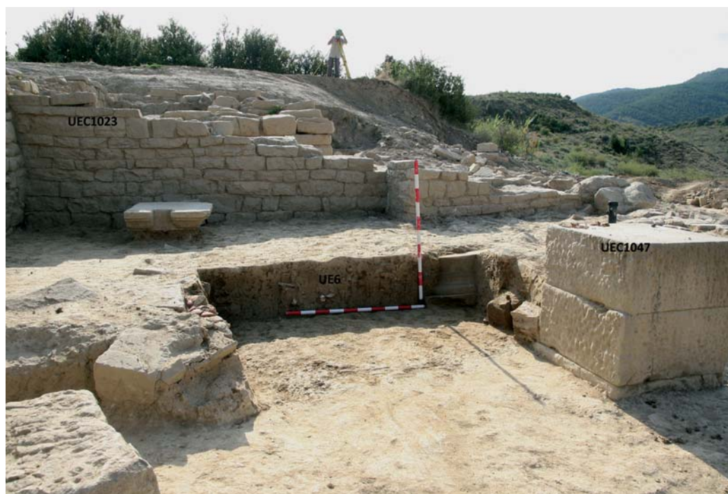
Criptopórtico. Nivel de abandono.