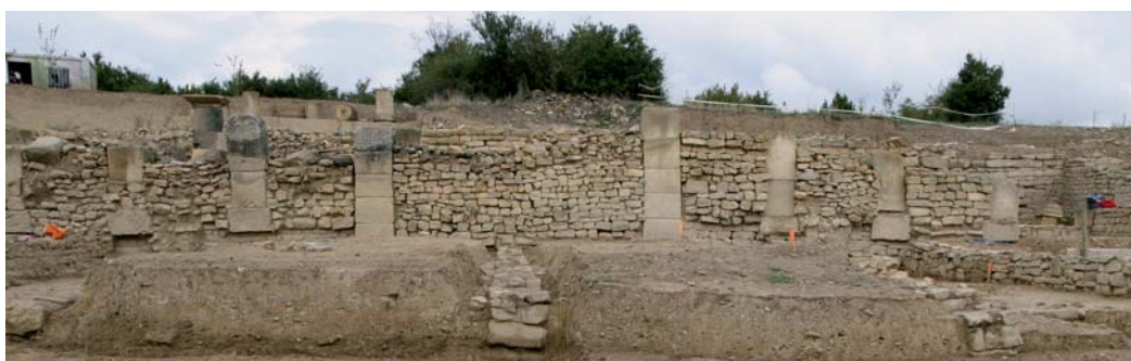
El criptopórtico. Detalle de GEM4.

por haber sufrido especialmente una serie de alteraciones, reformas y añadidos que le confieren un aspecto formal distinto al resto del muro sur rompiendo de algún modo la cadencia relativamente armónica de encadenados y entrepaños adoptando, entre otras circunstancias constructivas, un intercolumnio más reducido e incluso irregular en este sector, unas dimensiones también menores del volumen de los encadenados de sillar y unas dimensiones de fábrica de mampostería diferentes que ligan directamente su devenir al del complejo sector occidental de la excavación apenas intervenido salvo a cota de sus principales interfaces.