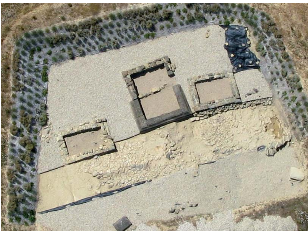
Vista aérea del Sector B, necrópolis. Superficie excavada hasta 2006.