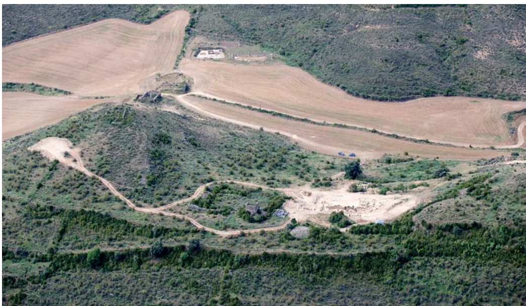
Vista aérea de Santa Criz (2014). En la parte superior la parcela en la que se ubica la necrópolis vista desde la ciudad.