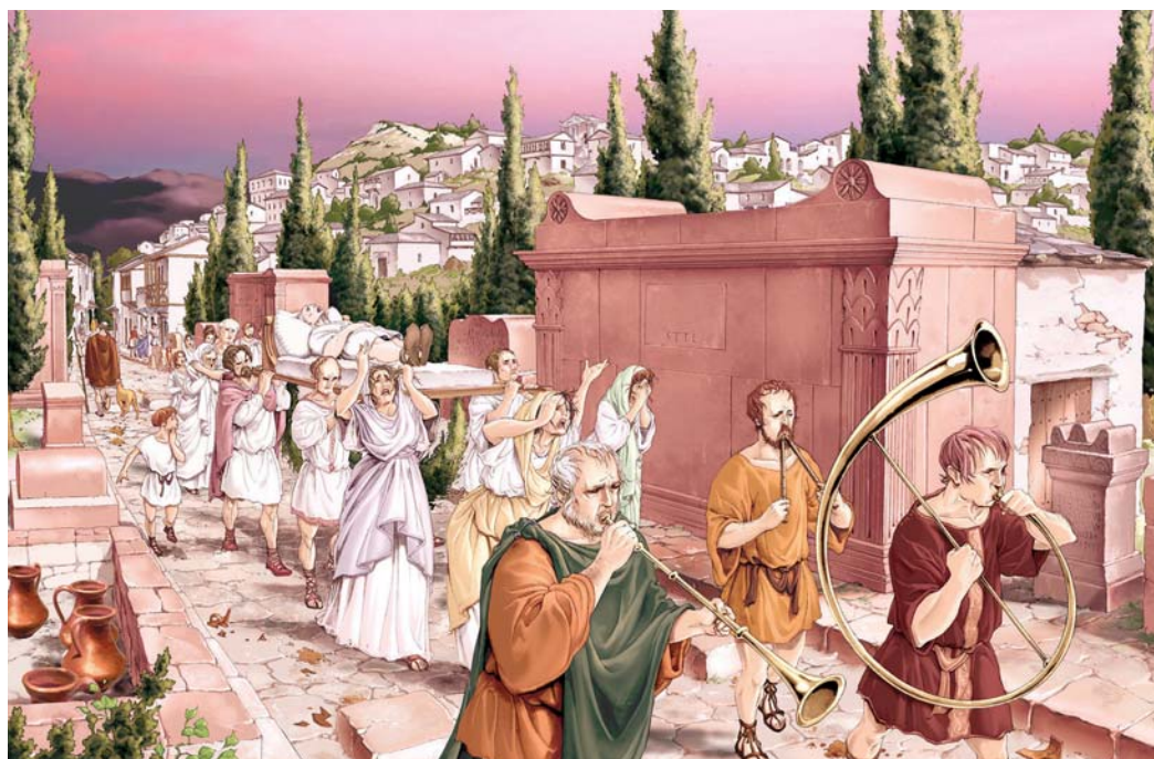
Recreación de cortejo fúnebre en la necrópolis de Santa Criz con la ciudad al fondo. A la derecha interpretación del recinto funerario 1 y estela de Piculla y a la izquierda urna cineraria (tumba 11). (J. L. Landa).

La factura de los elementos epigráficos, arquitectónicos y decorativos ofrecen rasgos de la influencia del arte romano, tanto hispano como galo, de la tradición prerromana así como de elementos propios de maestros de la urbs y de la artesanía local, lo que pone de relieve la receptividad de la población, tan visible de manera especial en su onomástica. Algunos de los hallazgos de este espacio cementerial aluden a la presencia de soldados en la ciudad sumándose así estas evidencias a las estudiadas en el entorno del foro.