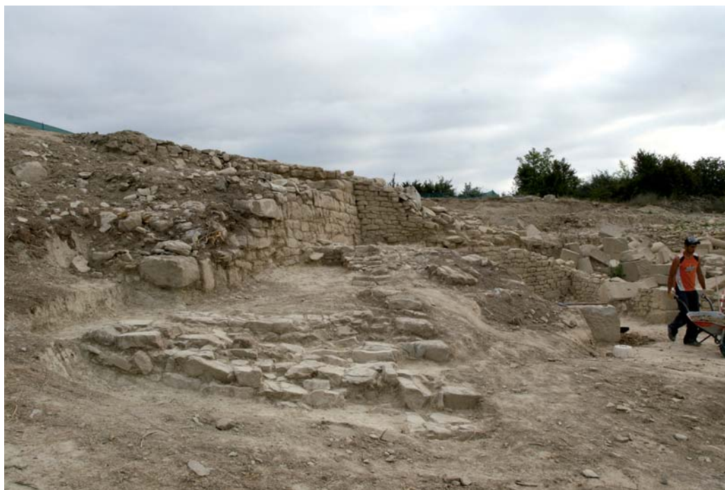
GEM1 y estructuras asociadas.