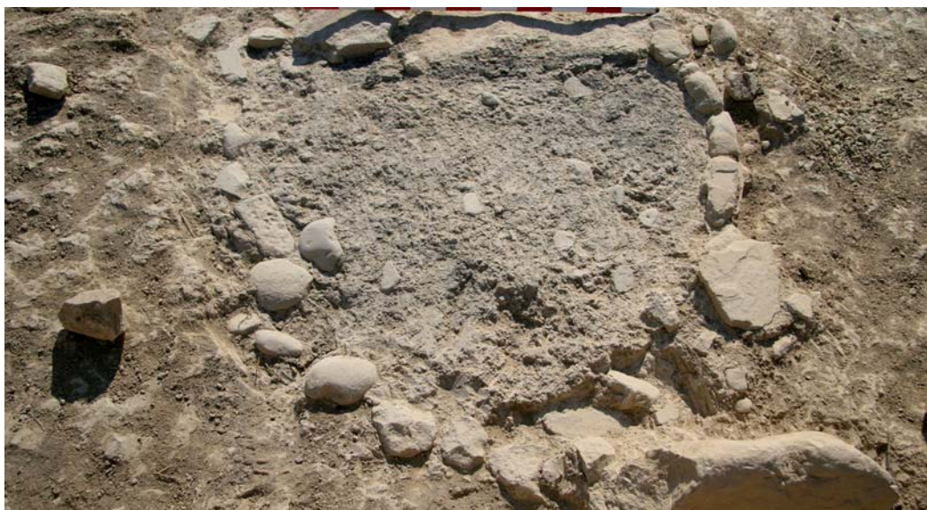
Sepultura «a cielo abierto». Nivel de cremación abierta hacia el este, delimitados por cantos y señalizada (tumba 25).

En el entorno de estos monumentos funerarios, sobre el suelo de uso y sin orden pre-fijado, se recuperan ocho sepulturas individuales que no están circunscritas a ninguna estructura arquitectónica. Son tumbas de tamaños comprendidos entre los 0,60 m y 0,90 m que presentan manchas carbonosas y evidencias de huesos quemados que son delimitadas por anillos de cantos rodados o pequeñas piedras de tamaño regular sobre las que se levantaría una cubrición de tierra a modo de túmulo. Junto a los restos óseos se recuperan fragmentos de cerámica, chinchetas, clavos, escorias de hierro y huesos de animal sin quemar procedentes de los banquetes funerarios. Aunque solo se ha realizado el análisis paleoantropológico de tres de ellas, los resultados muestran la presencia de ambos sexos, un varón y dos mujeres de edad adulta. Da la casualidad de que el único ajuar, una cuenta de collar de hueso y una pequeña espátula o cincel similar a estos destinados al uso cosmético, corresponde a una de estas segundas (tumba 23). Solo en un caso se han conservado vestigios de señalización (tumba 25), a modo de cipo de piedra. No contamos con evidencias que puedan ofrecer una cronología clara para estos enterramientos si bien su presencia sobre el trayecto de la vía sepulcral podría ser indicio de una disposición tardía.