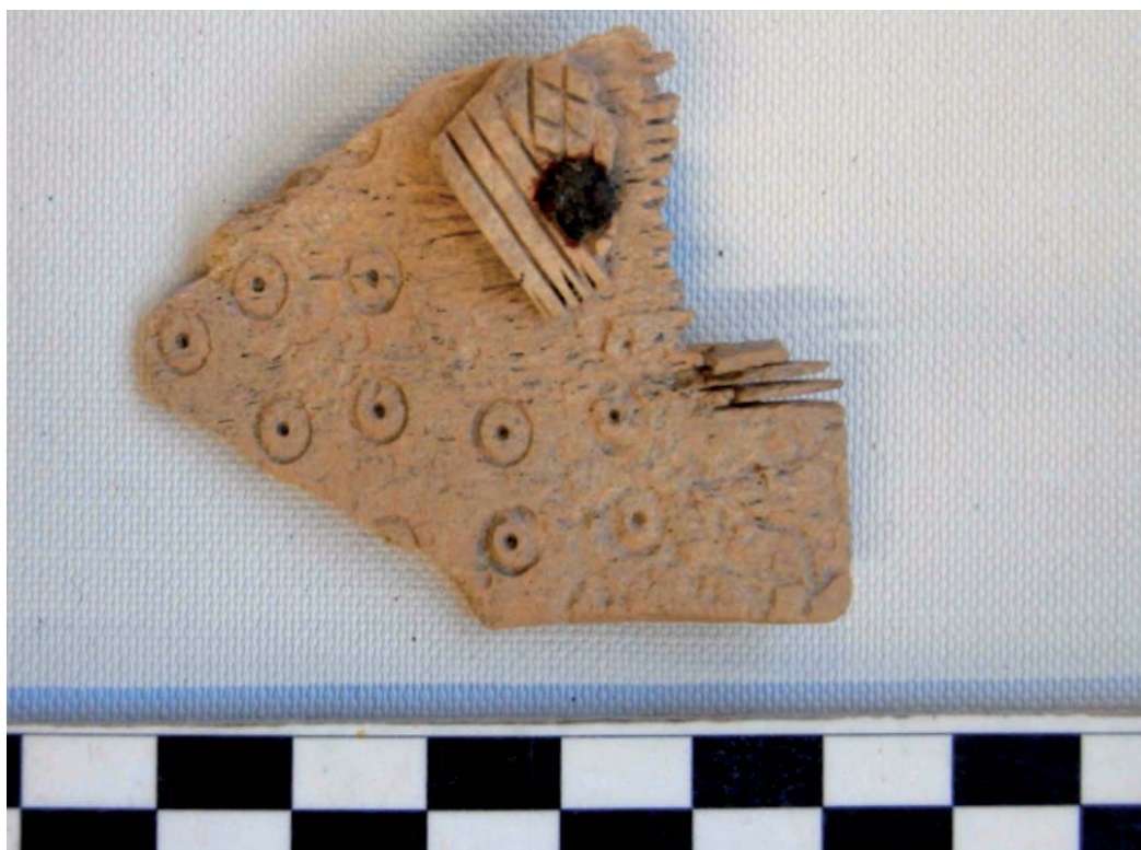
Peine de hueso.

Solamente en dos ocasiones ha podido reconocerse un cierto espacio de uso interno: una de estas estructuras pudo utilizarse como redil de ganado, mientras que en otro de los casos la actividad antrópica documentada tuvo lugar una vez amortizado el propio recinto con una colmatación de derrubios, y consistió en la excavación de una pequeña fosa rellenada posteriormente con tierra carbonosa y ceniza. El lote de material mueble relacionado con esta unidad de relleno ofrece algunas pautas cronológicas interesantes puesto que contiene una hebilla de bronce arriñonada con decoración de líneas incisas y un fragmento de peine de hueso delicadamente decorado con círculos, rayas paralelas y reticulado, asimismo incisos, que otorgan a esta actividad posterior a la colmatación de los recintos un terminus post quem fijado en los siglos IV-V d. C.