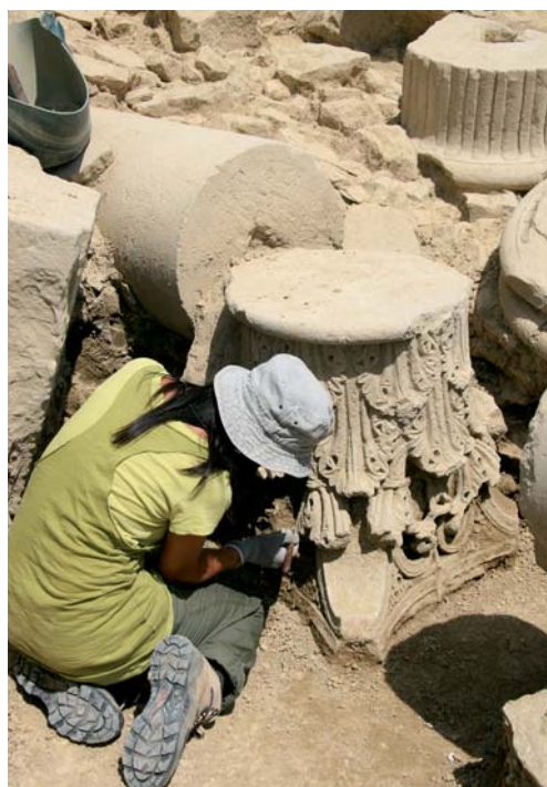
Proceso de excavación de capitel corintio.

El nivel de tierra de abandono que selló el derrumbe masivo y que ha podido seguirse a lo largo de todo el criptopórtico a unas cotas muy similares constituye, especialmente en la mitad oriental del mismo, el soporte de otro tipo de actividades verdaderamente difíciles de concretar dado su grado de arrasamiento y sobre todo el carácter provisional o secundario estimado para ellas. La mayor parte consiste en muros toscos conservados en precario y elaborados con elementos reutilizados. Cuando estas estructuras se levantaron, el criptopórtico había acusado de manera muy radical el proceso de ruina de modo que algunos de sus tramos se disponen sobre cotas muy arrasadas de sus elementos principales (GEM2, pilares centrales, cierre oriental). Tampoco se han conservado, en el caso de que los hubiera, depósitos de actividad ligados a ellas. Estas pautas formales descritas del conjunto de estructuras