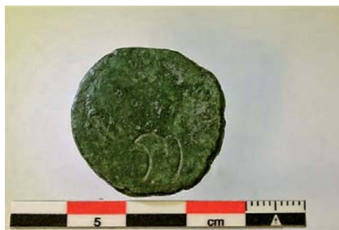
Moneda con contramarca del águila.