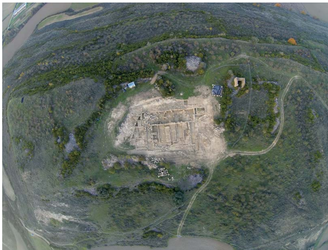
La excavación a vista de pájaro.

global y, al margen de algunas estructuras marginales del sector occidental que parecen un tanto desligadas del diseño ordenado y racional, criptopórtico, distribuidores laterales y recintos centrales del area forman parte de un proyecto urbanístico previo (fase I) modificado de manera más o menos sustancial a lo largo de los siglos, especialmente en la segunda mitad del siglo I d. C. (fase II) y la primera mitad del siglo II d. C. (fase III).