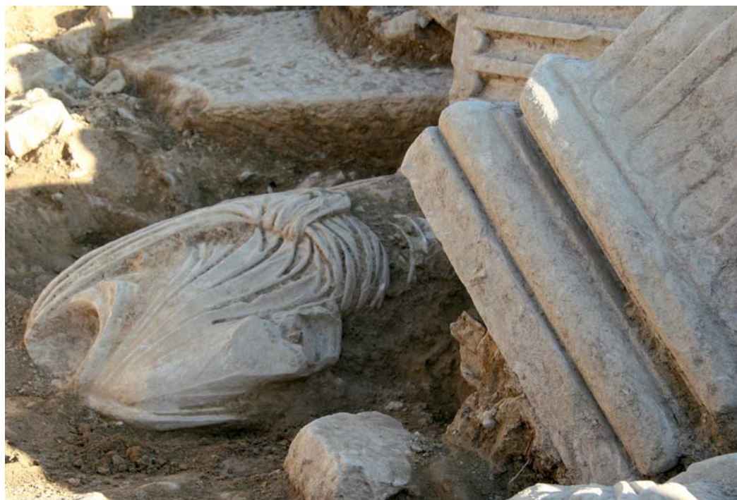
Exhumación del personaje togado.