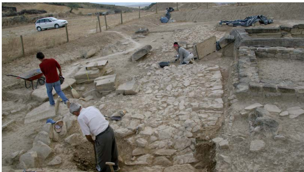
Proceso de excavación en la vía sepulcral. Campaña 2007. A la izquierda restos arquitectónicos monumentales y a la derecha, delante del recinto funerario I, las cornisas.

Las labores de excavación sistemática permitieron recuperar delante de la construcción, sobre la vía, varios elementos arquitectónicos que por su cercanía ponemos en relación con este edificio que nos ocupa: tres sillares con decoración en esquina que encajan entre sí y representan una columna acanalada coronada por capitel corintio, casi la totalidad de la cornisa moldurada que coronaba el edificio, un baltheus con decoración de hojas de piña, el frontal de dos pulvinos y un fragmento epigráfico de tipo monumental, a modo de bloque para encastrar, con las letras ]ALP[ en capital quadrata . A modo de hipótesis y desconociendo si entre los sillares decorados en esquina y la cornisa se sostenían otros elementos, podemos considerar que la altura total del edificio rondaría los 3 m, 3,64 m incluyendo el podio (0,60 m, podio; 0,33 m, planta moldurada; 2,13 m, altura de la esquina de opus quadratum ; 0,30 m, cornisa; 0,28 m, pulvino). La totalidad de la estructura se ha realizado sobre piedra local de tipo arenisca (calcarenita), detectándose restos de enlucido junto a la fábrica de mampostería, en el interior de su mitad sur.