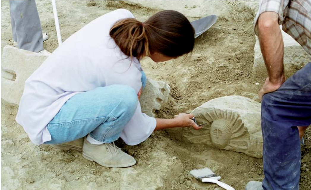
Frontal de pulvino con alargamiento lateral hallado en 1996 que fue escogido como logotipo para representar al yacimiento.