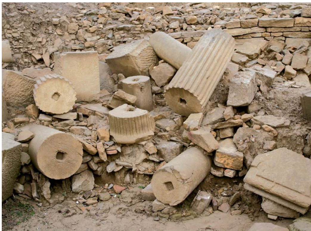
Sección parcial del derrumbe masivo del criptopórtico.

Además de estos ejemplares significativos, la unidad también está conformada por los derrumbes de sus propios elementos portantes: muros perimetrales, pilares centrales y contrafuertes, que, en el caso de ofrecer un grado alto de fiabilidad sobre su ubicación original, han sido restituidos en el proceso de puesta en valor. El material mueble asociado a estas unidades ha resultado ciertamente escaso y poco concluyente, consistiendo en pequeños lotes de fragmentos cerámicos minúsculos y muy rodados de producciones diversas, aunque priman los hallazgos de TSH y vasijas engobadas. El monetario descubierto también ha sido muy escaso, ofreciendo las piezas encontradas una cronología del último tercio del siglo II, siglo III (acuñadas en Roma entre los años 164-166, 222-235 y 268-270).