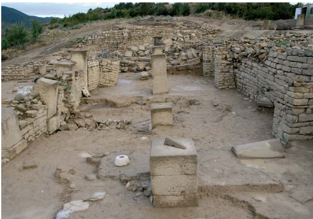
Sistema de contrafuertes en el interior del criptopórtico.

La cota de circulación, a falta de evidencias de solado de cualquier tipo (no ha aparecido ni material pétreo ni latericio, tampoco hormigón ni otros morteros endurecidos, como tampoco se ha exhumado unidad ninguna de tierra batida que pudiera ejercer esta función de suelo) se relaciona con la fina capa de cal detectada en los dos sondeos efectuados en el interior de este recinto y en las zanjas de drenajes excavadas durante la obra civil de consolidación, que nos indica una cota mínima para el nivel de circulación de -4,48.