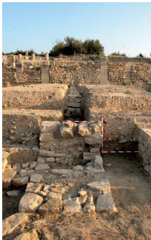
Zapata aislada del cierre sur.

La hipótesis funcional que se baraja con respecto a estos habitáculos se orienta hacia el ámbito de los horrea . Ya su propia orientación y ubicación en los alrededores del espacio forense estaría en coherencia con lugares de almacenaje de bastimentos o incluso con la venta directa de mercancías. Estos recintos poseen unas dimensiones útiles y grosores de fábricas concordantes con las comunes en los horrea hispanos. Asimismo, es reseñable en este sentido el hallazgo de unas estructuras cuadrangulares de 0,73 m x 0,73 m, adosadas a la cara interna de los muros, que podrían interpretarse como elementos de