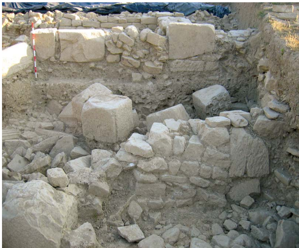
Estructuras tardoantiguas sobre el derrumbe masivo del criptopórtico.

siglos, siguió un largo tiempo de abandono, colmatación posterior y sellado. Fueron estos aportes erosivos que incrementaron la cota del edificio prácticamente hasta la coronación primitiva de sus muros los que siguieron ofreciendo oportunidades de aprovechamiento, completando así un ciclo dilatado desde su primera urbanización hasta las últimas evidencias de actividad de casi cinco siglos de existencia viva.