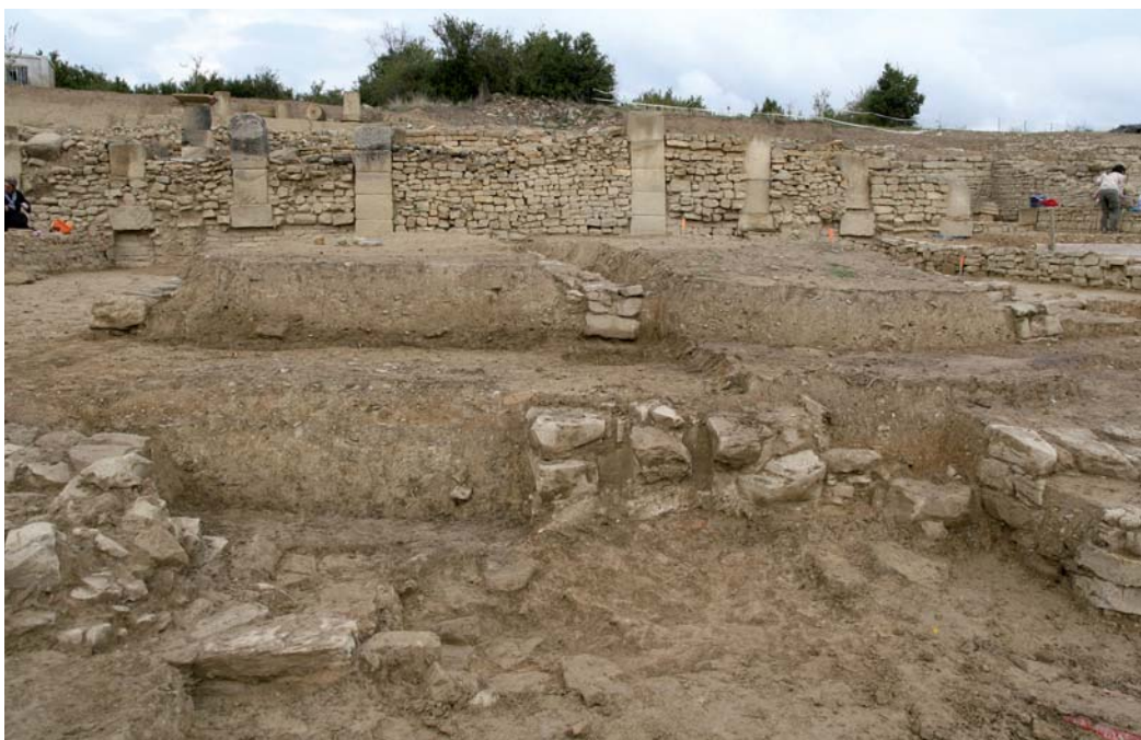
Extremos meridionales de RA ( horrea ).

sustentación del tabulatum a modo de pegollos para favorecer la conservación del grano. Sin embargo, lo limitado de la intervención no ha permitido refrendar la hipotética repetición de elementos semejantes a lo largo de los RA. En cualquier caso, y tal como se ha constatado en otras excavaciones españolas como es el caso de Ilipa , se podía prescindir de este tipo de estructura sobreelevada cuando se almacenara el grano ensacado (Salido Domínguez, 2013: 133).