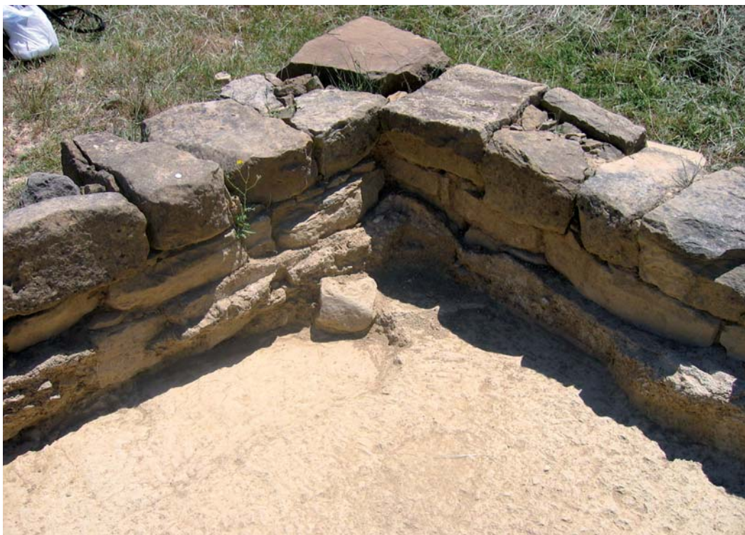
Revestimiento de estuco en el interior del recinto funerario 1.