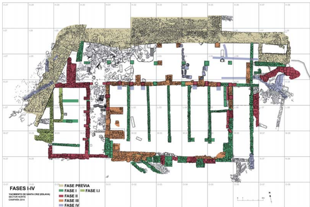
Planimetría. (Iñaki Diéguez Uribeondo).