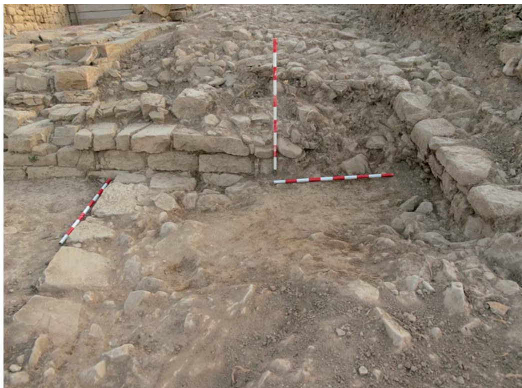
Colmataciones de derrubios asociadas a estructuras tardoantiguas.

la excavación colmatando tramos de la crujía y solapando parcialmente las interfaces de destrucción de sus muros perimetrales, favorecida su dispersión por el buzamiento acusado de la ladera del cerro.