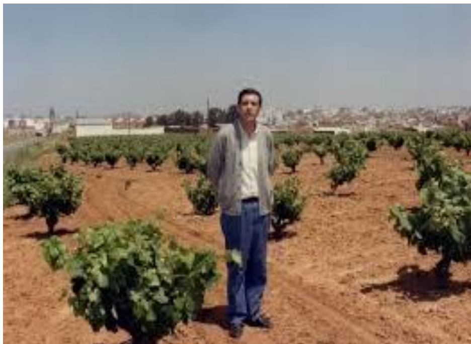
Su gran pasión era la Enología

Journal of Enology and Viticulture (publicación oficial de la American Society for Enology and Viticulture). Die Nahrung-Food o Phytochemistry; contribuciones a congresos, como las realizadas en las Jornadas de Viticultura y Enología de Tierra de Barros, al Congreso Luso-Español para el Progreso de las Ciencias, en la Semana Vitivinícola de Valencia; y en direcciones de Tesinas de Licenciatura y Tesis Doctorales.