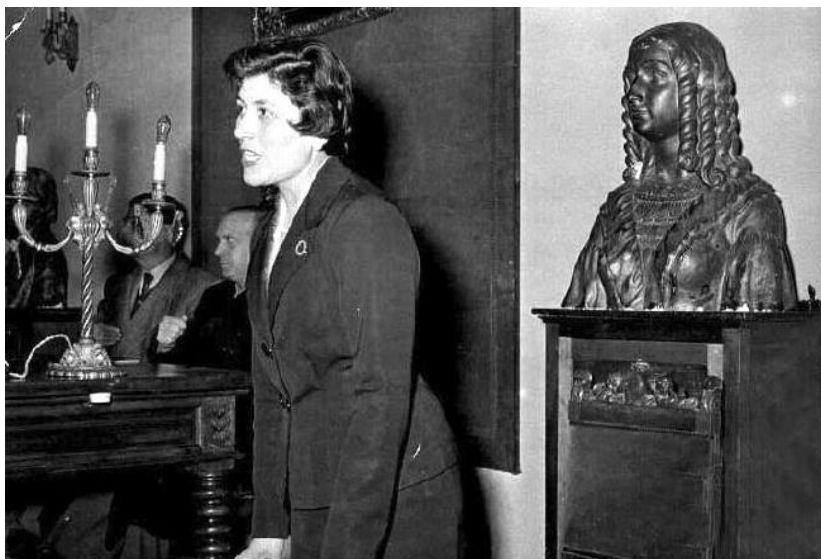
Conferencia Feminismo y feminidad, en febrero 1956

Su inquietud socio cultural será otras de las constantes de su vida, en aspectos y ámbitos diferentes. Su afán era el de difundir la cultura, “ porque cultura es pan, integración, libertad y diálogo ” 1111 .