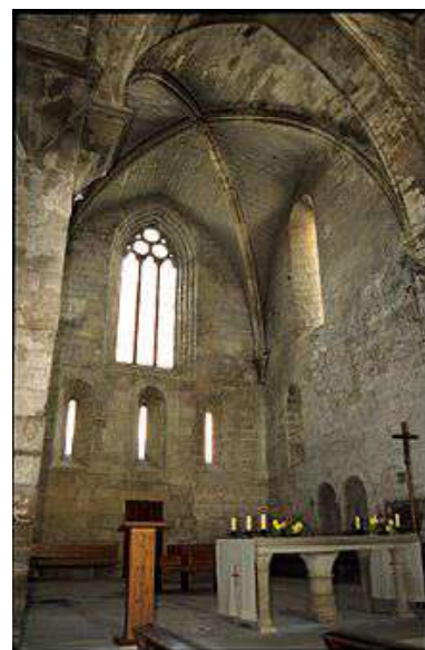
Interior de la nau de l'església de Santa Maria de Vallbona