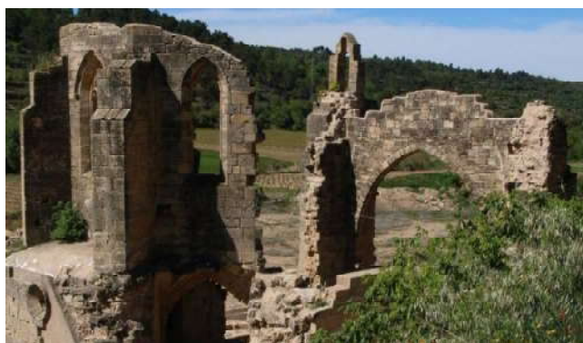
Ruïnes del Monestir de Vallsanta