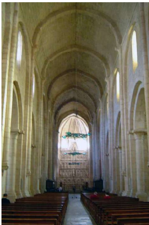
Església del Monestir de Poblet