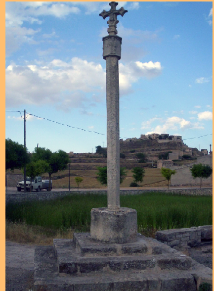
Creu de terme de Forès, al peu del camí a Conesa.