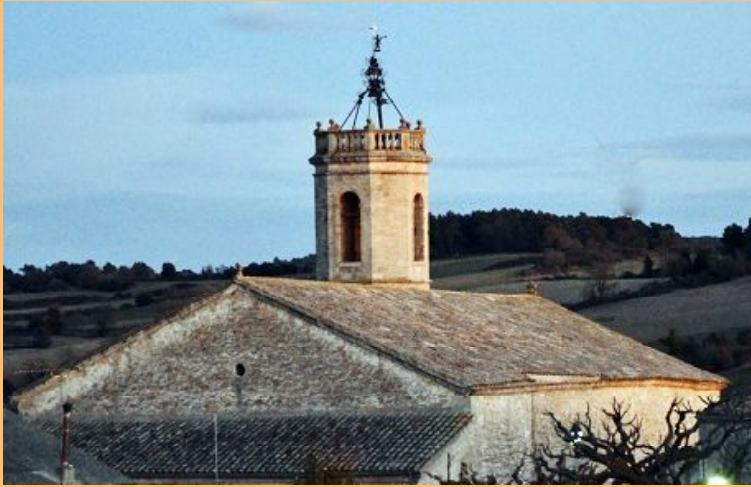
Església parroquial de Sant Jaume, de Passanant.