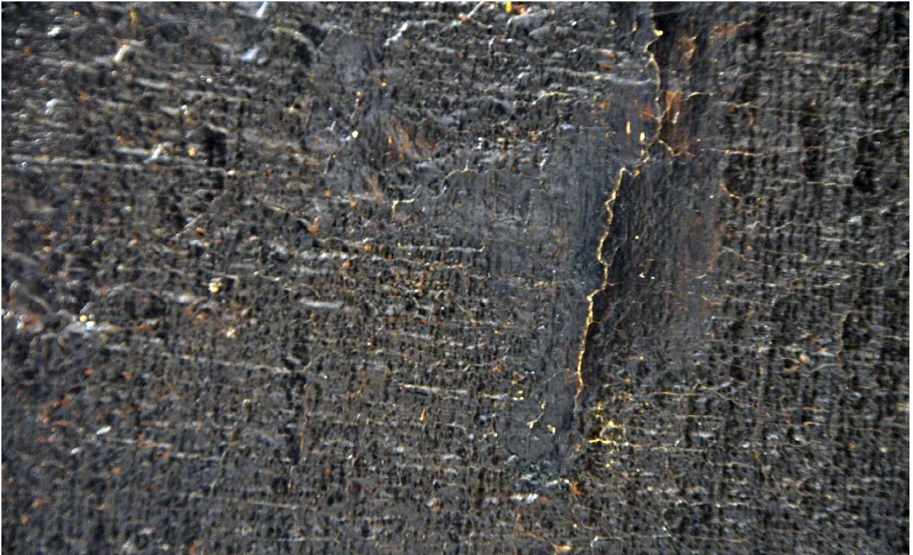
Detall de l'esquerda vertical de la part inferior dreta.