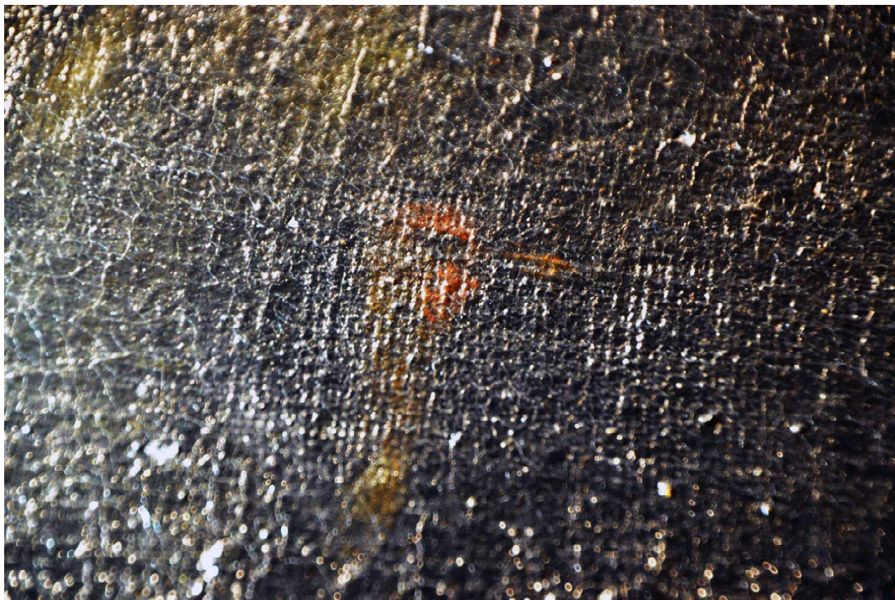
Detall de la representació de l'au trobada a partir de l'anàlisi amb llum rasant.