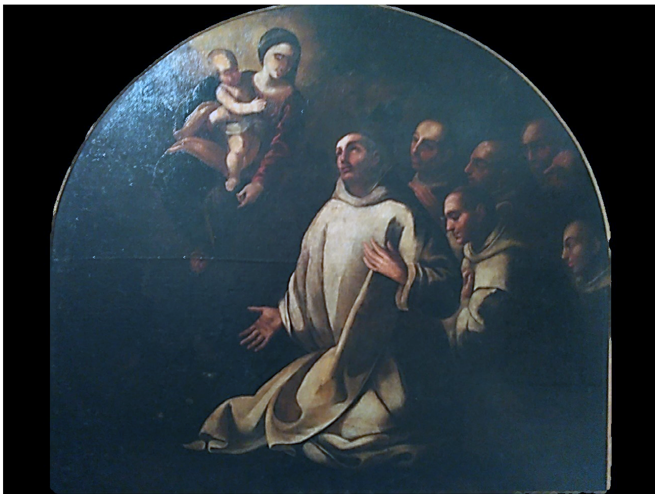
Aparició de la Mare de Déu a un sant (Museu d'Art Marès de Montblanc).