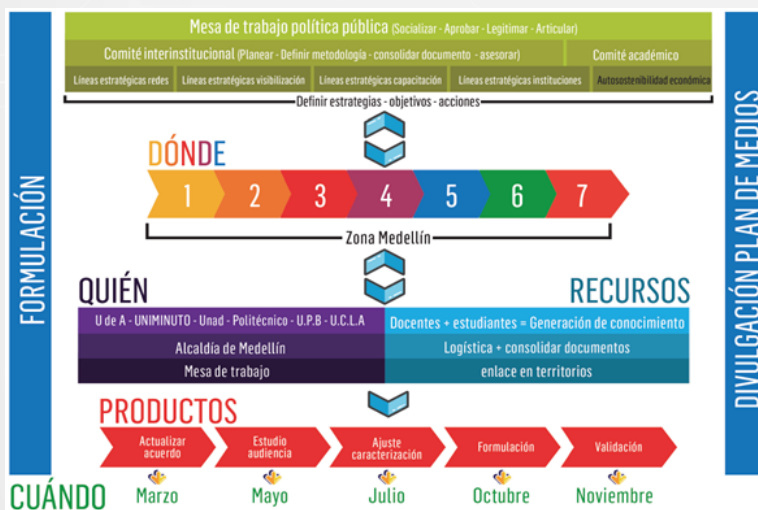
Tomado de informe Mesa Articuladora 2016