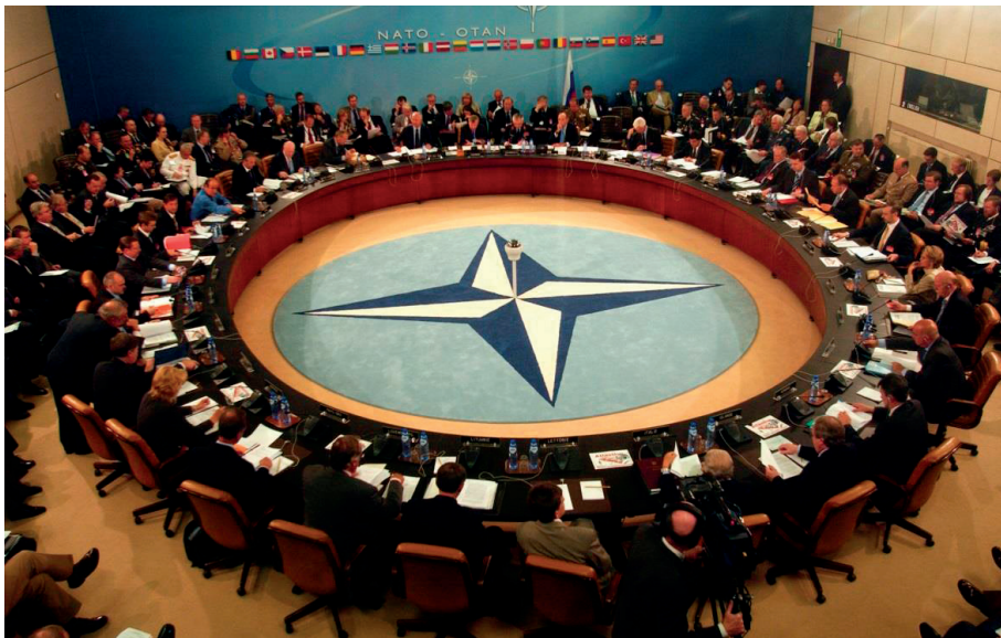
Reunión de miembros de la OTAN, disponible en < http://elordenmundial.com/relaciones-internacionales/la-otan/ > 15

Nacida en 1949, España pertenece a la misma desde el año 1982, en la que ingresó como miembro número dieciséis, su objetivo es la defensa colectiva de los países miembros dentro de su ámbito de actuación, concretamente Europa y América del Norte 14 con lo que, curiosamente, caso de que fueran atacados los territorios españoles de Ceuta y Melilla quedarían fuera de la cobertura del Tratado.