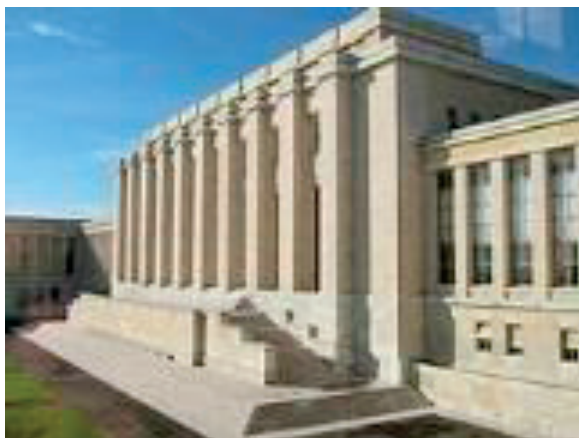
Edificio de la Sociedad de Naciones, disponible en https://es.wikipedia.org/wiki/Palacio_de_las_Naciones