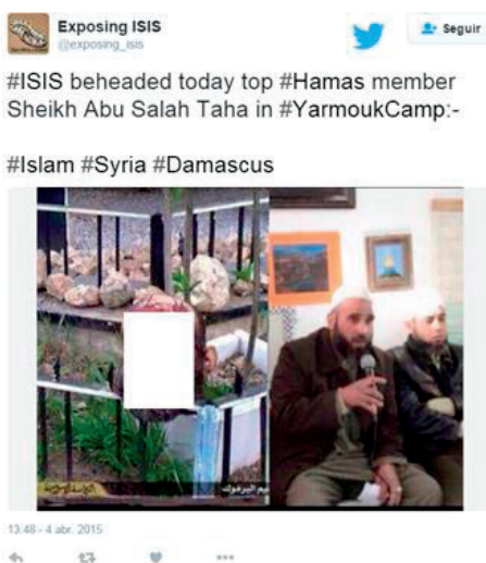
Ilustración 13: Imágenes de la decapitación de un líder de Hamas en Yarmuk circulan por Twitter. Fuente: < https://twitter.com/exposing_isis/status/584457507692814338 >

Por otro lado, esta vez Daesh tampoco ha perdido la ocasión de hacer uso de la expectación que generan ciertas imágenes en la red, pues ha clavado cabezas de residentes palestinos en Yarmuk (incluidos algunos miembros de Hamas) en picas por el campo de refugiados, que han sido difundidas a través de Internet 33 .