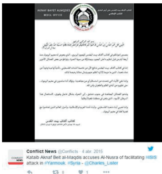
Ilustración 11: Comunicado de Aknaf Beit al Maqdis.

La lucha entre ambos grupos traspasa las fronteras de la Franja de Gaza hasta llegar a golpear a los palestinos que han huido a Siria. A raíz de la masacre en el campo de refugiados palestinos en Yarmuk 31 , el jefe de Aknaf Beit al Maqdis, pequeña milicia afiliada a Hamas, acusó en Twitter a Al-Nusra de ser cómplice de Daesh.