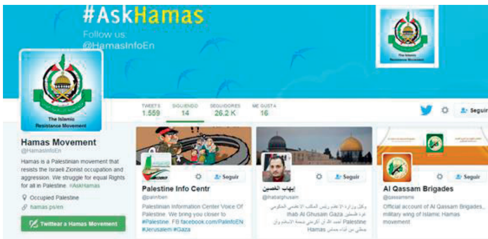
Ilustración 5: Twitter de Hamas

Hamas, «Movimiento de Resistencia Islámico», es una organización militar y política sunita que controla la Franja de Gaza. Fundada en 1987 durante la primera intifada como escisión de los Hermanos Musulmanes de Egipto, es considerada organización terrorista por Estados Unidos y la Unión Europea. El brazo militar de Hamas está compuesto por las Brigadas de Ezzeldin Al Qassam, cuyo objetivo es derrotar a Israel mediante tácticas asimétricas como el lanzamiento indiscriminado de misiles, secuestros y atentados suicidas.