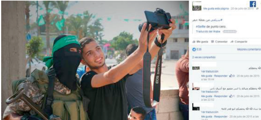
Ilustración 6: un joven se fotografía con un militante de Hamas.

(principalmente mezquitas) en los que rellenan un documento con sus datos personales. Mientras tanto, algunos se hacen selfies con los militantes de Hamas que luego suben a las redes sociales 19 .