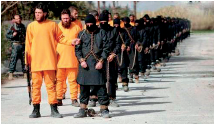
Ilustración 4: Puesta en escena de la ejecución de los prisioneros de Daesh

A finales de junio de 2015, el grupo rebelde sirio Jaish al-Islam, vestido de naranja (color con el que Daesh viste a sus prisioneros para asesinarles delante de la cámara), publicó en Internet un vídeo en el que aparecían combatientes de Daesh encadenados y vestidos de negro, a los que más tarde ejecutarían. 11