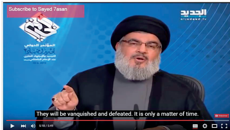
Ilustración 15: Discurso de Hassan Nasrallah.

ocasiones, ha anunciado que algunas cuentas de Twitter supuestamente asociadas a la organización eran falsas 41 .