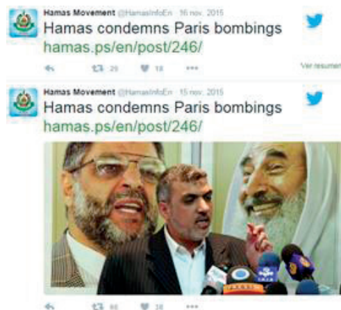
Ilustración 14: Hamas condena el atentado de París.

Si bien la comunidad internacional, así como las dos autoridades de los territorios palestinos (Al Fatah y Hamas), han condenado estos actos, nadie ha podido proteger a la población de Yarmuk de la guerra siria ni de Daesh.