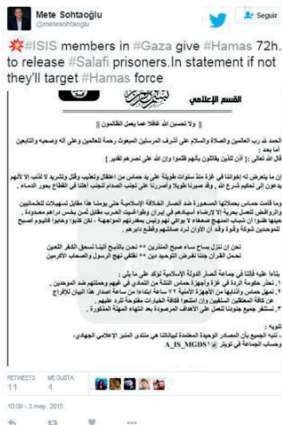
Ilustración 10: Comunicado de Daesh contra Hamas.