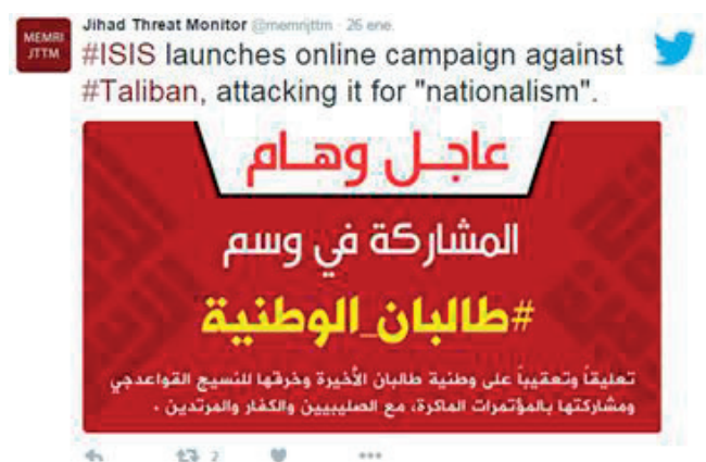
Ilustración 1: Daesh lanza una campaña virtual contra los Talibanes acusándoles de nacionalistas

Desde el estallido de la Primavera Árabe, el uso de las redes sociales virtuales ha aumentado de forma exponencial en Oriente Medio. Esta situación ha sido aprovechada por numerosos actores no estatales que, conscientes de la oportunidad de hacerse oír ante millones de personas de forma rápida y sencilla, se han lanzado a conquistar estas plataformas. Más concretamente, muchos grupos terroristas e insurgentes ya no utilizan Internet simplemente para buscar medios de financiación, reclutar nuevos militantes, hacer propaganda de sus actos e incluso realizar ciberataques 1 . Aunque el empleo de Internet por parte de grupos terroristas no es algo nuevo, la gran diferencia es que ya no solo utilizan el anonimato en la red, sino que también buscan tener la mayor presencia pública posible 2 . En la actualidad, las redes sociales virtuales han ampliado su papel como vectores de comunicación hasta el punto de que los propios terroristas las usan para amenazarse abiertamente unos a otros o para reclamar la autoría de un atentado.