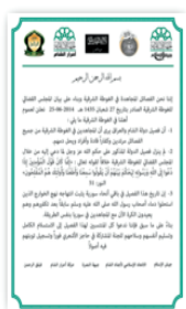
■ A joint statement from the militant factions - Publish date : 2015-06-30

Miles de ciudadanos musulmanes recurren a las redes sociales virtuales para apoyar la ideología de los grupos terroristas e insurgentes con los que se identifican, como se observa en Twitter, Facebook, Youtube, Instagram o Telegram, entre otras. De estas, las plataformas más populares entre los terroristas son Twitter y, más recientemente, Telegram 3 , desde donde dirigen a los usuarios hacia contenidos ubicados en otras redes sociales 4 . Aunque las grandes compañías han suspendido numerosas cuentas vinculadas a organizaciones terroristas, esta medida ha resultado ser ineficaz, pues rápidamente vuelven a surgir perfiles –capaces de alcanzar miles de seguidores en menos de 24 horas– que sustituyen a los eliminados 5 . A través de frases y hashtags , los usuarios de las redes sociales respaldan las acciones de Daesh, Al Qaeda, Hamas o Hizbulá, opinan sobre distintos sucesos y publican las últimas novedades de los conflictos a través de comentarios e imágenes, manteniendo una presencia virtual constante 6 .