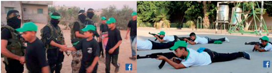
Ilustraciones 7 y 8: Campamento de verano de Hamas (2015).