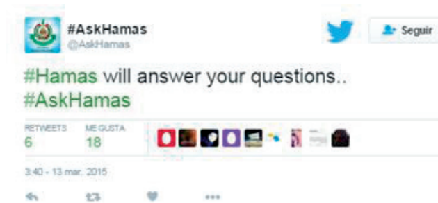
Ilustración 3: Perfil en Twitter de la campaña #AskHamas