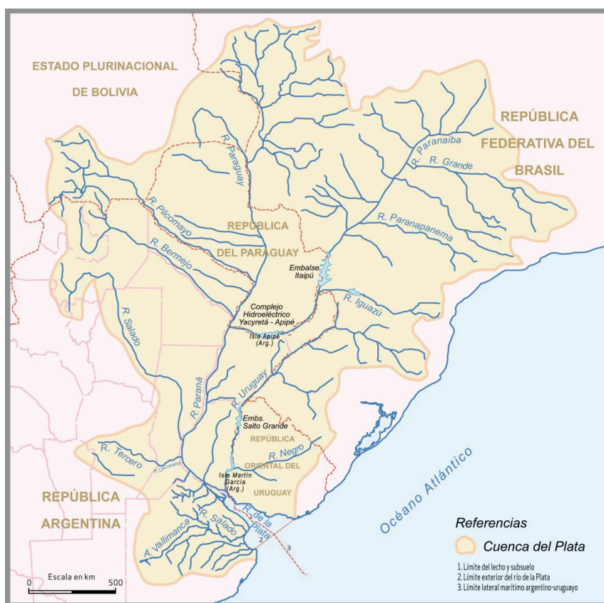
Cuenca del Plata e hidrovía Paraná-Paraguay

Sobre la cuenca del Plata, se estructura la denominada hidrovía Paraná-Paraguay, la cual involucra a algunas provincias del Plan Belgrano (Corrientes, Misiones, Chaco y Formosa). La hidrovía, además de constituir un espacio muy importante para el comercio regional interno y sudamericano, representa igualmente un área sensible para la seguridad y la defensa; por ejemplo, el doctor Horacio Jaunarena (ex ministro de Defensa de Argentina en tres oportunidades) ha advertido acerca de la transformación del río Paraná en una verdadera avenida por donde el narcotráfico transporta sus cargamentos de droga 24 .