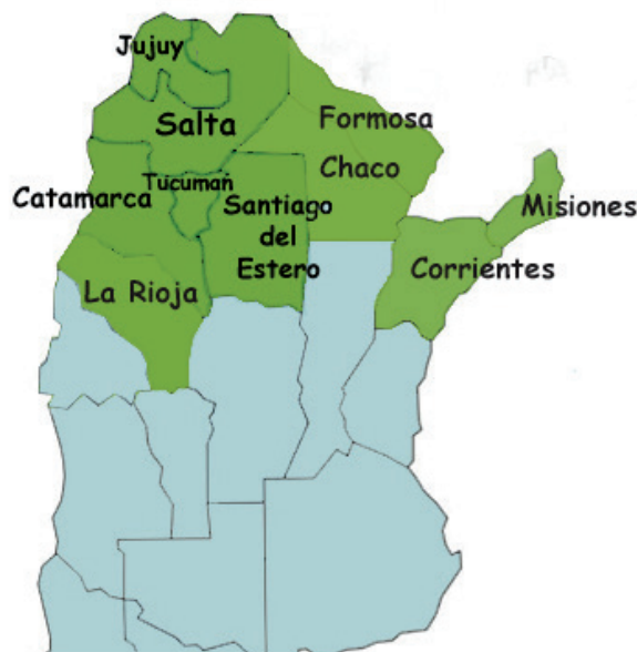
Provincias incluidas en el Plan Belgrano

http://www.argentravel.es/viajes-a-argentina-el-norte/mapa-norte-argentino/