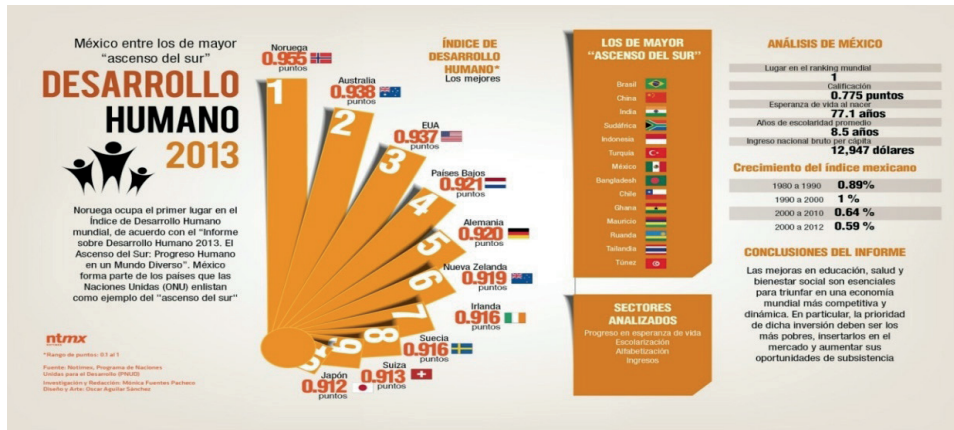
Gráfico 1. PNUD 2013.

Sin embargo, en la realidad del continente americano conviven serios problemas en el desarrollo y cumplimiento de los más básicos derechos humanos como el derecho a la vida, a la libertad, al desarrollo sostenible, a la justicia, protección de la infancia, de la mujer, educación..., entre otros. Generando la consiguiente contradicción entre crecimiento y progreso económico frente a la inseguridad de sus sociedades, los beneficios económicos no se materializan en productos y servicios que generen estabilidad y seguridad a las comunidades y las políticas públicas aplicadas no aprovechan esta generación extraordinaria de riqueza con las consiguientes situaciones de desesperanza, desilusión y violencia. En el ejemplo de México, encontramos esta triste realidad; desde mediados de 2007 hasta nuestros días se ha convertido en el tercer país del mundo en el que el número de fallecimientos provocados por la violencia criminal desborda con mucho las expectativas y realidades de otros países que están en conflicto, el caso de Afganistán, y situándose por detrás de conflictos como Libia y Siria. Desde 2003 el crimen organizado ha crecido un 73% frente al crimen cotidiano o violento que solo ha aumentado un 7%. A todo ello hay que sumar los terribles datos de destrucción de vidas humanas, los ratios de homicidios han vuelto a aumentar entre 2006 a 2012: se han producido 125.000 homicidios con un ratio