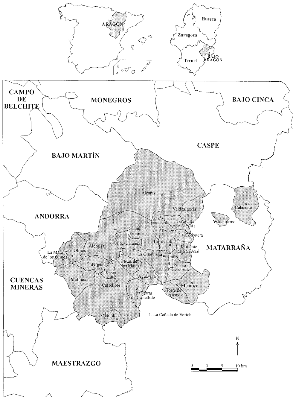
Figura 1. Área de estudio