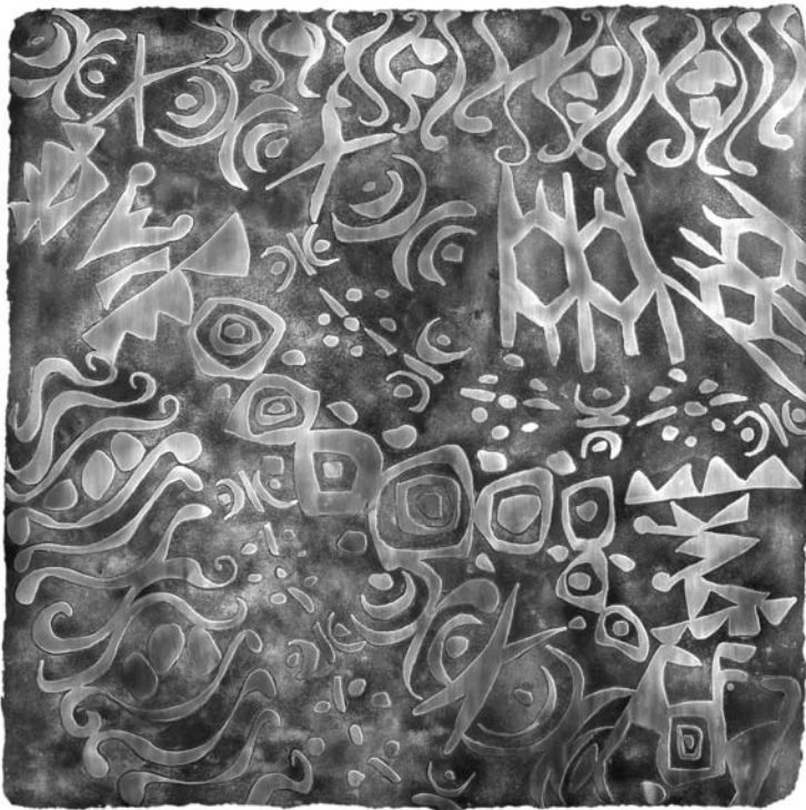
En busca del sentido de la vida. Detalle

Recurriendo a este fantasma cualitativo, las ciencias empíricas pretenden reafirmar que lo “cualitativo no es más que pobreza en lo cuantitativo”. Es decir, para demostrar la tesis de que no se requiere conceptos cualitativos, introducen un concepto cualitativo. La misma comprobación es una contradicción. Demuestra lo contrario de lo que se quiere probar, esto indica que no hay ciencia cuantitativa posible sin conceptos cualitativos previos. La conclusión sólo puede ser que al no disponer de ningún sujeto omnisciente, y al no haber ninguna estructura que actúe como si fuera omnisciente, tenemos que introducir conceptos cualitativos. Existe un límite de factibilidad humana que hace cualitativamente imposible la reducción