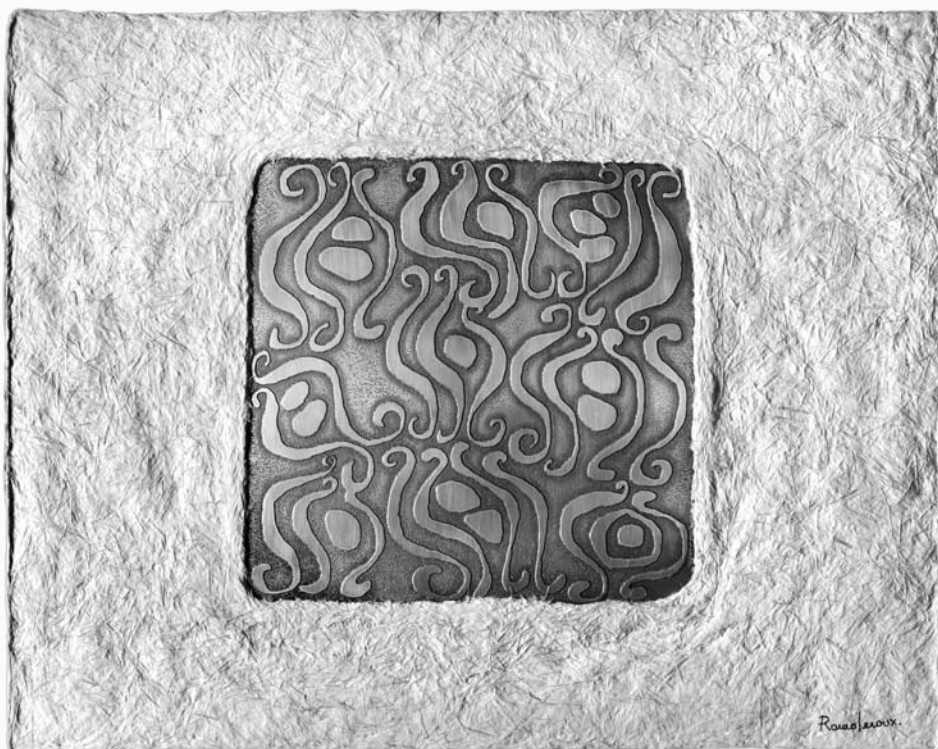
Que respire el aire