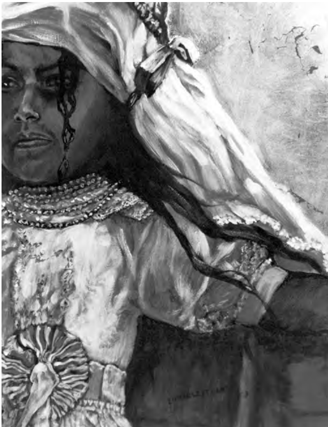
Niña ángel 1. Lámina de oro y acrílico sobre tela. 2003

Por lo anteriormente explicado, es relevante realizar múltiples preguntas, mantener el diálogo, provocar que los estudiantes se pregunten entre ellos y realicen cuestionamientos al docente. Puede ayudar mucho la realización de diagramas, gráficos, organizadores gráficos; pero en todos los casos no se trata de que sean realizados por el docente sino que en la graficación el estudiante evidencie la estructura que está construyendo, estructurando, modificando. Así el do-