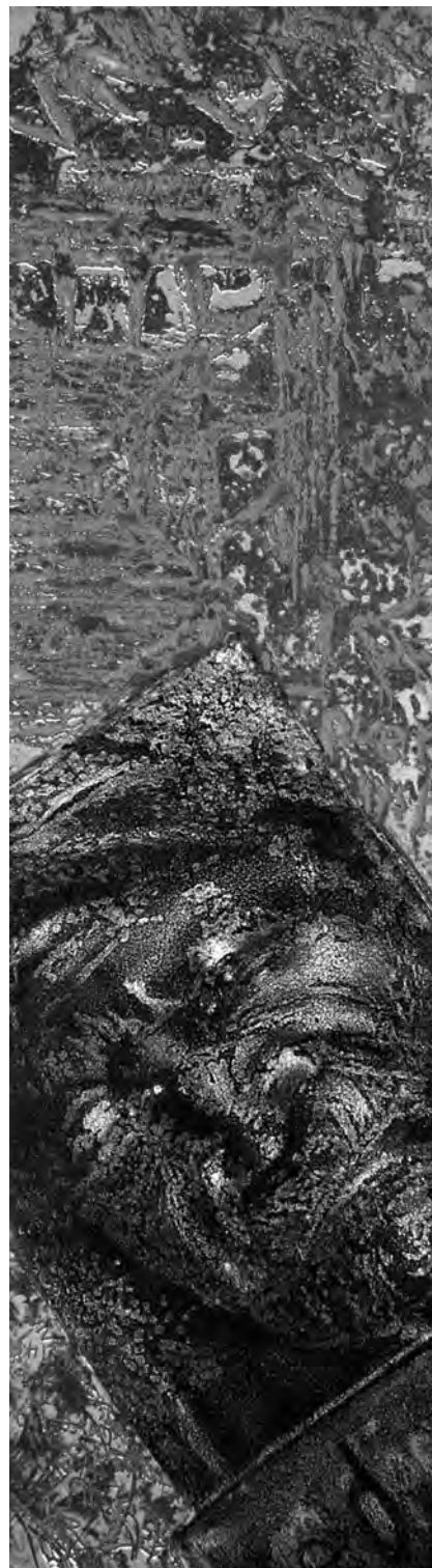
Esquina anónima. Roll up. 1996