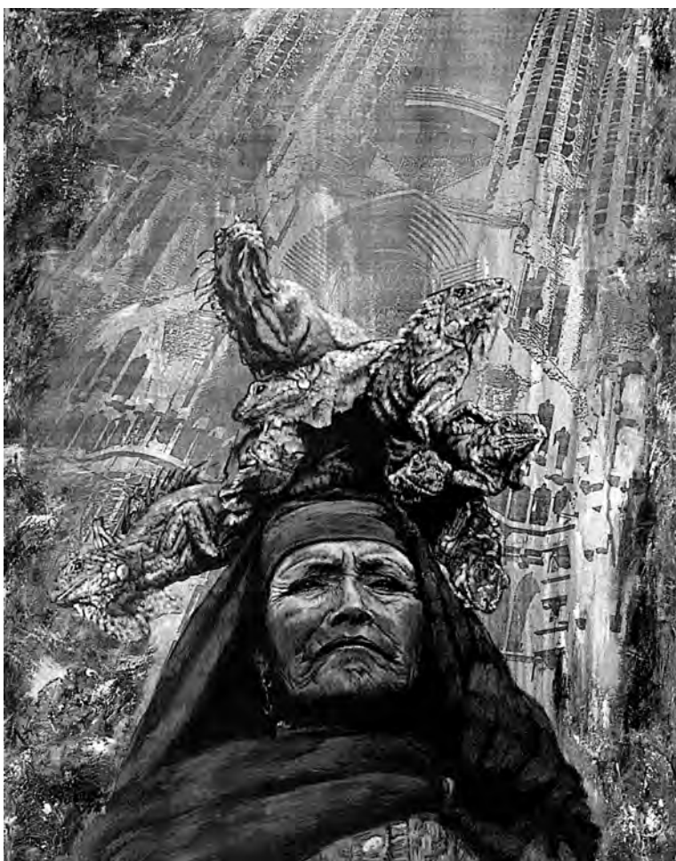
Chica cosmo. Óleo sobre tela. 2002

Caridad Herrera Padrón Rafael Fraga Rodríguez*