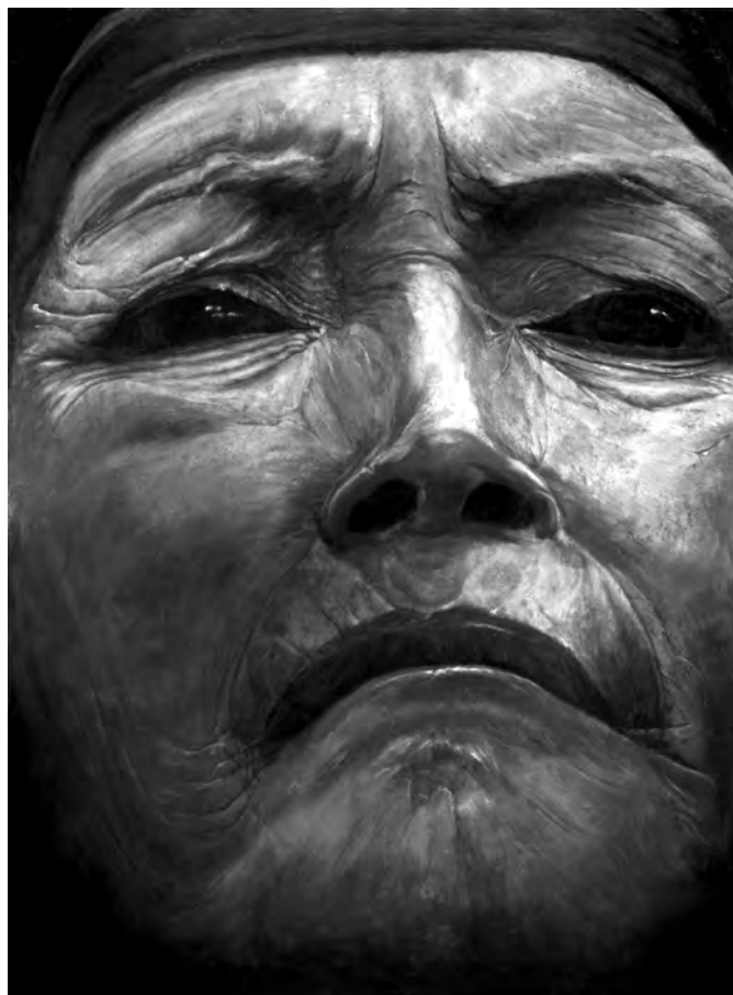
Quilago (32 módulos). Acrílico sobre tela. 2004