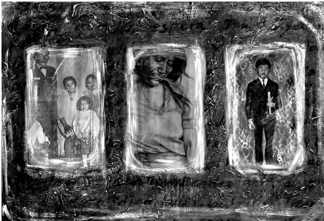
Memoria en. Acrílico sobre tela. 1998