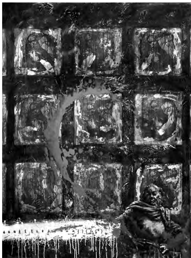
Afirmaciones y negaciones. Acrílico sobre tela. 1996

aprendizaje. Cinco grandes teorías convergen suministrando un cuadro coherente de las consecuencias de la motivación en el aprender, que son las siguientes: 1. Competencia; 2. Autodeterminación; 3. Concepto y percepción de sí mismo; 4. Motivación a conseguir éxito; 5. Atribución (Boscolo, 1997, Marzano, 2003). A éstas Stipek (2003) ha añadido la teoría más moderna de la orientación sociocultural que pone de manifiesto el hecho de que un contexto social adecuado –compañeros, docentes, escuela y padres– apoya el sistema motivador, ayudando en particular a persistir enfrentándose con dificultades, y asimismo el que es necesario que cada discente se enfrente efectivamente con un nivel correcto de dificultades, con unos desafíos aptos para envolverlo.