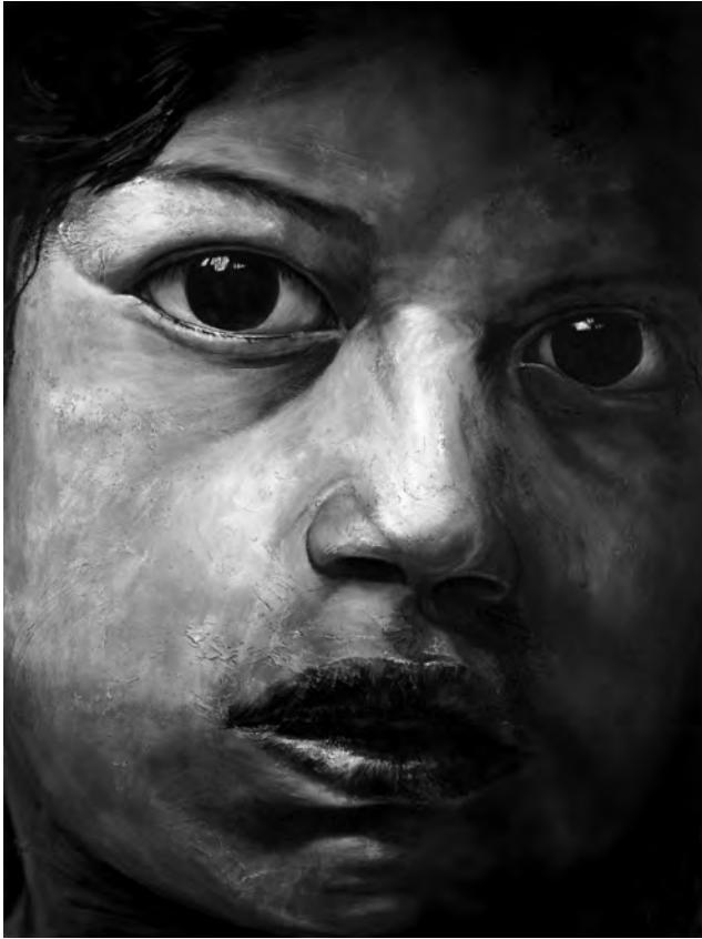
Quilago (32 módulos). Acrílico sobre tela. 2004

cimientos reales; 2. Entender los hechos y las ideas que caracterizan “el pensamiento y la acción” del contexto de qué se trata (disciplinario, profesional, social, etcétera); y, 3. Organizar sus conocimientos de tal manera que pueda facilitar su recuperación y aplicación. Esto supone profundizar la enseñanza de algunos asuntos, suministrando ejemplos de la forma de aplicar el concepto en la realidad.