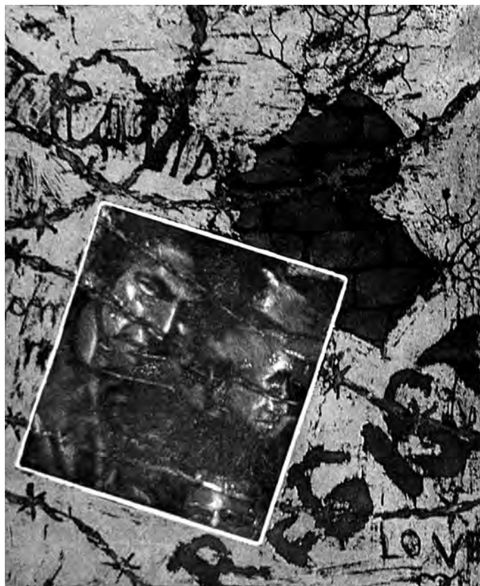
El triunfo de la libertad es el nombre de una calle I. Detalle. Roll up. 1996

En esta línea Dunn y Dunn señala que los estilos de aprendizaje son las modalidades preferidas por un discente respecto a la mejor manera de conseguir concentración y el aprender información difícil. La importancia está en las interacciones: a. Con el ambiente: algunas bipolaridades son, por ejemplo, silencio-sonido, luz baja-luz fuerte; b. Con los demás: aprendizaje individual-colaborativo, presencia de autoridad-ausencia de autoridad, repetición-creatividad; c. Con el cuer-