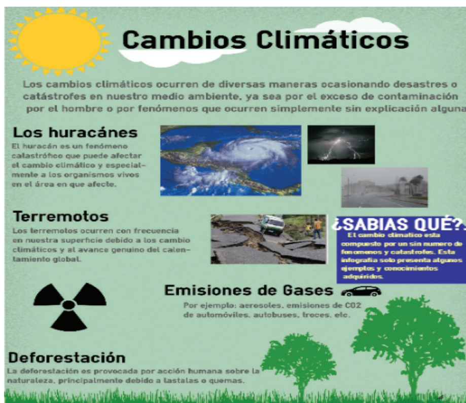
Figura 1. Ejemplo de una de las infografías con conceptos erróneos de cambio climático (Evaluación diagnóstica)

Elaboración de estudiante en el curso de Biología.