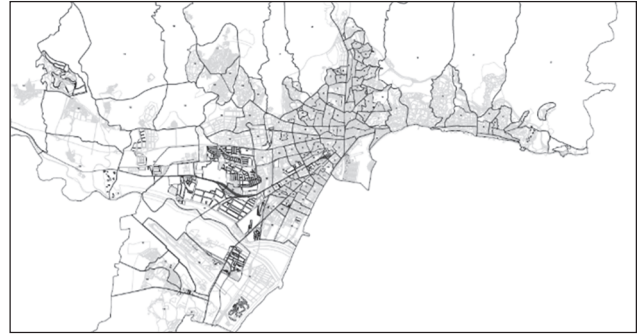
Figura. 2 Zonificación Área de Málaga. Fuente: Encuesta de movilidad en día laborable en el Área de Málaga en noviembre 2000 y febrero 2001.