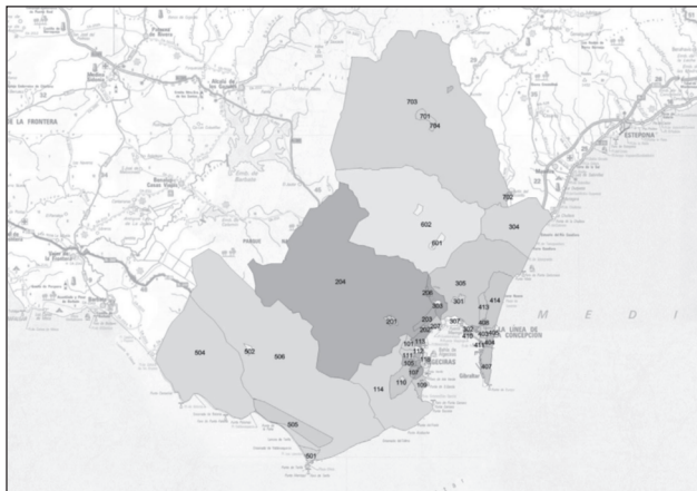
Figura. 1 Zonificación Campo de Gibraltar.

Siguiendo los criterios anteriores se realiza la zonificación del Campo de Gibraltar (Fig. 1) y Málaga (Fig. 2).