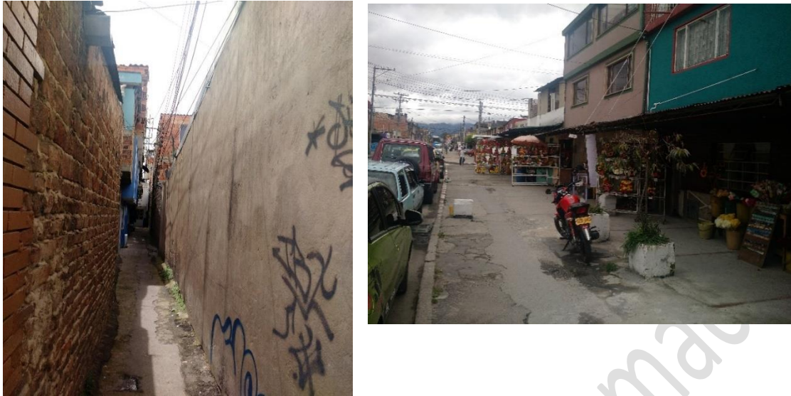
Figura 2. Morfologías barriales propicias a la ocurrencia de delitos, ubicado en la calle 23d entre carreras 106 y 107