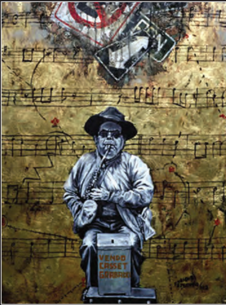
City tour. Óleo sobre tela. 2002