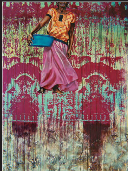
La ascensión. Acrílico sobre tela. 1996