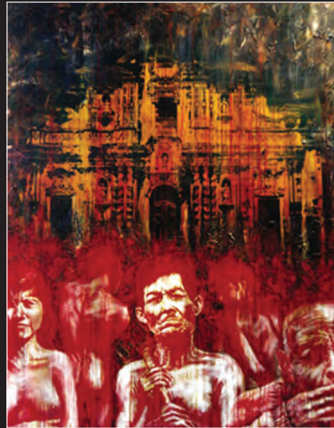
A sangre y fuego. Estampación y acrílico sobre tela. 2000 Segundo premio. Salón de julio, 2000. Guayaquil