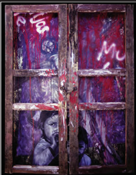
Puerta al cielo. Ensamble (madera y acrílico sobre tela). 1999