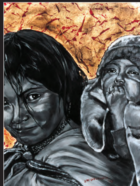
Niña con bebé. Lámina de oro y acrílico sobre tela. 2003