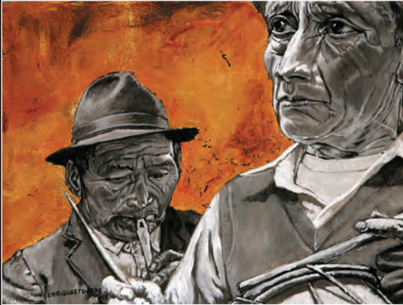
Banda mocha. Lámina de oro y acrílico sobre tela. 2003