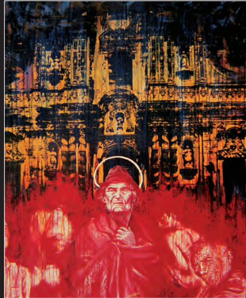
Bienaventuranzas. Acrílico sobre tela. 1998 Primer premio. Arte sacro Hispanoamericano, Nueva York