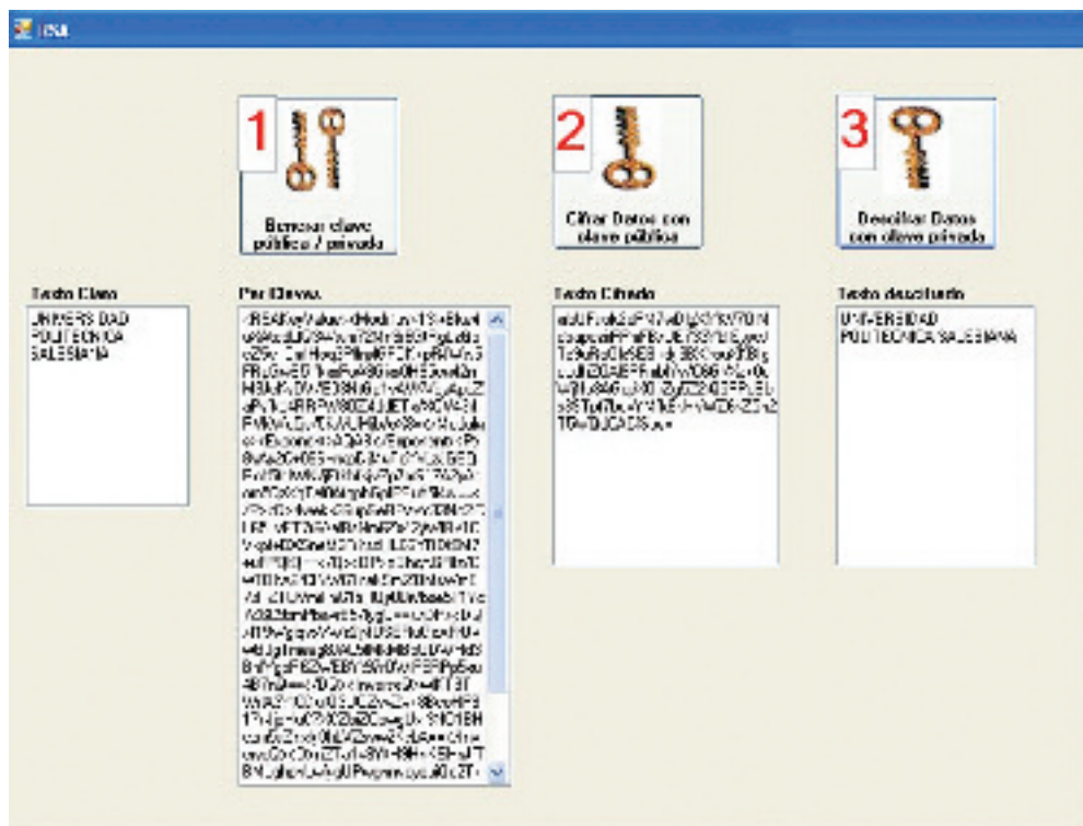
Figura A2. Cifrado Asimétrico