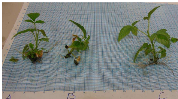
Figura 2. Plantas enraizadas in vitro . A 9,75 mM (T1). B 7,48 mM (T2). B 4,88 mM (T3).

cultivando en medio MS formulado a la mitad de la concentración de macro, microsales y vitaminas; mientras que los cultivos en medio MS completo y diluido 1/4 de la concentración, obtuvieron promedios de longitud de raíz bajos, con valores de 1,91 y 0,67 respectivamente.