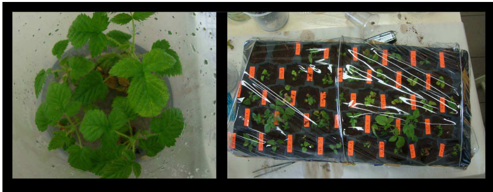
Figura 1. Cultivo in vitro y adaptación a sustrato de Rubus glaucus .

Los tratamientos para la fase de adaptación a sustrato se dispusieron bajo un diseño completamente al azar en arreglo factorial 3 × 3, con tres repeticiones; es decir una bandeja por cada una de ellas.