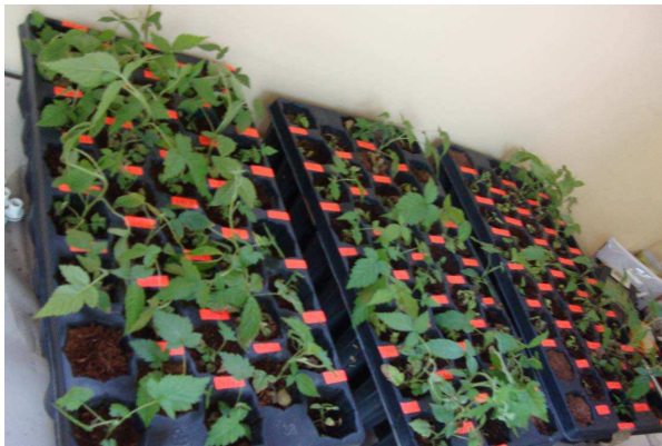
Figura 3. Plantas de mora adaptadas a sustrato.

de explantes de rosa in vitro provenientes de medios de cultivo con sales diluidas.