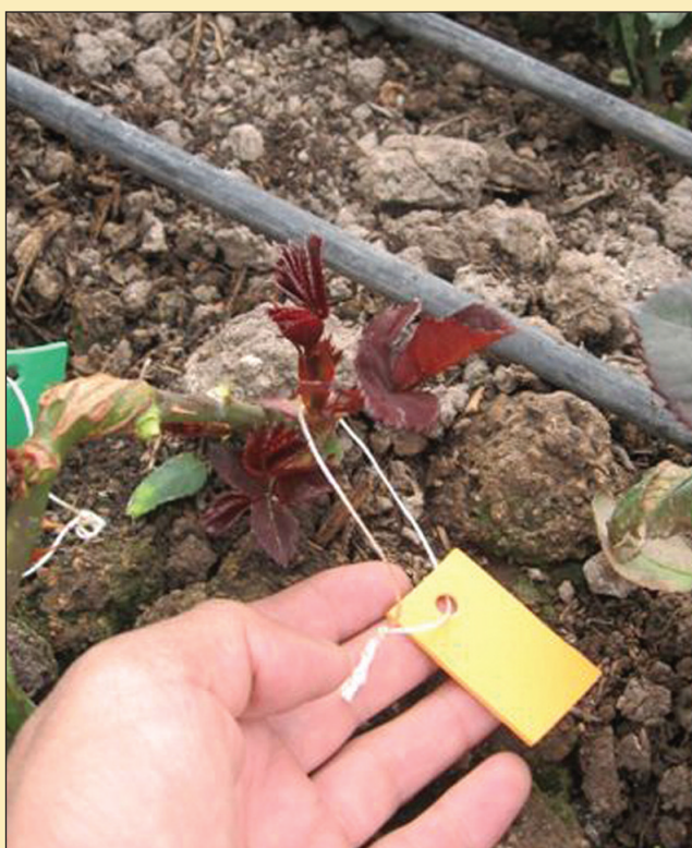
Figura 9. Basales brotados. Fuente: Hugo Vinueza Mejía.

ple con la labor de eliminar la dominancia apical en los tallos de la plántula de rosa, con lo cual se induce a la brotación de las yemas bajas (Ver Figura 9), que en este caso son las que dan origen a los brotes basales.