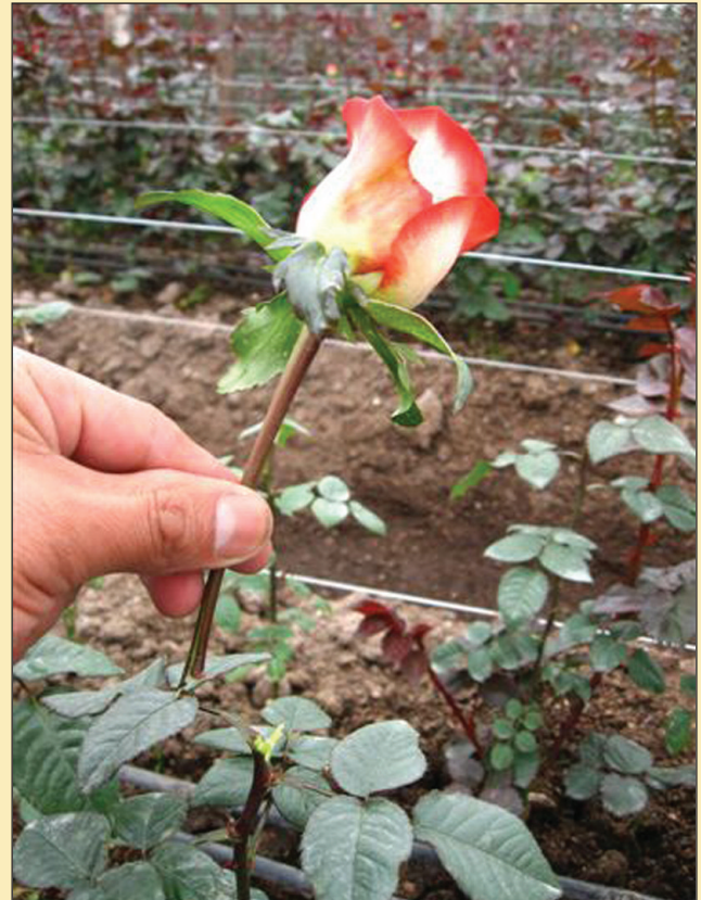
Figura 8. Descabece del botón en punto ruso.

Una vez establecidas la plántulas en el sitio definitivo (unidad experimental), se procedió al desbrote de yemas axilares cada 7 días (tiempo establecido en la finca para esta labor), hasta que las plántulas