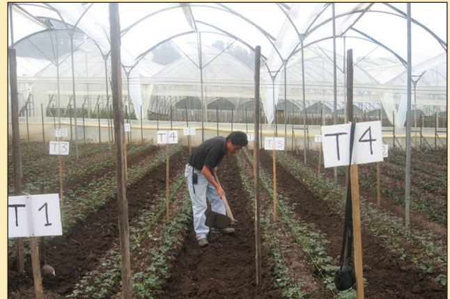
Figura 2. Manejo del experimento.

Posteriormente, se realizó el respectivo análisis económico de los tratamientos.