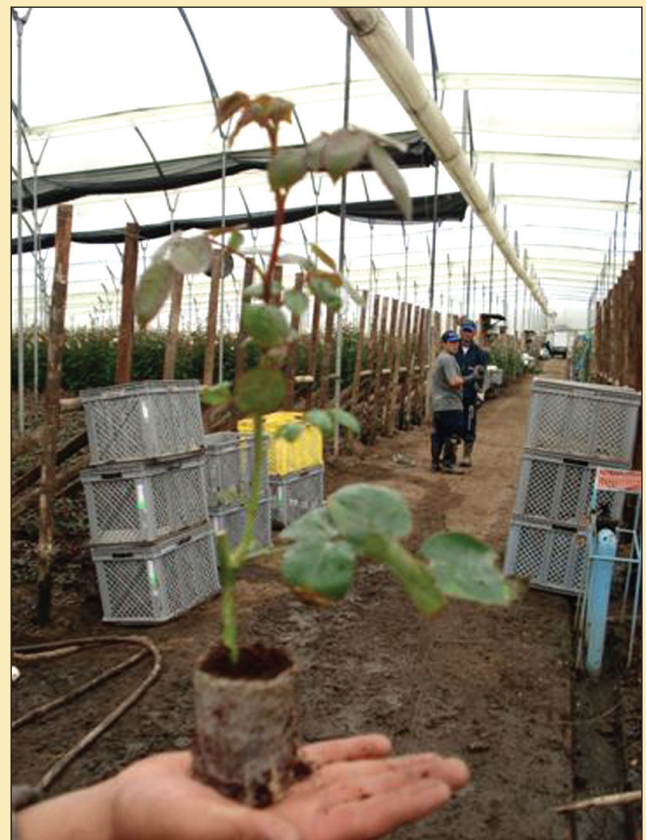
Figura 3. Plántulas de la variedad Blush de los Andes ( Rosa spp. ).