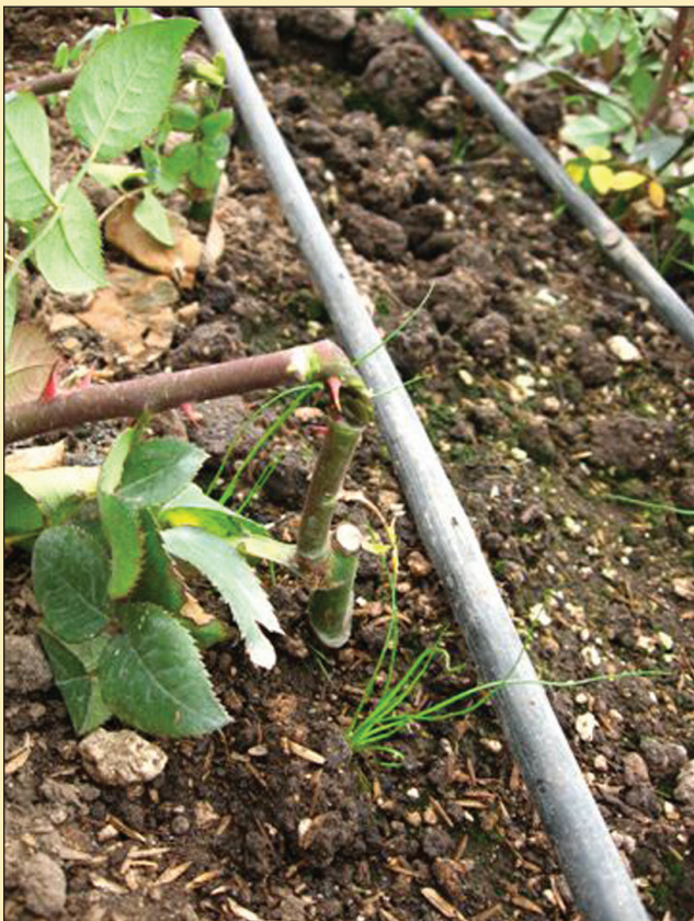
Figura 4. Agobio de plántulas con semiquiebre.

Una vez que las plántulas se encontraron estableci-