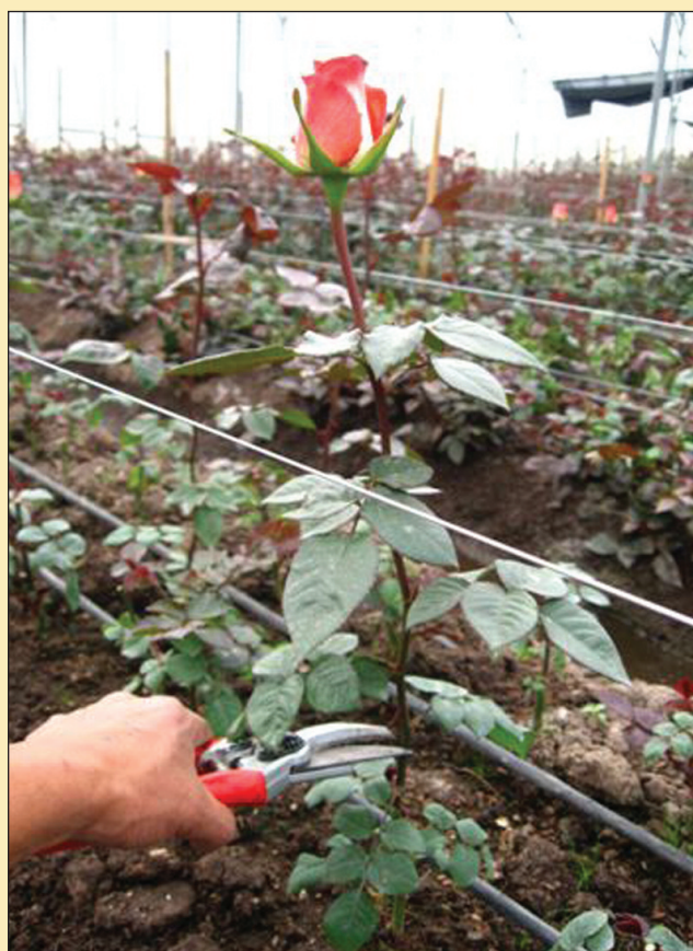
Figura 6. Cosecha de la primera flor en punto ruso.