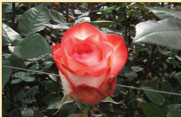
Figura 11. Punto de corte ruso.