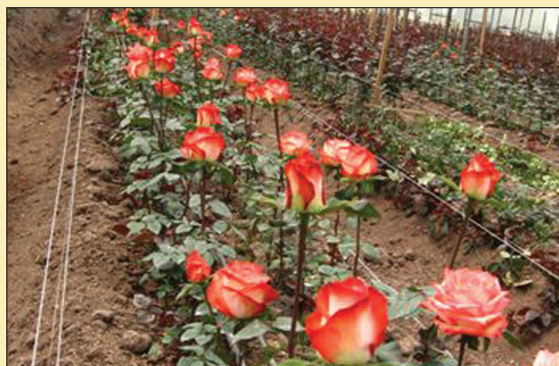
Figura 12. Tratamiento con punto de corte ruso.

plántula por arqueo, previo descabece del primer botón floral en punto garbanzo) con un promedio de 129,88 días. La Figura 10 muestra la cosecha de los basales en punto de corte ruso.