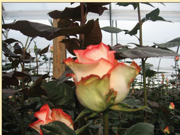
Figura 1. Variedad 'Blush de los Andes'.

Es sumamente importante asegurar el número de yemas basales, su número depende de la edad y la posición de la yema y, generalmente, sólo las dos yemas inferiores entre las yemas potenciales producen brotes basales. Si más tarde se desarrolla un tercer brote o más, provendrá de la yema axilar de uno de los dos brotes ya crecidos, diferentes factores afectan la formación y calidad de los brotes basales (López et al., 2007).