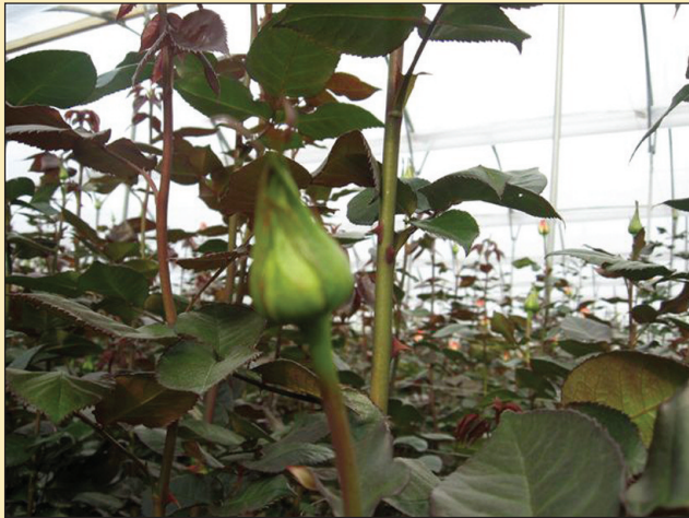
Figura 7. Punto garbanzo.

En la primera parte se procedió de la misma manera que en el tratamiento uno, es decir primero se formó las ‘escobillas’, luego de lo cual se realizó el agobio por arqueado (Ver Figura 5), realizado inclinando las plántulas hacia la parte de afuera de la camas (caminos) y utilizando líneas de piola para mantener esta inclinación.