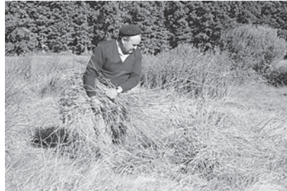
2. Recollida de xuncos