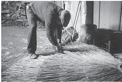
19. Igualando os xuncos