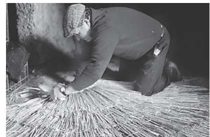
15. Colocación para penteado