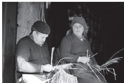
11. Trenzado con tres xuncos