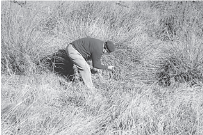
1. Corta de xuncos