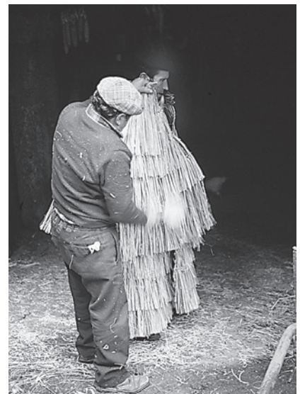
27. Últimos retoques. Peinado