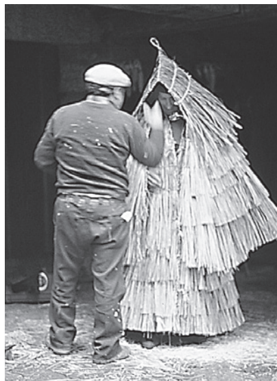
26. Coroza completa