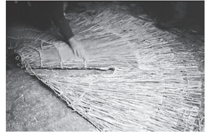
18. Abertura para os brazos