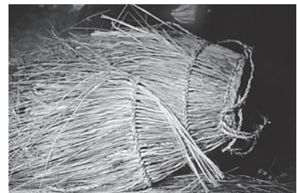
12. Detalle do proceso