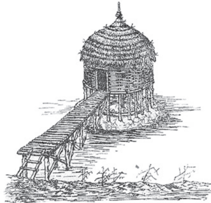
Dibuxo: F CONDE-VALVIS.

"Estas construcións tiñan forma circular e as estacas servían para soste o piso e o tellado, formado por ramas de árbores entrelazadas entre si e cubertas de xunco e palla".