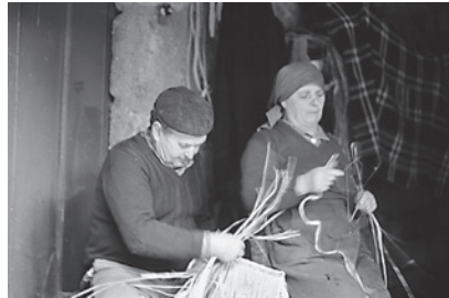
8. Comezo da corozza