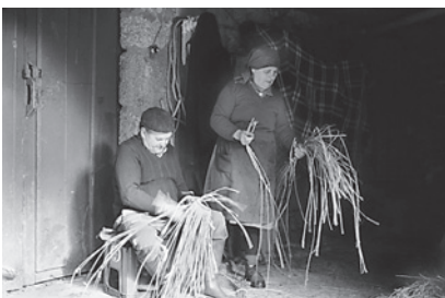
10. Tecido. Trenzado