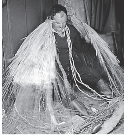
17. Tomando medidas