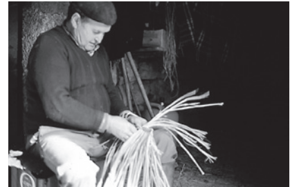
9. Tecido desde o pescozo