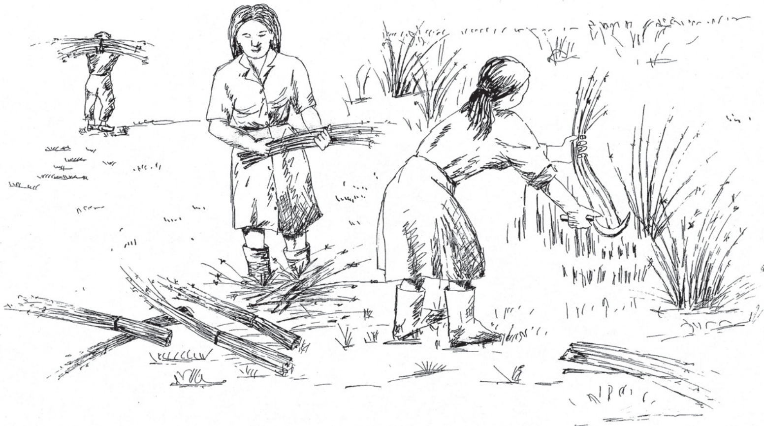
CORTANDO O XUNCO

O primeiro paso no proceso dunha corozá é a corta dos xuncos. Nela existe certa controversia sobre cal é o momento máis idóneo para cortar os xuncos. Xeralmente acéptase que a mediados ou a finais do