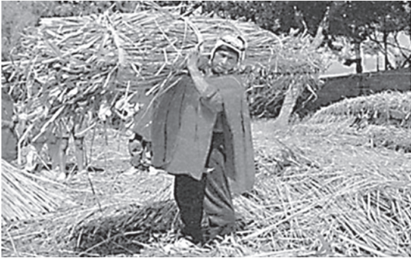
Indio aimara recollendo os xuncos para a elaboración da embarcación "Uru". Etnografía experimental. Fotografía: Fonte, Magazine El Mundo. 27-X-1990.

máis tarde serían substituídos por prendas de algodón, dando fama a este pobo, os Aimara, uns excelentes fabricantes de tecido e os únicos que no mundo conservan as antigas técnicas de trenzado de xuncos.