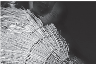
13. Detalle do entrelazado