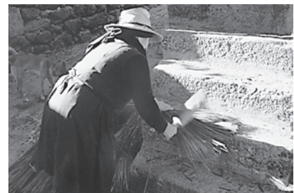
6. Malla de xuncos