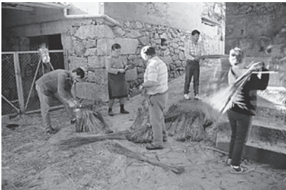
7. Malla e delubado