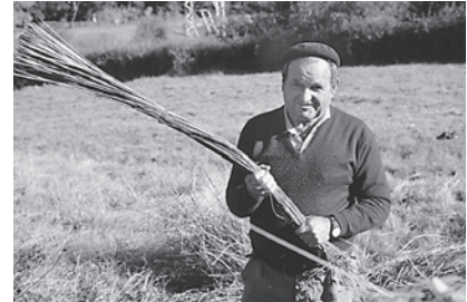
3. Xúntanse en feixes ou mazas