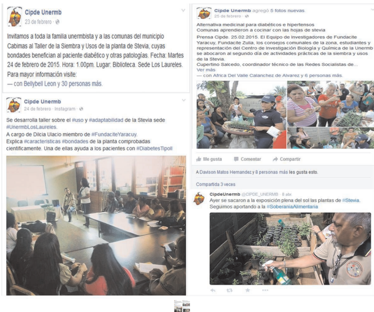
Figura 1. Publicaciones realizadas a través de las cuentas de Facebook y Twitter del CIPDE.

Posteriormente, en el mes de marzo (martes 03/03/2015) se iniciaron las reuniones semanales de los integrantes del proyecto, en el cual se unieron los miembros de FUNDACITE Zulia, quienes también se sumaron a la interacción a través de las redes sociales, dando a conocer su intervención. En estas semanas los encargados de las RRSS estuvieron publicando en las mismas los avances sobre el corte de los esquejes, proceso de riego, cómo ir dejando que lleven sol completamente, entre otros aspectos. A medida que los responsables de la adaptabilidad de planta a las condiciones ambientales del municipio Cabimas, iban dando los avances al respecto. Toda esa información se estuvo compartiendo principalmente por Facebook y Twitter, logrando captar la atención de personal universitario y voceros de unos consejos comunales que se mostraron interesados en el tema y pedían ser incluidos.