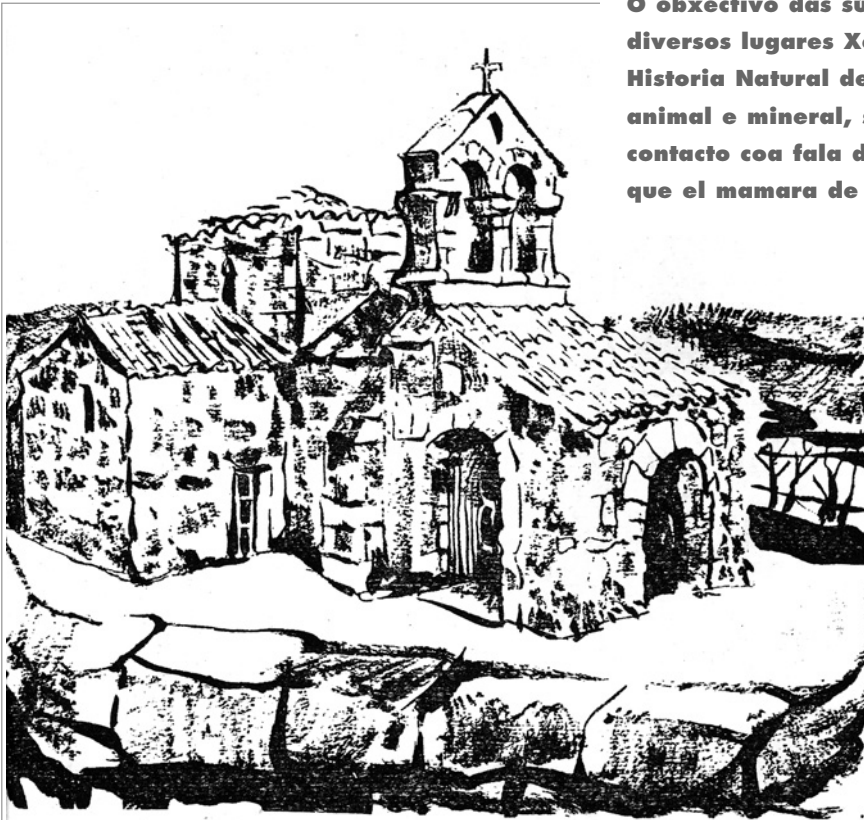
...pola tarde saíu a ver Santa Comba de San Trocado e os Baños de Bande

O obxectivo das súas viaxes non era só recoñecer os diversos lugares Xeográficos e recoller mostras de Historia Natural de Galiza nos seus tres reinos: vexetal, animal e mineral, senón tamén era o de poñerse en contacto coa fala do povo sinxelo e coa lingua galega que el mamara de pequeno.