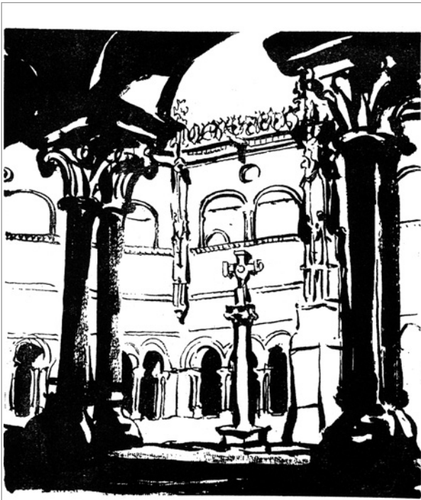
O 13 de Decembro saíu de Ourense para San Estevo de Rivas de Sil, distante da cidade tres leguas

Entre os días 22 de Outubro de 1755 e o 7 de Novembro do mesmo ano, viaxou novamente pola provincia de Ourense para realizar a súa segunda viaxe. Entrou na nosa provincia procedente de Pontevedra despois de cruzar o río Miño na barca de Sendelle. Dirixiuse a Celanova, de aquí á cidade das Burgas desde onde se encamiñou ao oriente ourensán onde rematou a súa viaxe pola nosa provincia. Percorreu a provincia de Ourense de Suroeste a Noreste en Terras de “Tribis” e Valdeorras. Desde a citada barca subiu por Condado a Trado e encamiñouse a Ponte Deva. Pasou Mañoi, povo da freguesía de Pau, e de aquí foi á Fonte Branca desde onde foi a Calvos, Ponte de Medeiro, Río Tuño, até onde hai unha legua e media. Continuou até o priorato de San Salvador de Paizás a onde chegou de noite. O Xoves 23 saíu de Paizás para Celanova que dista unha legua e media. Pasou por Casardeita, ermida de Santa Agueda, Gandarela e Castromao, para chegar ao mosteiro de San Salvador e freguesía de San Verísimo. O 27 subiu ao monte Poxares que está a mediodía de Celanova. O 29, saíu de Celanova para o priorato de Bande, pasando polo Burgo, Cañón, San Lourenzo; Gontán e a freguesía de Brea ou Vereá despois de percorrer unha legua e media chegou ao priorato de Bande. Pola tarde saíu a ver Santa Comba de San Torcuato e os Baños de Bande. Hai unha legua a Santa Comba. De Santa Comba volveu a Bande por