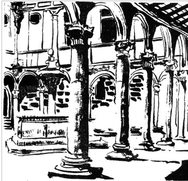
Fixo moito no mosteiro de S. Clodio.

Nas súas viaxes adicou especial atención e interese ao léxico, á toponimia, á poesía medieval, á lingua, á filoloxía e aos estudos literarios.