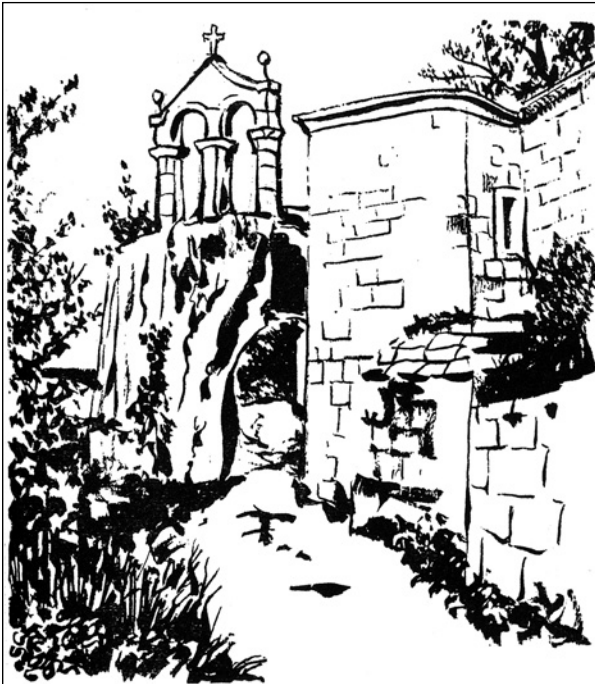
En Rocas, subíndose ao alto da igrexa vese infinito país.