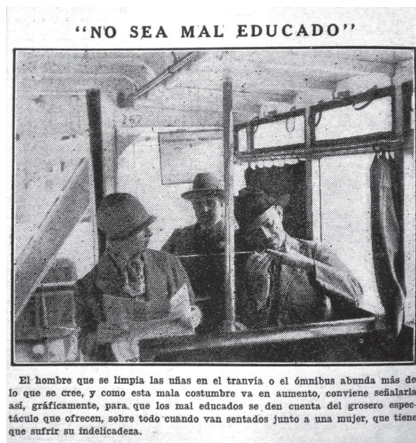
Figura 1. “El hombre de lee de ojito”

Otra fuente que resulta interesante analizar es la columna “Desde el mirador”, de EDUARDO ENCINA, publicada en Caras y Caretas a mediados de la década de 1920. Dedicada a comentarios variados sobre las interacciones en el espacio público, este tipo de columnas buscaba llamar la atención sobre conductas consideradas incorrectas frente a normas que no eran explícitas y que expresaban las ideas y valores del comentarista; no provenían de una autoridad como la compañía de transporte o la Municipalidad. Si bien no puede obviarse que quienes escribían en la prensa no estaban en igualdad de posición que el lector,