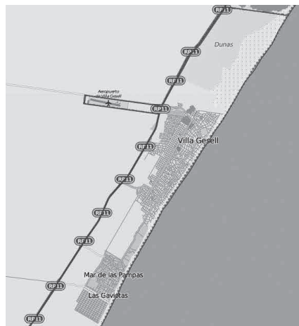
Mapa III. El partido de Villa Gesell y sus localidades

dimensión simbólica fundamental, ya que opera como frontera social, es decir, separa a dos grupos sociales en tensión: de un lado del bulevar, "los antiguos residentes": principalmente autodefinidos como de clase media, "ciudadanos de bien", portadores de apellido, dueños de la industria turística geselina y merecedores de la ciudad; y del otro lado, "los recién llegados": sectores populares, trabajadores del área de servicios, aquellos que son definidos por los "tradicionales residentes" como "intrusos" y, por tanto, no merecedores de la ciudad.