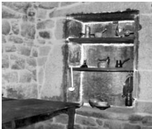
Na buraca da cociña utensilios sinxelos e prácticos.

auténticas especializacións no oficio; particularmente estimada será a dos fragueiros (dedicados á construción de carros), a dos ebanistas ou a dos especialistas en xugos de molidas, auténticas pezas artísticas cheas de filigranas.