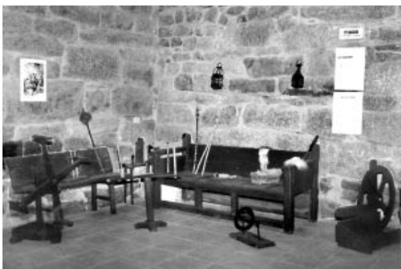
A sala de tecer onde parece soaren aínda as voces de tecedeiras pabelenciosas.

As pezas que todos eles nos deixaron forman fragmentado monumento de homenaxe á súa xenerosidade e ao seu saber.