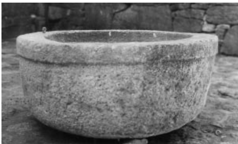
A pia da auga, fora da forxa, fiel aliada do ferreiro.

A rexa e outrora farturenta casa rectoral de Vilar de Santos, resgatada do deterioro e respetosamente arranxada polo Concello, converteu-se desde primeiros de ano en sede definitiva do Museo Etnolóxico da Límia, que abriu as súas portas o 12 de Xullo de 1992 instalado na que fora escola da localidade.