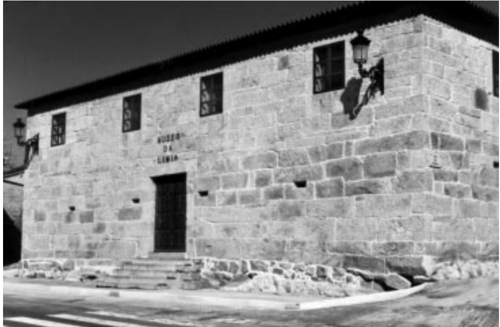
A casa do cura ou casa rectoral, salvada con vida do abandono.