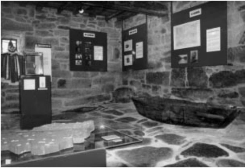
A barca da lagoa de Antela, que permitía andar por camiños de auga.

xuntaron, seguindo o profundo canal ás do Límia e foron á procura do mar.