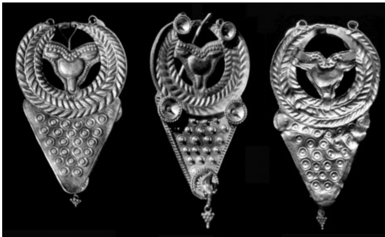
A arracada, tesouro que nos quixo traer o azar.

As cantareiras ras cuxas sabrosas ancas obtiveron sona nas feiras da provincia, as sanguessugas utilizadas en diversas prácticas medicinais, as cegoñas, as garzas, as aves frias, os patos, beóns, espadanas e outras moitas plantas desapareceron cando as últimas augas da lagoa se