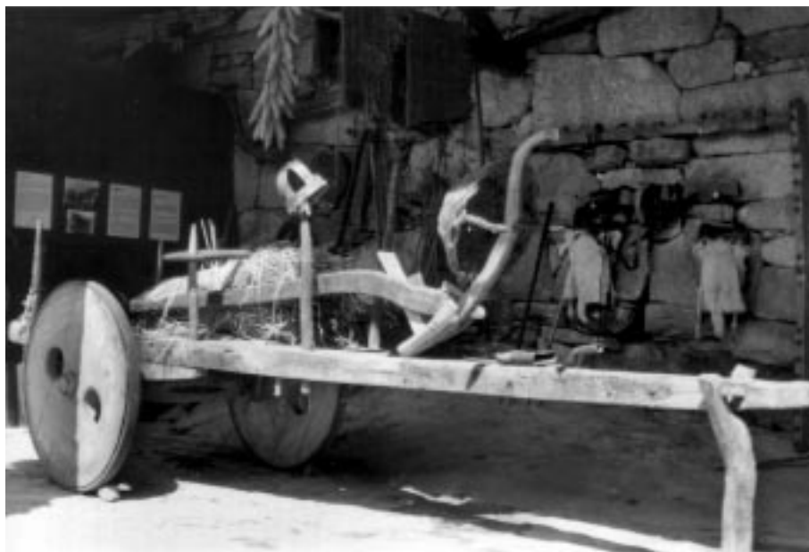
O carro, emblema da casa de labranza, orgullo do labrego.

Na casa con sobrado, o dormitorio está por riba da corte para aproveitar o calor corporal desprendido polos animais que ocupan a planta baixa. No cuarto, o mobiliário é escaso: leito, berce, mesa de noite, arca para a roupa e recipiente para o aseo.