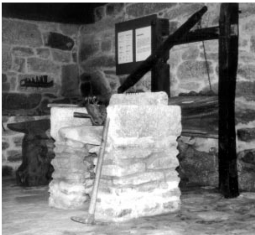
A fornalla e o grande fol, no centro da forxa.

Os canteiros deixaron abundantes mostras da súa arte estendi-