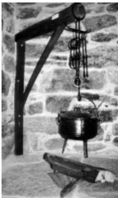
Burro e gramalleira suxeitan o pote do caldo, permanentemente sobre o lume.