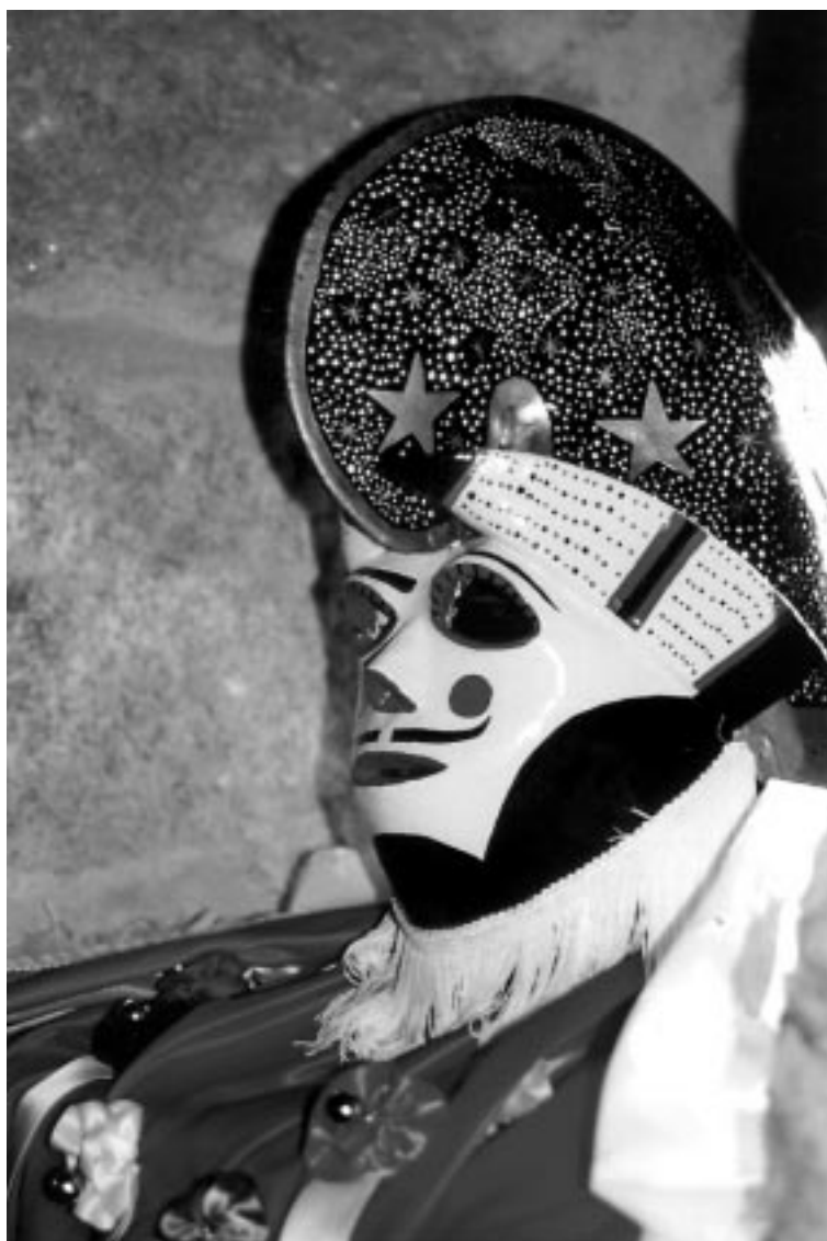
A PANTALLA, raiña do entroido limiao, misterio e colorido.

de moitos galegos, luz para o longo e liberado porvir que merece este noso país.