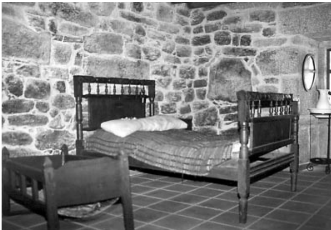
Leito e rolo abundan para o repouso no cuarto.