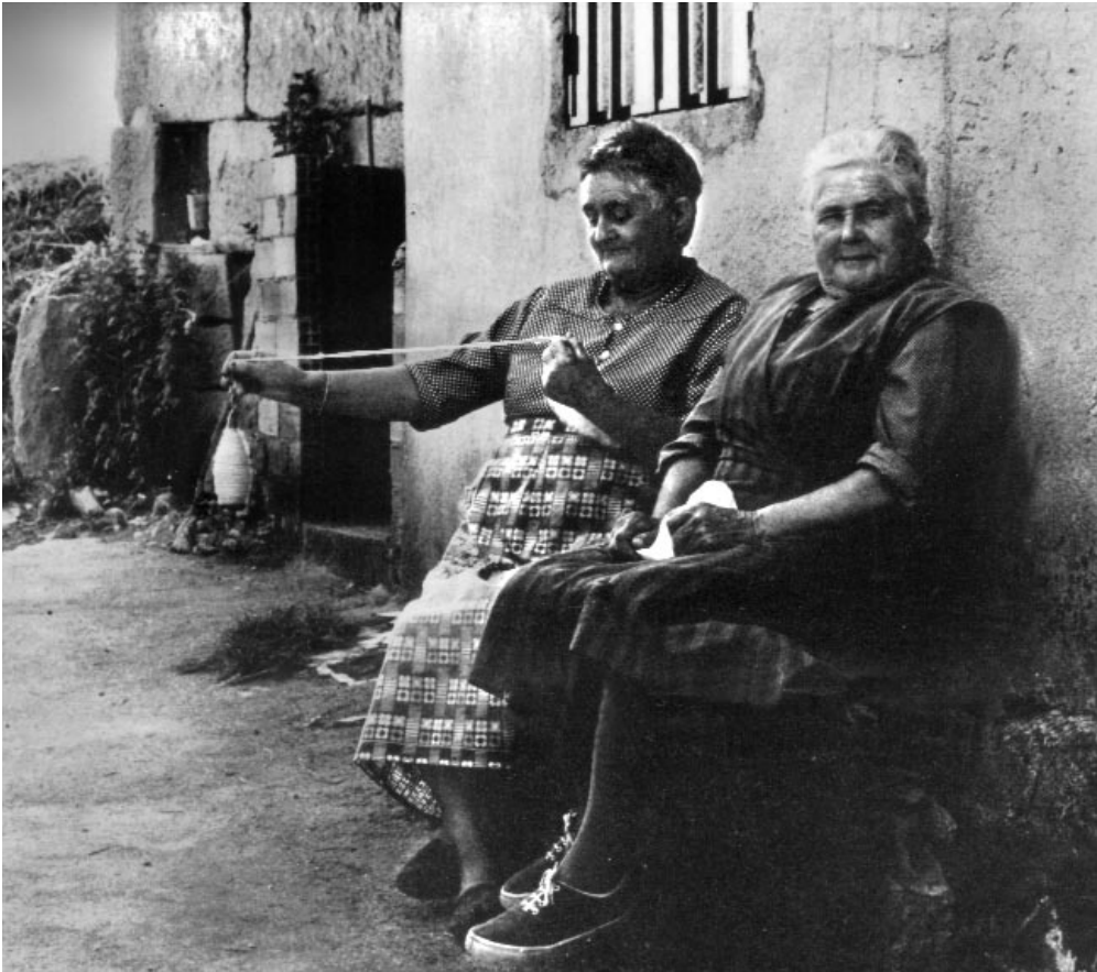
Duas veciñas do lugar sentadas no mazadoiro e fiando na la.

beiros que rondaban as fiandeiras ás que intentaban engaiolar coas coplas e cantares novidosos que cegos e acompañantes difundían por feiras e festas e que se viñan xuntar ás picadas de mofa ás que a rivalidade daba pé.