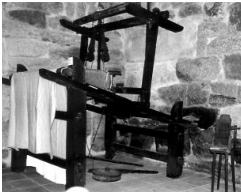
O tear, enxeño e arte en movemento.

O fiadeiro era o contraponto do tear. Nel eran frecuentes brincadeiras e desafíos; escola de vida e romaría , era visitado asiduamente por mozos rexou-