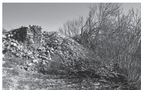
Restos de la Casilla de la Higuerilla (nº13 en plano).