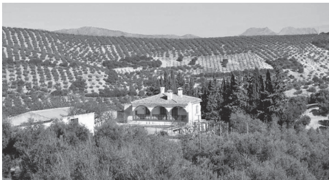
Vista actual del Cortijo de la Artillería (nº3 en plano).

Fotos de los actuales o ruinas de los antiguos cortijos mencionados en el plano de 1875.