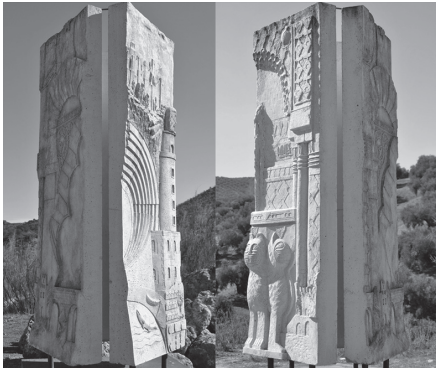
Actual monolito que recuerda al antiguo mojón del Entreicho.

Número 21, Mojon del Entredicho : que marcaría el límite tradicional del pueblo junto con el Arroyo del Cerezo que marcaría el límite natural. El actual monolito se encuentra justo en los límites donde aún las provincias limítrofes de Málaga, Córdoba y Granada, recordándonos así al Mojón del Entredicho antiguo que con la incorporación ya mencionada en el año 1900 de la Sierra del Pedroso al terreno de la Villa, se ve desplazado hacia el sur. Este actual mojón es autoría del escultor local Julián Hinojosa y data del año 2010. Presenta tres caras