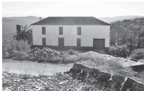
Vista actual del Cortijo del arroyo del puerco (nº6 en plano).