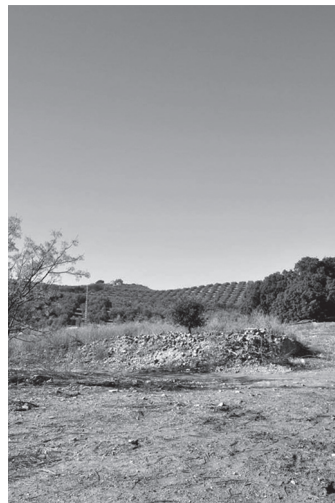
Restos del Cortijo de la Aulaguilla (nº 12 en plano).