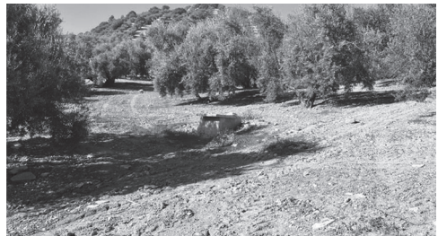
Vista actual de la fuente que se encuentra donde estuvo el Cortijo de las Cañas (nº4 en plano).