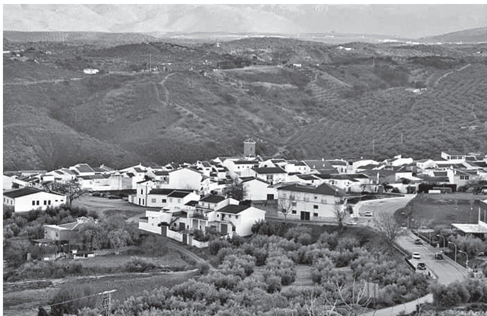
Villanueva de Tapia vista desde la carretera a Algaidas.