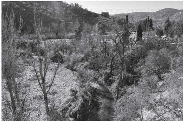
Molino harinero o del Conde junto al Arroyo del Cerezo, aguas que le permitían mover la rueda que molía el cereal (número 7 en plano).

Número 8, Mojón de la Cruz : no existe en la actualidad y marcaría el límite con el término municipal de Iznájar.