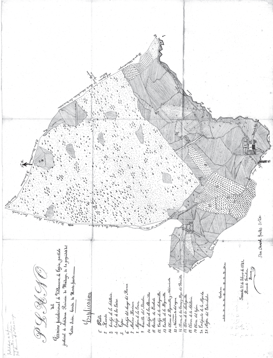
Plano original de 1875 autoría de Ricardo Sanchez Bueso por encargo del Conde de Montefuerte.