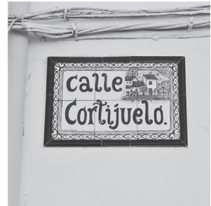
Actuales "Cortijuelos de Algaidas" hoy de Tapia junto a la placa que así recuerda su nombre (número 20 en plano).