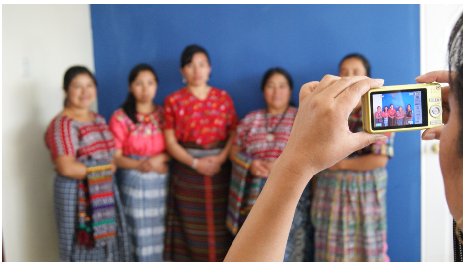
Imagen perteneciente a la exposición "Arte y Acción: Huipiles Tejidos de Identidad. Fotógrafa: Marcia Silva. Totonicapán, Guatemala, 2013. Imagen propiedad del Programa ICAT.

Al considerar la posibilidad de representar una manifestación artística desde sus portadores, cabe reflexionar sobre la manera de la cual se construye esta representación. Tal como una fotografía revela el ojo del fotógrafo, también cualquier otro tipo de representación de un objeto (artístico) dejará en evidencia cómo este objeto es percibido por el gestor de la representación. Al menos en el caso de la exposición del Colectivo Con Voz Propia , fue necesario que las mismas portadoras de los trajes desarrollaran todos los aspectos de su exposición, obteniendo un producto que difiere de patrones habituales de una exposición de arte.