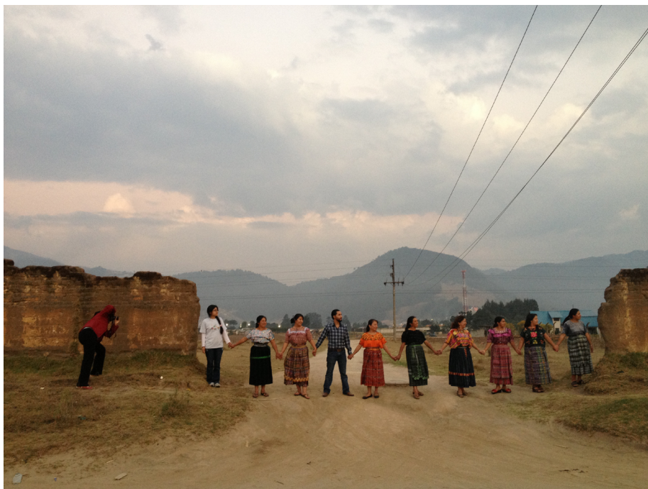
Algunos participantes del proyecto. Totonicapán, Guatemala, 2013.

Otro evento que influyó en la fundación de Con Voz Propia fueron las actividades publicitarias relacionadas con la supuesta profecía maya para el 21 de diciembre de 2012, ampliamente aprovechada por el Estado guatemalteco para incentivar el turismo. Esta coyuntura extremaba la contradicción bajo la cual viven las mujeres indígenas guatemaltecas, siendo utilizadas como la imagen que representa el país en el exterior, pero, al de igual manera, discriminadas e ignoradas como seres sociales 5 . Fue en estas circunstancias que el Colectivo Con Voz Propia se fundó como “... una expresión de un grupo de indígenas mujeres y hombres que en el marco guatemalteco desarrolla procesos de reivindicación y dignificación de la cultura maya, a través, del arte, la cultura, y la historia” 6 (2012).