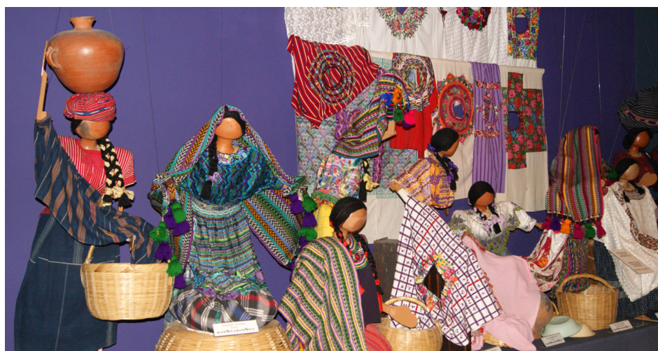
Imágenes pertenecientes a la exposición Arte y Acción: Huipiles Tejidos de Identidad . Arriba: Fotógrafa: Marcia Silva. Totoncapán, Guatemala, 2013. Abajo: Fotógrafa: Marcia Silva. Ciudad de Guatemala, Guatemala, 2013. Fotografías propiedad del Programa ICAT.