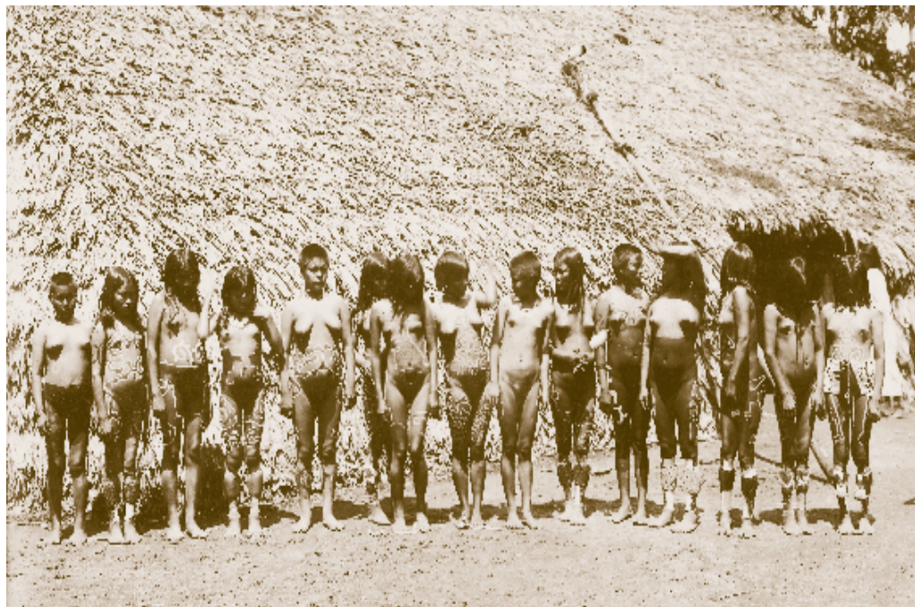
Ilustración 1 - Fotografía Mujeres Uitoto.