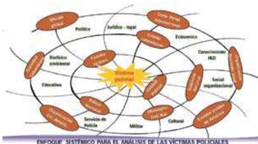
Figura 1. Dinámica del sistema “Víctima Policial”