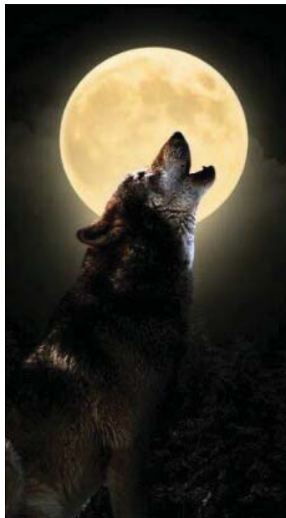
Ilustración 1. Imagen mostrada en un grupo de Telegram dedicado a “lobos solitarios”.

los que son encuadrados como “lobos solitarios”.