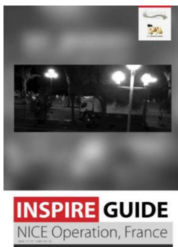
Ilustración 2. Guía sobre el atentado de Niza publicada por "Al Malaheem" (AQAP)

Este tipo de actores ejecutan su acción en solitario, en gran parte de los casos, debido a las directrices (más o menos directas) de una organización o líder con cuyo ideario se sienten identificados y al que juran lealtad.