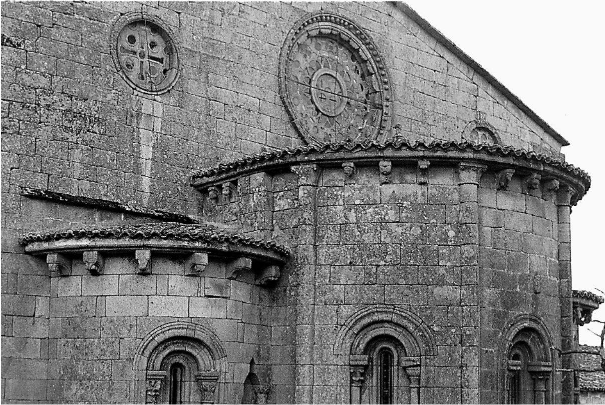
Sta. Mariña de Augasantas. Ourense Monumental.