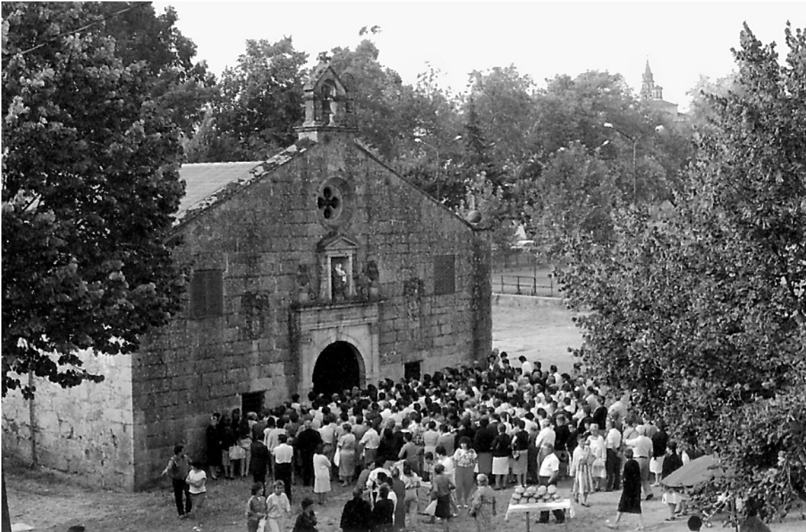
Virxen dos Remedios. Ourense Monumental .

e o poder santificador das imaxes relixiosas e das reliquias, bendicen boinas e panos, tocan a imaxe de San Pedro Martir e despois tocan as súas cabezas, enchen botellas de auga das fontes santas para rociar as súas casas as cortes e os campos. Levan terra ás casas, pan bendito do día de San Blas, da Candelaria, de San Antón, de San Xoán ou de San Benito. Na noite de Venres Santo queiman leña verde diante do Santísimo ou diante do monumento e fan lume nas igrexas para alonxar os malos espíritos.