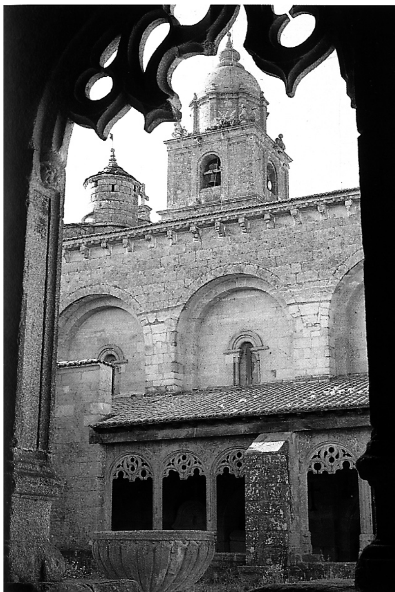
Xunqueira de Ambía. Ourense Monumental.

Tamén acoden á vila de Xunqueira de Ambía o día de San Pedro Martir. Pasan baixo as andas do santo un determinado número de veces en forma de cruz, tocan a imaxe do santo, pásanlle o pano, beben nas fontes santas, deixan en determinados santuarios un galo negro por crer que nese animal se mete o demo, deixando así libre ao poseso e quedando o espírito maléfico que o atenaza no galo.