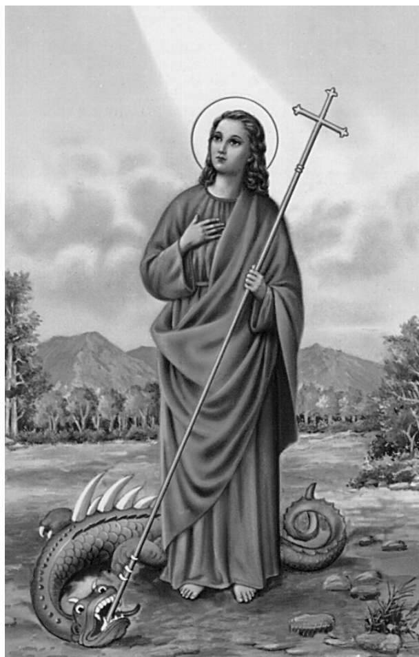
San Pedro Mártir, Sta. Marta

As nosas xentes, para curar os males do ouvido acoden a Santa Marta