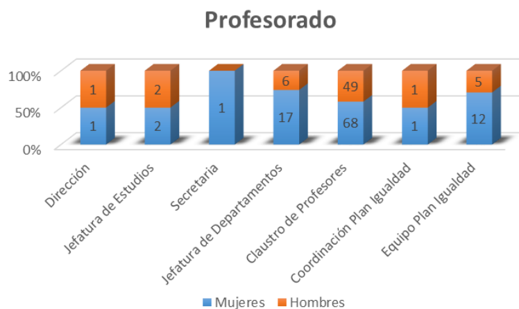
Gráfica 1. Distribución del profesorado del Centro

Equipo del Plan de Igualdad se compone de 17 docentes, de los cuales 12 son profesoras.