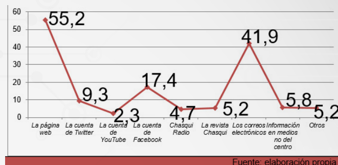
Figura 6 Canales (en %) que suelen emplearse para obtener información sobre las actividades de CIESPAL, según los encuestados (2014)

Según puede verse en la figura anterior, los encuestados reconocían que la página web y los correos electrónicos eran los principales canales que utilizaban para obtener información sobre las actividades organizadas por CIESPAL, en tanto que algunas de las plataformas propias del centro –como la revista Chasqui o el canal de radio–, así como la información producida en otros medios, obtenían los porcentajes más bajos, un indicio de que probablemente una gestión deficiente dificultaba la estimulación de comunidades de usuarios que interactuaban a través de esos espacios.