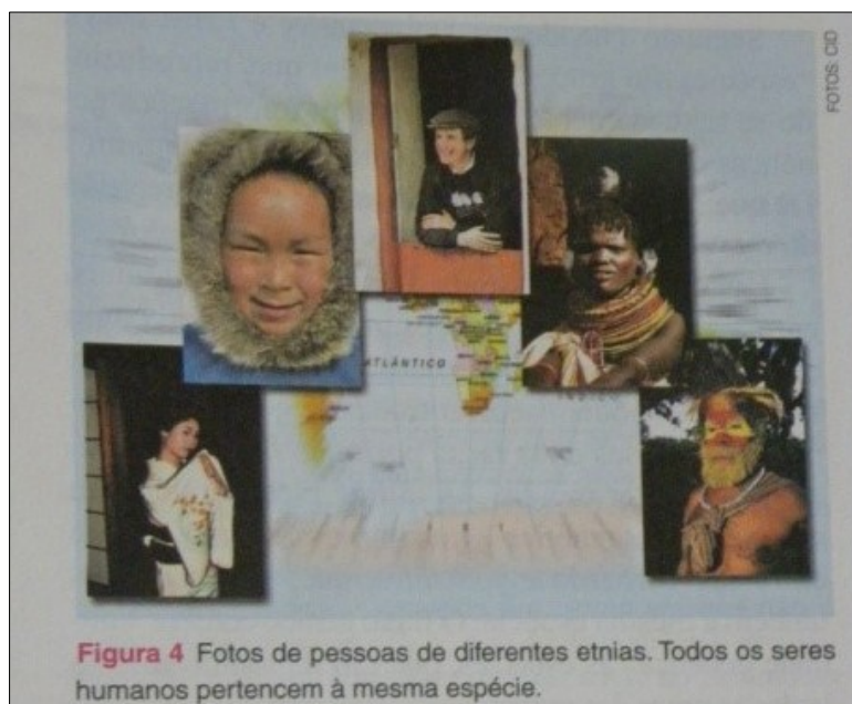
Figura 03: Embora o texto da imagem afirme a igualdade de todos os seres humanos, os grupos étnicos são dispostos em forma piramidal, e o ápice é ocupado por um homem branco. O viés hierárquico de Linné continua sendo expresso? – Extraído de FAVARETTO, J. A. e MERCADANTE, C. (2008), obra disponibilizada no PNLEM 2009.

Incidindo o foco da discussão sobre outro aspecto, nos importa dizer que não temos observado em alguns colegas, professores de ciências e biologia da educação básica, a capacidade de problematizar tais questões ou relacioná-las, muitas vezes, ao contexto histórico e político da utilização das ideias raciais e mais recentemente da emergência de discursos raciais classificatórios, elencados pelo recente movimento de ações afirmativas que se desenvolve no Brasil. Sobre este último, queremos destacar a presença de certo desconforto em alguns alunos que vivem a dificuldade de se classificar, contrapondo a suposta raça biológica à raça social (VIEIRA e CHAVES, 2012). Ou, ainda, quando se classificam e incorrem no risco de serem “re-informados” ou “re-classificados” por comissões instauradas com esta finalidade em instituições de ensino que adotam cotas raciais (MAGNOLI, 2009).