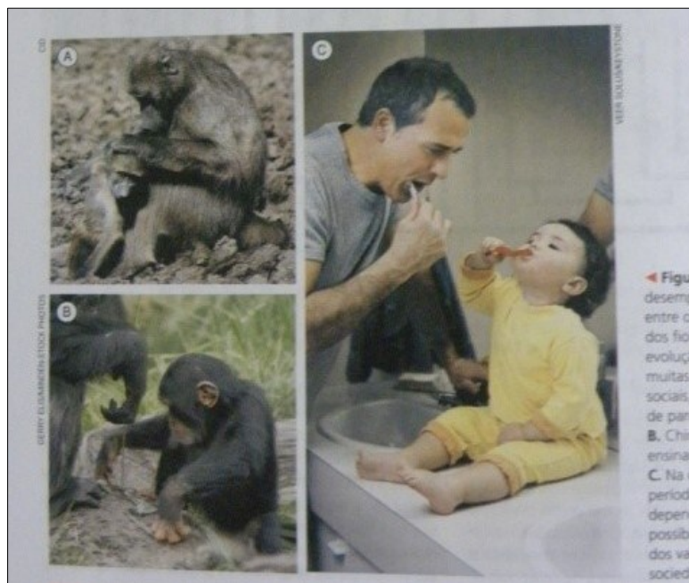
Figura 02: O tipo com menos imperfeições na espécie Homo sapiens é descrito por Linné no início deste texto " Branco... ..usuário de roupas justas " e que seria similar ao retratado na figura C da imagem 02 – Este é o Humano padrão? - Extraído de AMABIS, J. M. e MARTHO, G. R. (2008), obra disponibilizada no PNLEM 2009.