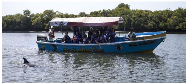
Figura N° 3.- Avistamiento de Delfines, (El morro la Reserva Hábitat de los Delfines, El Comercio)

Según el reportaje El maravilloso Puerto el Morro, (2014) “Llegar a Puerto El Morro es entrar en un espacio de cambio, de transformación constante, es vivir la evolución en carne de sus habitantes. La pesca fue por épocas, por centenares de años, la principal de sus actividades, además de la recolección de moluscos. Pero hace una década se dieron cuenta de que el escenario de sus rutinas resultaba novedoso y atractiva para muchos, que había gente dispuesta a pagar solo por conocer su entorno, por caminarlo un momento, por compartir con ellos el estuario y sus maravillas”. Este periodista en su reportaje mostro la biodiversidad de la zona, señalando la oportunidad que tienen los turistas de visitarlo y además resaltando que el turismo en la zona es de baja costo pero sus moradores atienden con alta calidad y predisposición, se muestra en la figura No. 3 el avistamiento de delfines