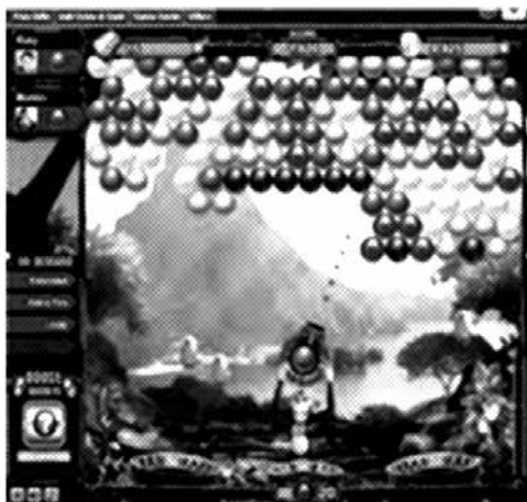
Figura 1. Modalidades de Distracción administradas a los participantes

que apuntara con el mouse y disparara bolas de colores para juntar un mínimo de tres para que así desaparecieran. El objetivo del juego consiste en que no se llene la pantalla de bolas de colores, para evitarlo el participante intentará eliminar un mayor número de bolas. Como herramienta de distracción convencional fueron usadas hojas con múltiples circunferencias y lápices de todos los colores. El objetivo de la tarea era que el participante coloreara el mayor número de elementos.