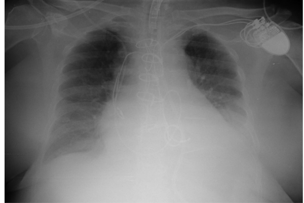
Figura 3. Radiografía antero-posterior de tórax postquirúrgica con rotura de los electrodos.

En este caso el tratamiento conservador mediante la ligadura de ambos extremos de la vena innominada resultó satisfactoria con implante de marcapasos al final de la intervención mediante la colocación de cables de estimulación epicárdicos. Debido a la