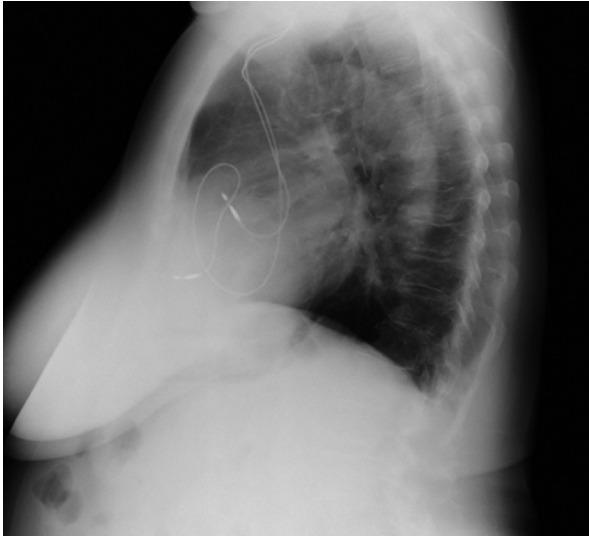
Figura 2. Radiografía de tórax lateral prequirúrgica. Se observa adhesión de los electrodos de marcapasos a la tabla interna del esternón.

mediante el empleo de una sierra recta tras lo que se produjo un sangrado masivo venoso súbito. Se observó junto con la hemorragia la aparición de electrodos en cavidad mediastínica. Una vez controlado el sangrado, la rotura del tronco venoso braquiocefálico y ambos electrodos de estimulación cardiaca con la sierra de apertura esternal, se hizo evidente. Se realizó ligadura de ambos extremos de la vena innominada para conseguir un definitivo control del sangrado incluyendo los extremos de ambos electrodos seccionados (Ver Figura 3). Se comprobó que el corazón latía espontáneamente sin cambios electrocardiográficos y la paciente presentó normalidad hemodinámica. Tras la sutura del tronco braquiocefálico se procedió a realizar la intervención sobre la válvula mitral de manera rutinaria, sin