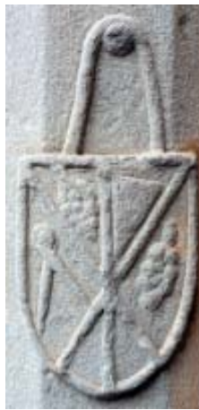
Claustro del Carmen, Detalle.