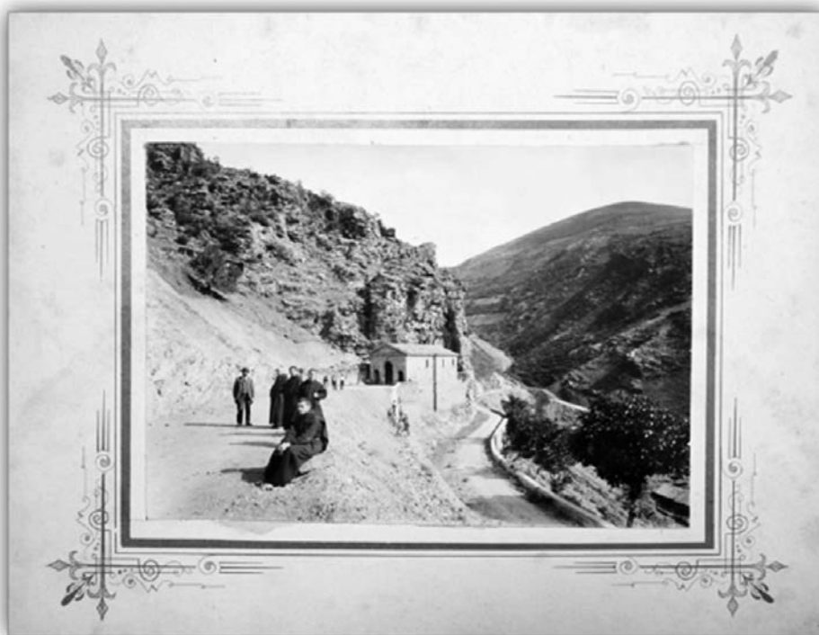
Figura 5. Santos Fernández [y] Santos, Ermita del Santo Cristo en Valvanera (Museo de La Rioja, Logroño).