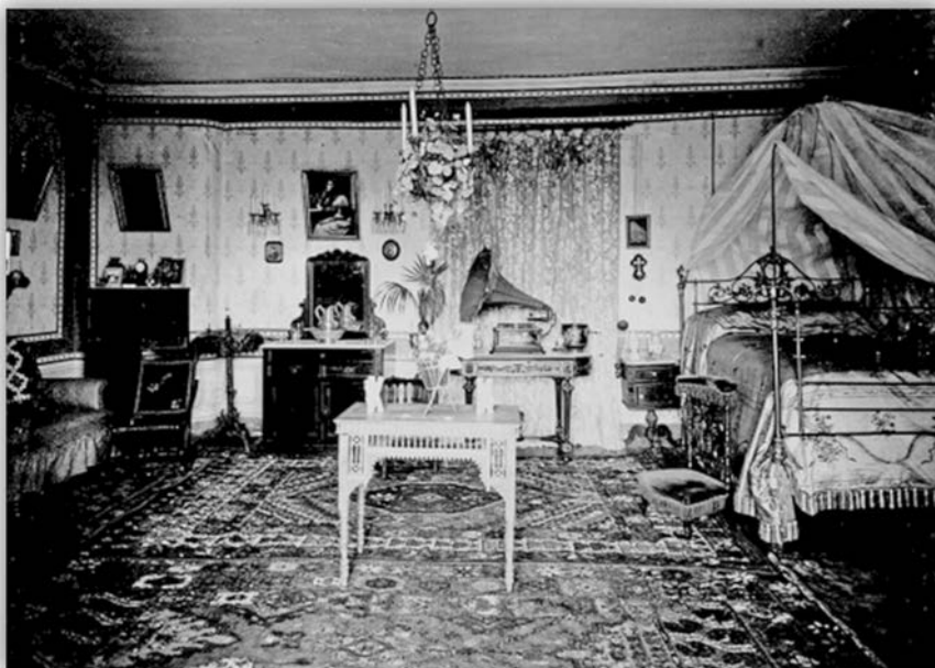
Figura 3. Santos Fernández [y] Santos, Dormitorio con fonógrafo en la vivienda de la Hacienda de Somalo, h. 1908, Álbum del Señorío de Somalo (AIS).