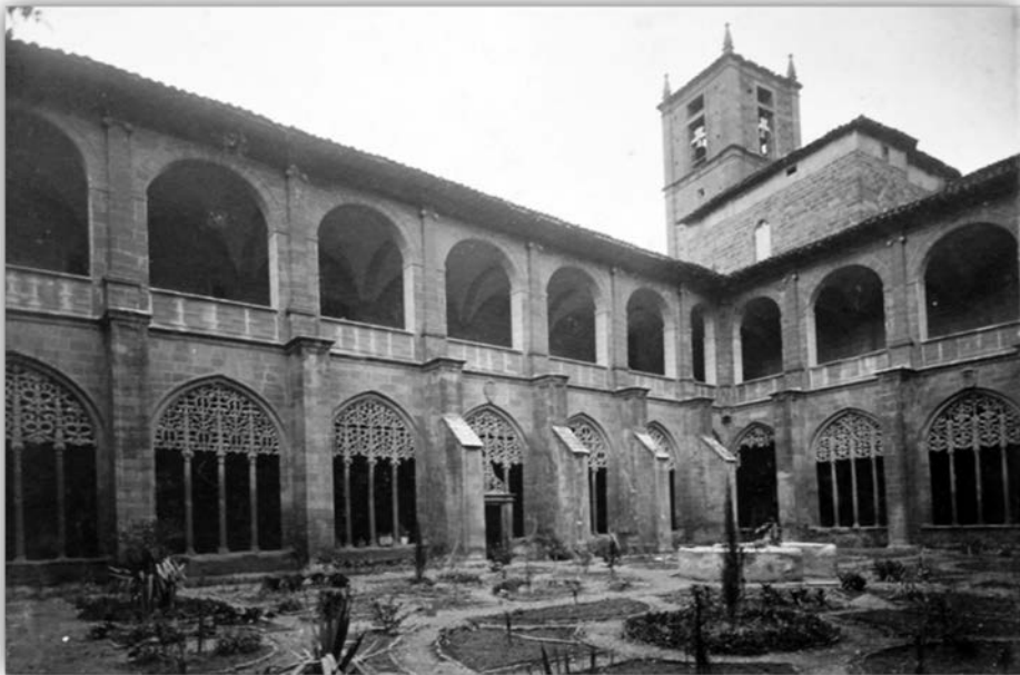
Figura 9. Santos Fernández [y] Santos, Claustro de los Caballeros del Monasterio de Santa María la Real de Nájera, h. 1907 ( Museo de La Rioja, Logroño ).

una imagen del coro alto y una última capturada desde el interior del patio del Claustro de los Caballeros (fig. 9).