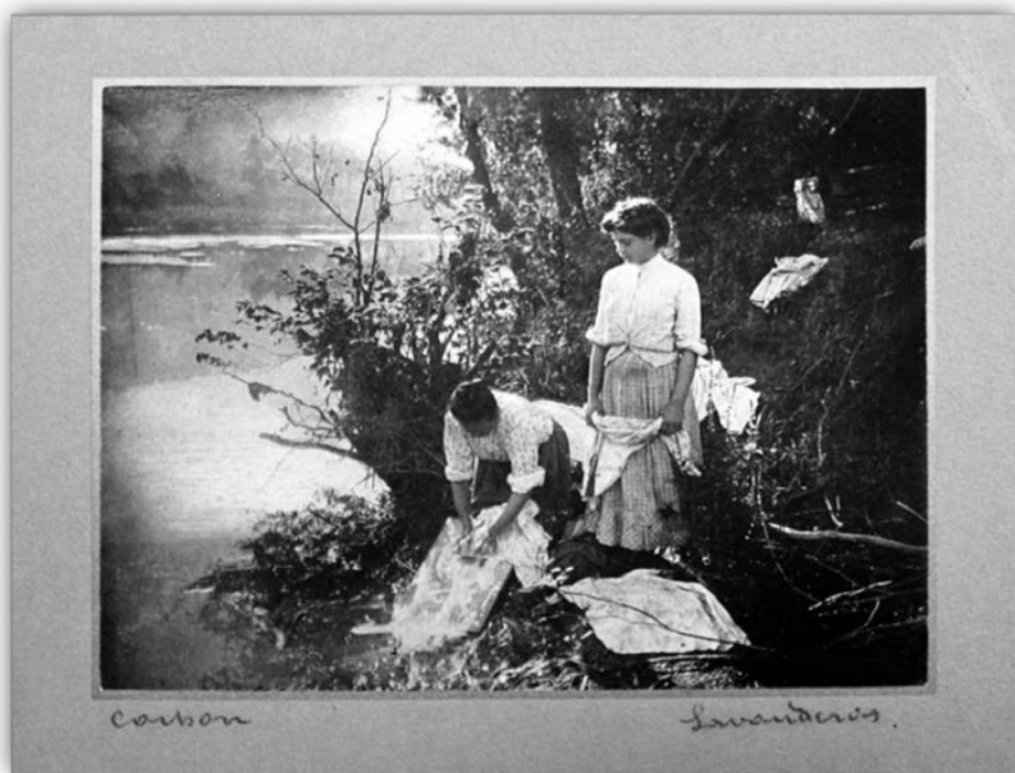
Figura 7. Santos Fernández [y] Santos, Lavanderas (Museo de La Rioja, Logroño).

conforman una serie presentada a un mismo concurso, ya que presentan números correlativos en el dorso (286, 287 y 288). Presentadas bajo el lema “Baskonia” y el pseudónimo “Renem”, están realizadas mediante la técnica fotográfica del carbón y tienen por protagonistas a diferentes mujeres. Dos de ellas presentan a una ( Contra-luz ) y dos mujeres ( Lavanderas ), respectivamente, lavando la ropa a orillas de un río (fig. 7). La tercera y última titulada Paisaje también gira en torno a la figura de una mujer con amplia vestimenta, aunque en este caso pasea por un bosque de ribera con un gran cesto bajo su brazo izquierdo. En el resto de fotografías presentadas a concurso aparecen una religiosa recostada en la esquina de una habitación diáfana, una mujer sesteando sobre una mesa de comedor, un bello estanque y una escena en la que unos animales de tiro sacan una barca hacia el mar.