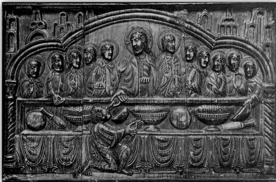
Figura 8. Santos Fernández [y] Santos, Relieve en marfil del Arca de San Felices representando la Cena del Señor, Fototipia de Hauser y Menet (BSEE, 1 de marzo de 1908, Madrid, vol. 16).

Romea escribió la obra Historia de la Arquitectura Cristiana Española en la Edad Media , según el estudio de los elementos y los monumentos, obra en la que introdujo una fotografía de los capiteles de San Millán de la Cogolla 41 .