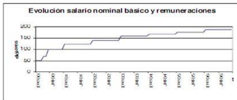
Gráfico 1.

A continuación se observará una gráfica de los incrementos en las remuneraciones nominales básicas. Estos incluyen para su cálculo, el salario básico unificado fijado por el CONADES cada año, sumado el décimo tercer y décimo cuarto sueldo (divididos cada uno para 12, para tener su valor mensual) y más las remuneraciones sectoriales unificadas (llamadas así desde el 2005) que corresponden hoy a 8 dólares.