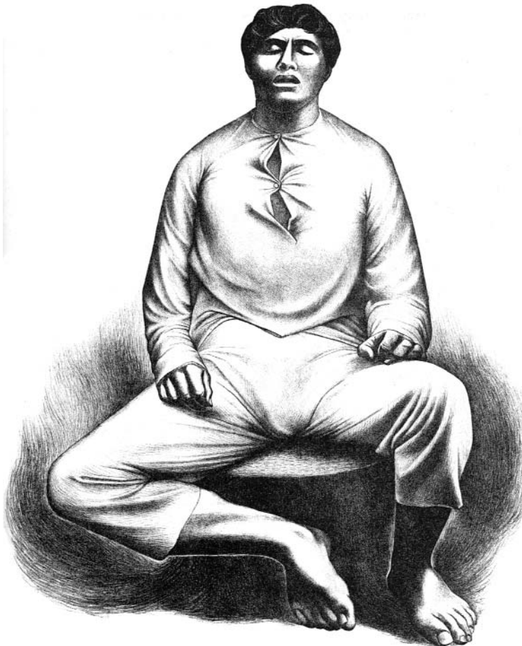
José Chávez Morado, Cadáver sentado , 1939.

Una vez que se ha realizado un riguroso balance del campo mexicano, el autor termina con la delineación de tres escenarios a los que conducen las tendencias que se fueron perfilando a lo largo del libro. El primero es malo, el segundo es triste pero soportable, y el tercero, optimista. El autor considera que el escenario catastrófico es improbable pero no imposible. Este supone presión adicional sobre la tierra y el resurgimiento del enfrentamiento agrario cuando ya no hay tierra susceptible de reparto ni márgenes significativos para su redistribución. En el libro se ha hecho ver que no hay campesinos desposeídos ni solicitantes de tierra como grupo importante y creciente de la población. Se vio también que es muy probable que el relevo generacional contribuya a la compactación de la tierra en la medida en que muchos sucesores se ocupen en actividades distintas a las agropecuarias. Pero la demanda de tierras puede surgir por otras causas, como las movilizaciones políticas. Ya que en el campo hay insatisfacción, descontento y mucho agravio, su manipulación puede conducir a sectarismos e intolerancias. Hay organizaciones políticas que quisieran volver al pasado. Las viejas centrales campesinas pueden pretender volverse interlocutoras exclusivas y privilegiadas. Quieren convertirse en las voces que deben ser oídas, cuando las voces mayoritarias en el campo están dispersas, desarticuladas y sin representación. La derecha podría intentar la