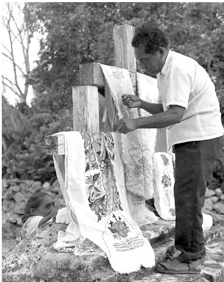
Cambio de sudarios a las cruces protectoras del pueblo, Xocén / Christian Rasmussen.

Se estudia el crecimiento con desigualdad. Se realiza un seguimiento del comportamiento que tienen durante todo el siglo la agricultura, la ganadería, la silvicultura y, en alguna medida, la pesca. Como en los otros puntos prosigue una sugerente combinación entre tiempo y espacio. Hay una preocupación en el autor porque los datos nacionales no desdibujan las especificidades regionales. A inicios del siglo