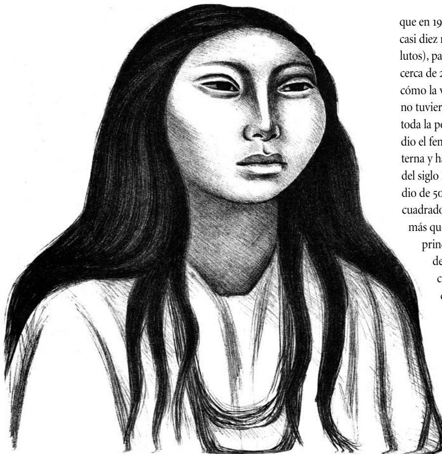
Raúl Anguiano, Ná K'in , 1951.