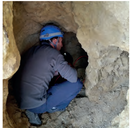
El interior de la cueva sigue siendo un lugar angosto debido a los sucesivos derrumbes.

Aunque la cueva ya debía haber colapsado en parte ya entrado el siglo XX, con la llegada del riego mecanizado, la tierra de labranza situada