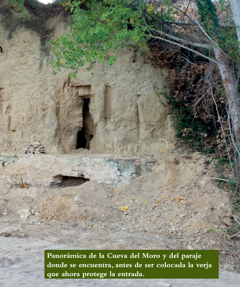
Panorámica de la Cueva del Moro y del paraje donde se encuentra, antes de ser colocada la verja que ahora protege la entrada.