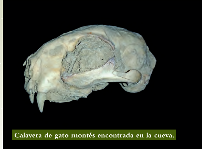
Calavera de gato montés encontrada en la cueva.