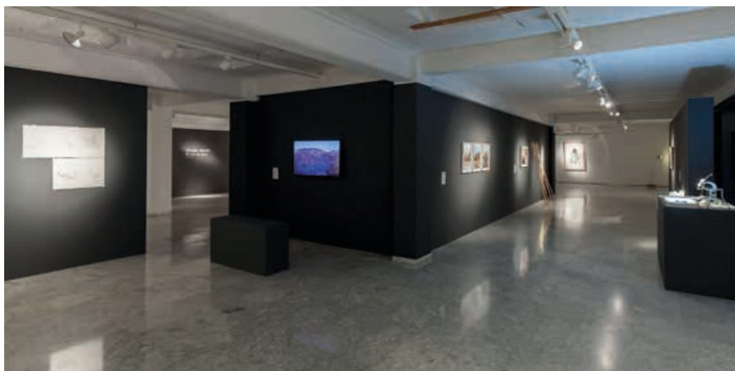
Vista de la exposición de la XXXI Muestra de Arte Joven en La Rioja. Sala de exposiciones de la ESDIR. Logroño 2015.