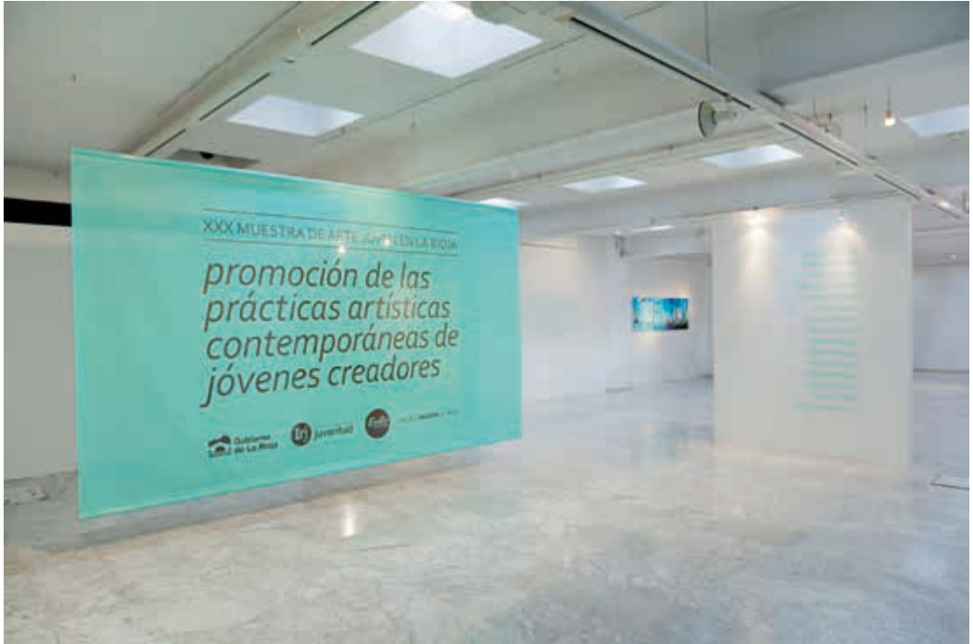
Vista de la exposición de la XXX Muestra de Arte Joven en La Rioja. Sala de exposiciones de la ESDIR. Logroño 2014.