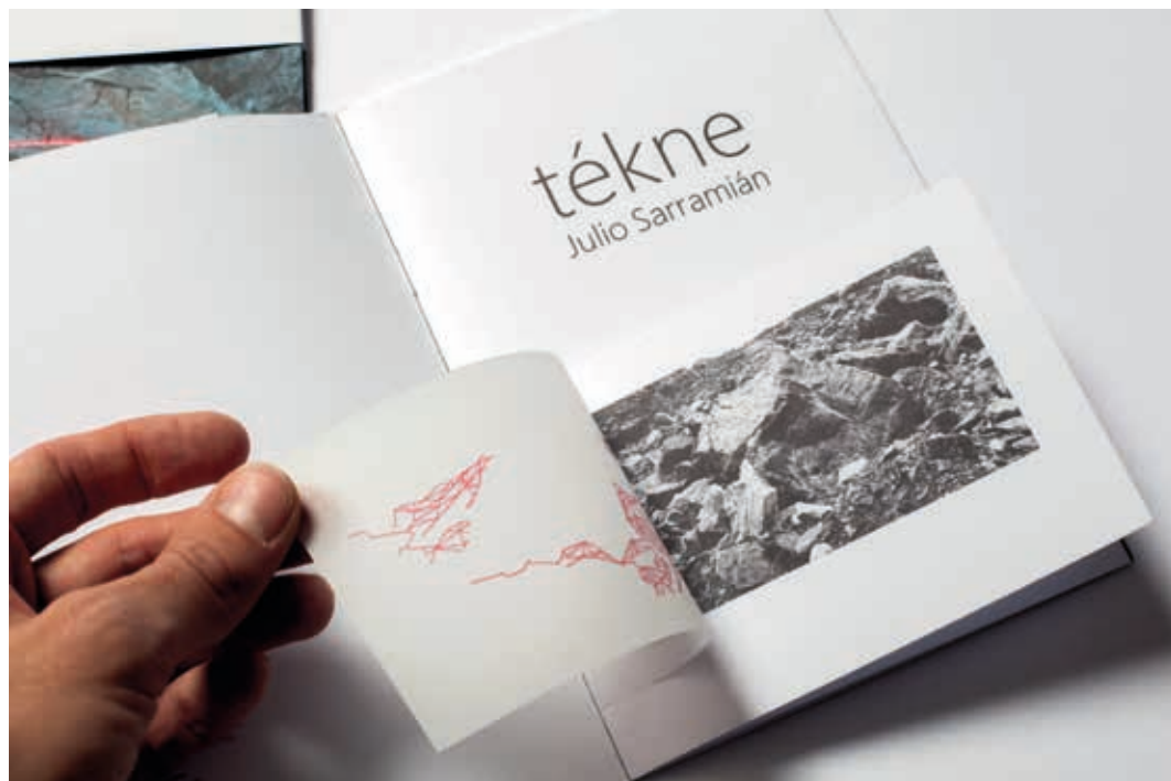
Catálogo de la exposición de Julio Sarramián. Proyecto seleccionado en XXX Muestra Tutora Mónica Yoldi. Sala del IRJ. Logroño 2015.