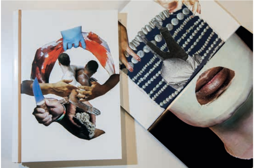
Catálogo de la exposición de Daniel Llaría. Proyecto seleccionado en la XXX Muestra. Tutor Jesús Rocandio. Sala del IRJ. Logroño 2015.