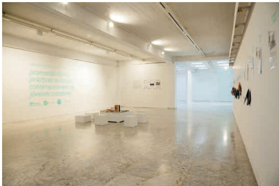
Vista de la exposición de la XXX Muestra de Arte Joven en La Rioja. Sala de exposiciones de la ESDIR. Logroño 2014.