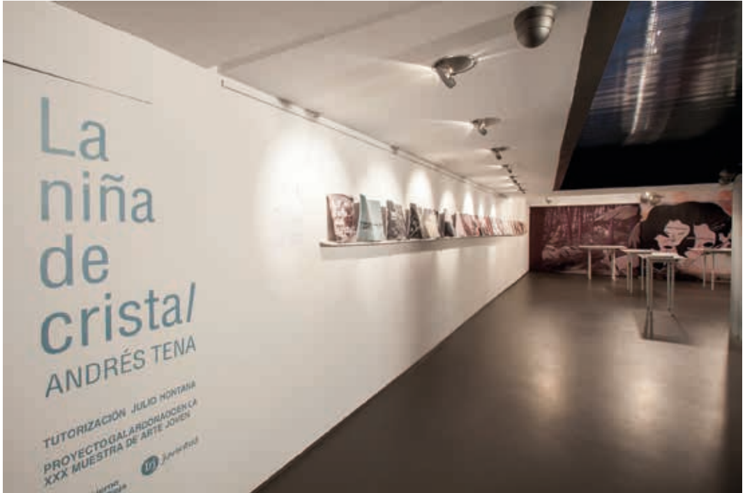
Vista de la exposición de Andrés Tena. Proyecto seleccionado en la XXX Muestra. Tutor Julio Hontana. Sala del IRJ. Logroño 2015.