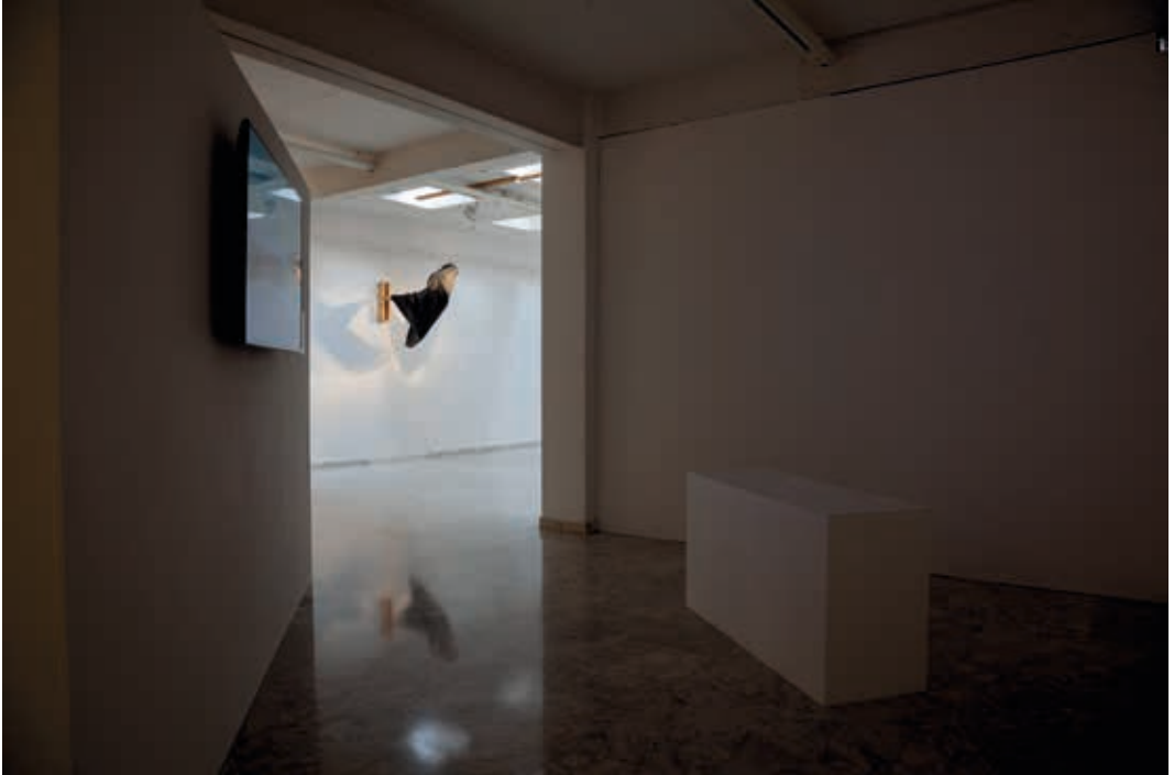
Vista de la exposición de la XXX Muestra de Arte Joven en La Rioja. Sala de exposiciones de la ESDIR. Logroño 2014.