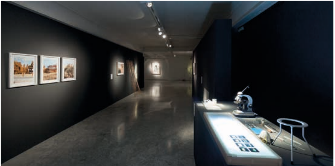
Vista de la exposición de la XXXI Muestra de Arte Joven en La Rioja. Sala de exposiciones de la ESDIR. Logroño 2015.