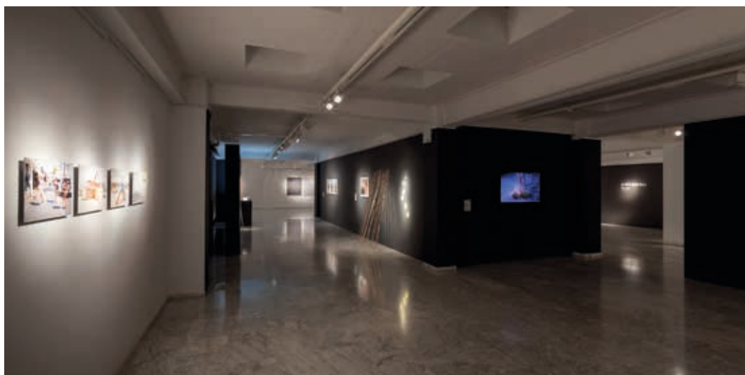
Vista de la exposición de la XXXI Muestra de Arte Joven en La Rioja. Sala de exposiciones de la ESDIR. Logroño 2015.