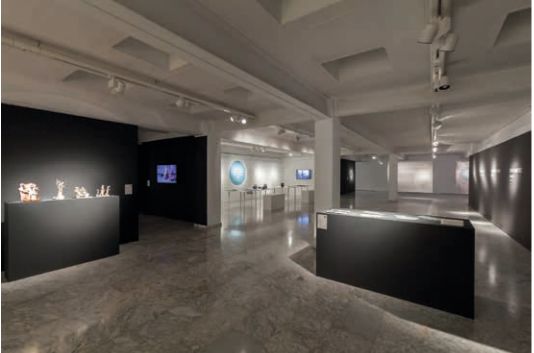
Vista de la exposición de la XXXI Muestra de Arte Joven en La Rioja. Sala de exposiciones de la ESDIR. Logroño 2015.