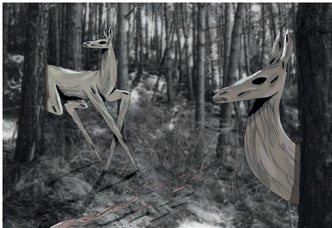
Sonidos. Técnica mixta. 2015.