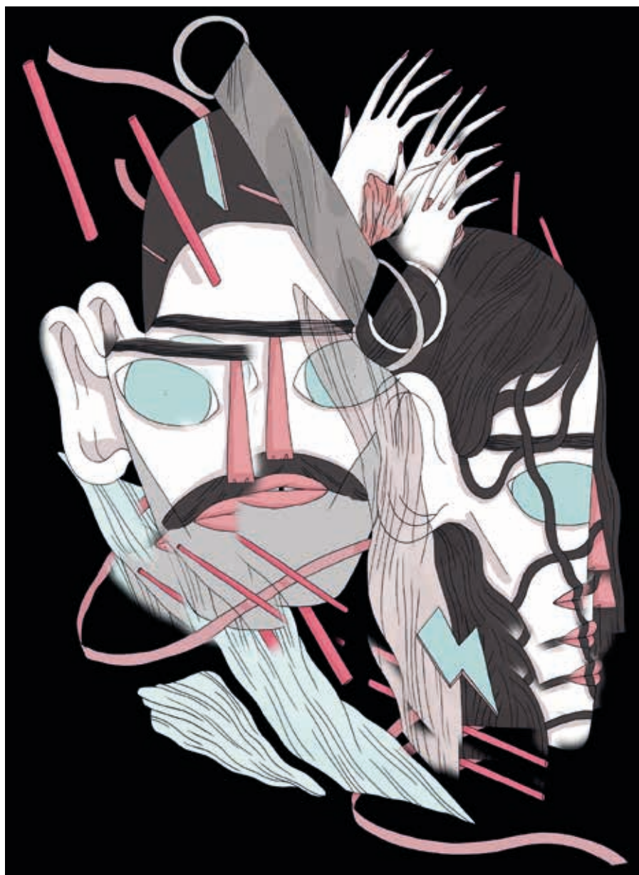
Sin título. Técnica mixta. 2016.