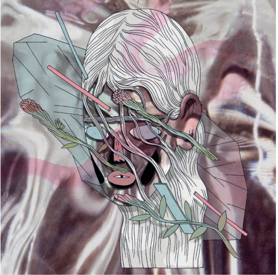
Bullet chaine. Técnica mixta. 2015.