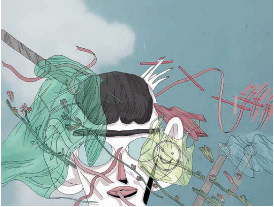
Sin título. Técnica mixta. 2016.