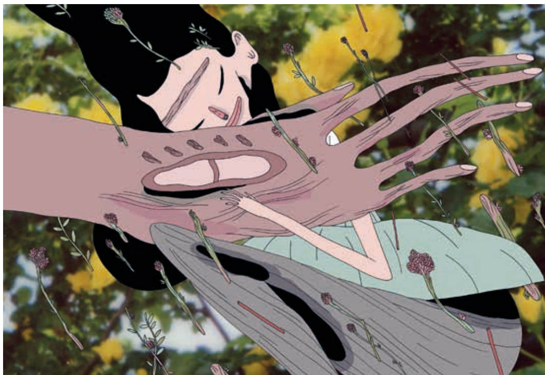
Sin título. Técnica mixta. 2015.