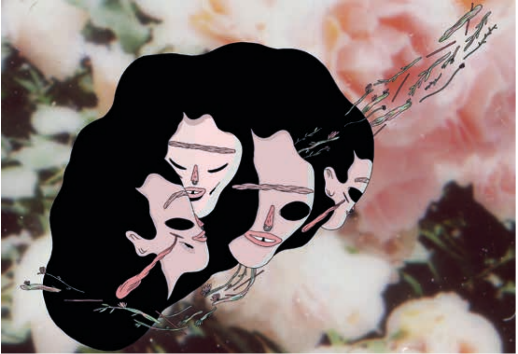
La niña de cristal. Técnica mixta. 2015.