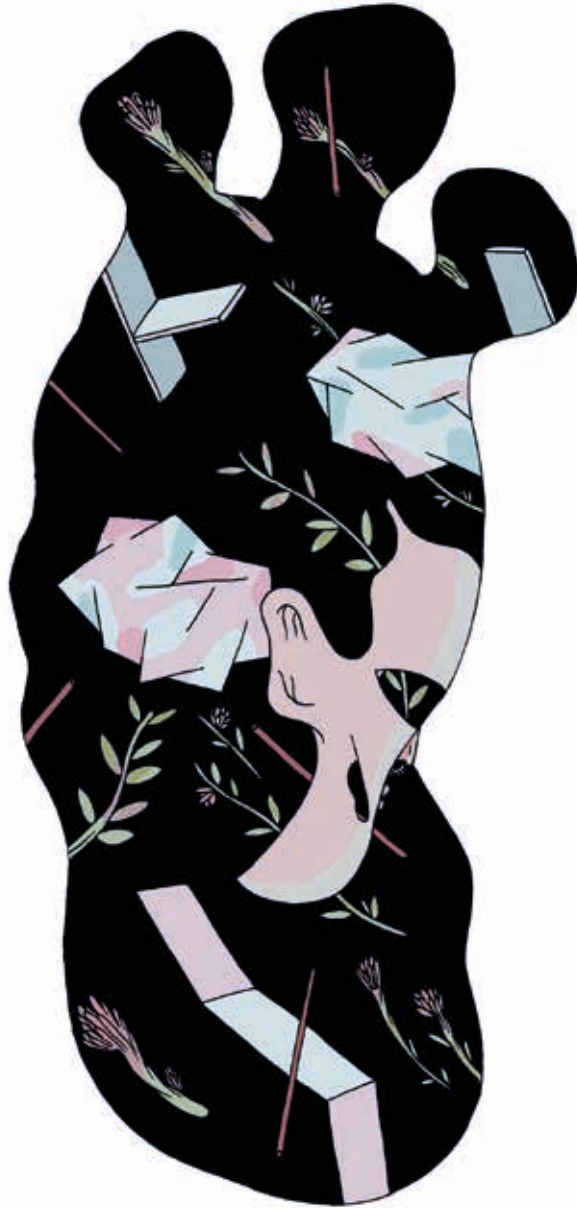
Niña de cristal. Técnica mixta. 2015.