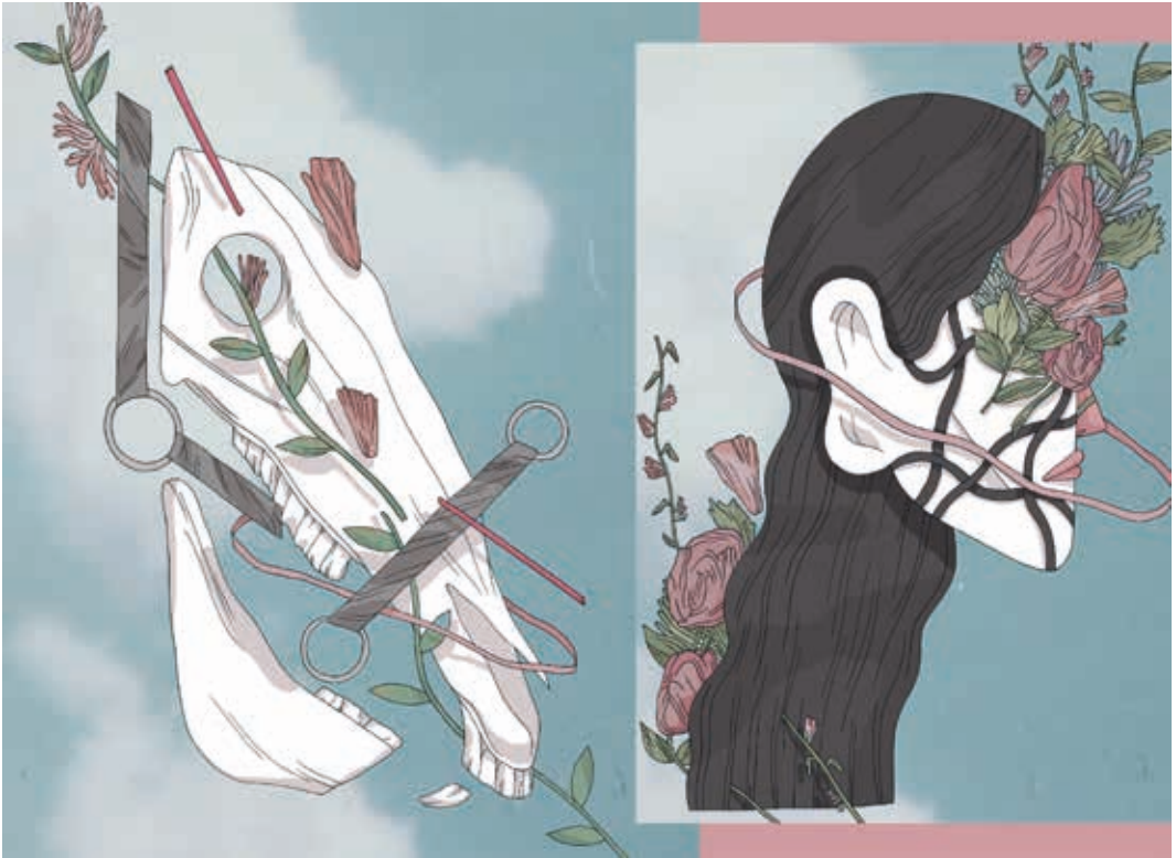
Astenia. Técnica mixta. 2016.