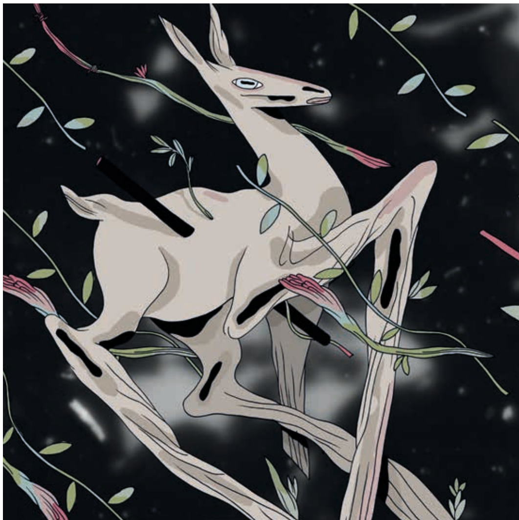
Doe Deer. Técnica mixta. 2015.