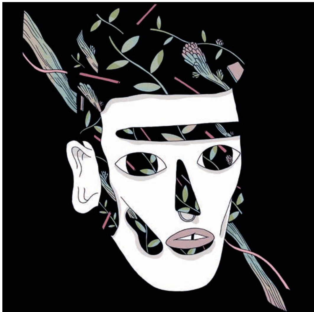
Autorretrato. Técnica mixta. 2015.