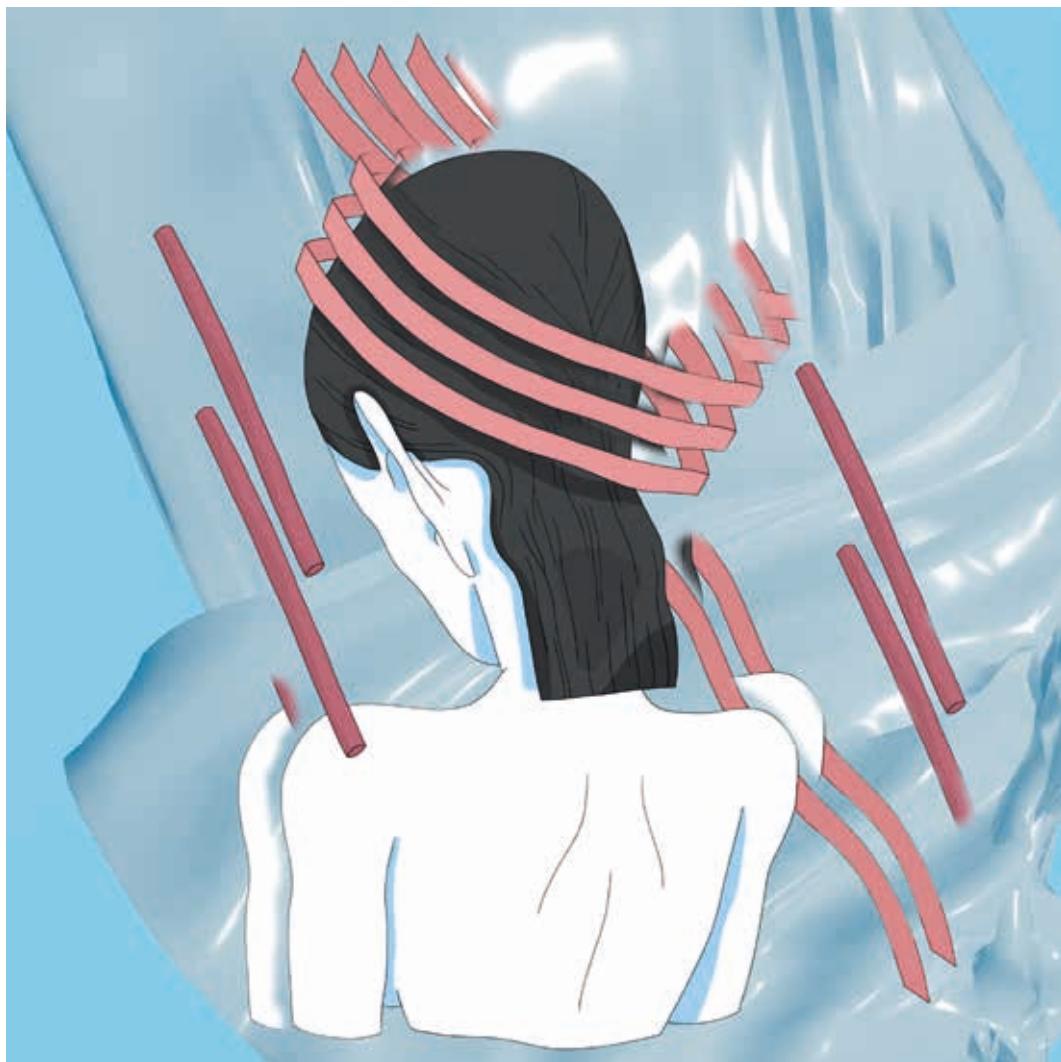
Virgen. Técnica mixta. 2016.