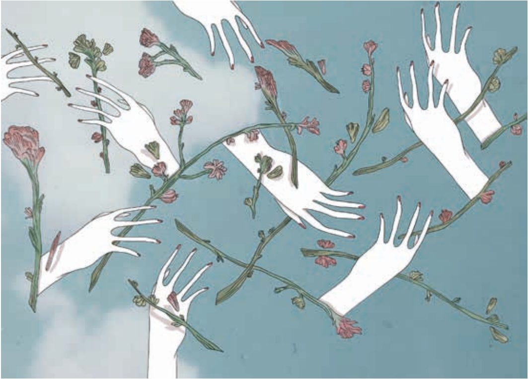
Astenia. Técnica mixta. 2016.